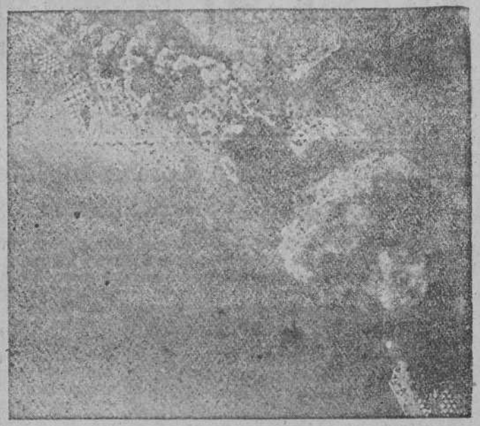
Impresionante foto aérea tomada por un aparato de recono- cimiento alemán poco tiempo después de un bombardeo sobre los depósitos de petróleo de Thameshaven, en Inglaterra.