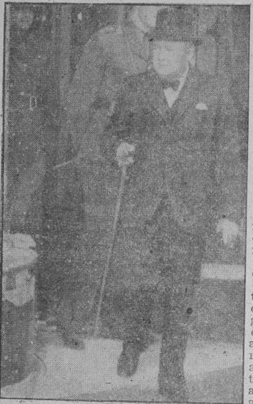
Mr. Churchill aprovecha un alto en el bombardeo alemán para visitar las instalaciones portuarias de Ramsgate, donde se pudo convencer de la eficacia del arma aérea alemana.

Berlín, 1.—La Agencia D. N. B. comunica que un grupo de "Stukas" alemanes ha obtenido esta mañana un gran éxito al conseguir dispersar un convoy británico cerca de la costa sureste de Inglaterra. Nueve barcos ingleses con un desplazamiento total de 22.000 toneladas han sido hundidos. Otros tres barcos con un total de seis mil toneladas, entre ellos un crucero de segunda clase, han resultado gravemente averiados por las bombas alemanas. — EFE.