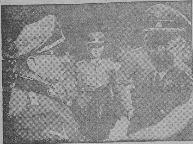
En uno de los puentes del Reich y de la SS. Himmler, conversando con el comandante de la guardia personal del Führer, Sepp Dietrich.