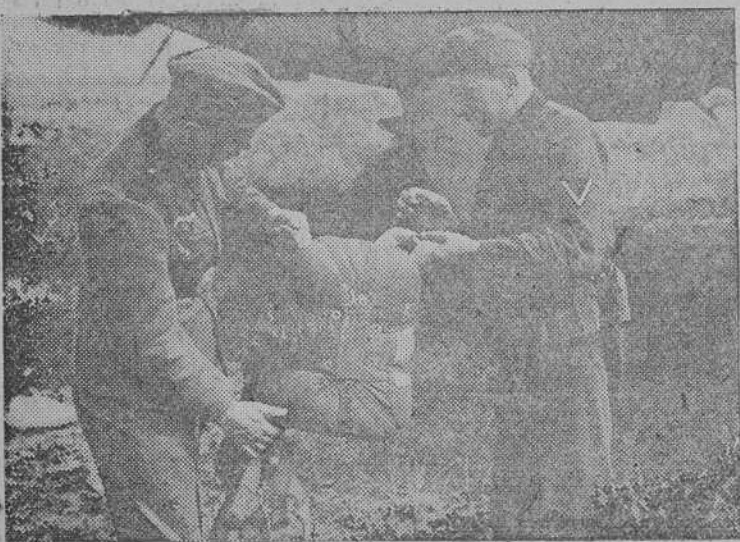
La escuadrilla se prepara para la salida.