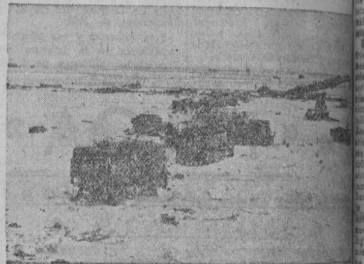
Huellas de la "genial retirada" del ejército expedicionario inglés, en la costa del Canal de la Mancha.

Nueva York, 4.—El candidato republicano a la presidencia Wilkie, ha dado su aprobación al acuerdo anglo-americano, aunque hace observar que el Presidente Roosevelt, que se dice defensor de la democracia, no ha tenido en cuenta los procedimientos democráticos, como por ejemplo la obligada consulta al congreso federal.—EFE.