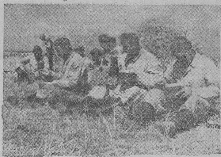
Hora del rancho en el campamento de zapadores en Francia.

Londres, 4.—Un capitán de la aviación británica, que tomó parte en uno de los ataques aéreos contra Berlín ha declarado que el raid se realizó en noche muy oscura y sin luna y que hubo necesidad de lanzar paracaídas luminosos para localizar los objetivos. Añadió que los reflectores alemanes ayudaron con sus potentes luces a los pilotos británicos, los cuales pudieron ver perfectamente la Avenida de Unter dem Linden y el campo de deportes.—EFE.