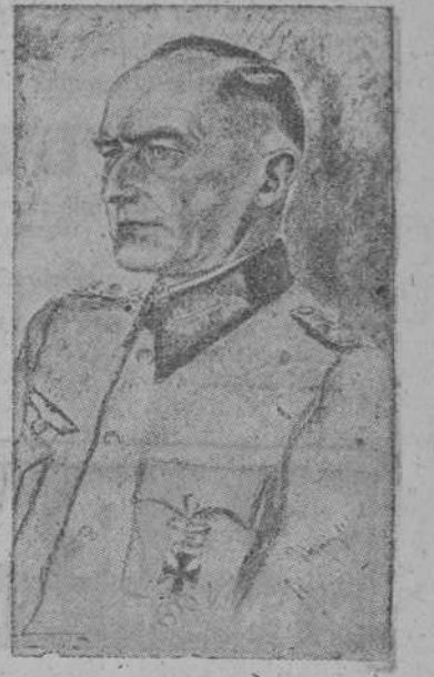
Witzleben, Mariscal de Campo