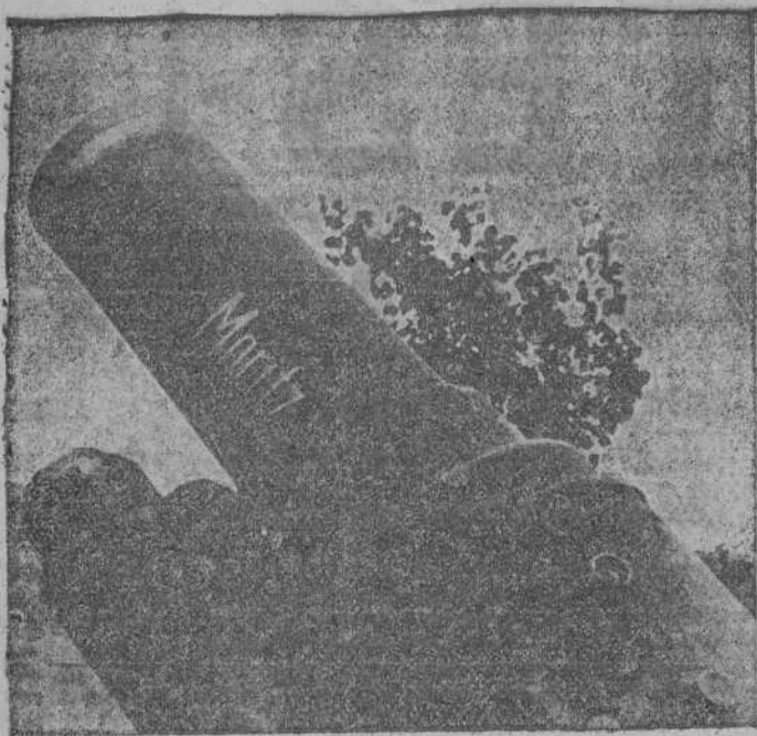
Pieza pesada de la artillería alemana que el humor de un artillero bautizó con el nombre de un pilluelo de la literatura infantil