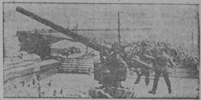
Antiáereos de la artillería de Marina alemana en la costa del Canal de la Mancha

Se destaca la extraordinaria pureza en la operación, pues no se facilitó pignoración de ninguna clase con posible destino en la suscripción. Pero lo que en los medios bancarios y económicos se subraya de manera más destacada, es la participación del ahorro privado por la extraordinaria cantidad de mil ochenta y nueve millones de pesetas. Puede juzgarse