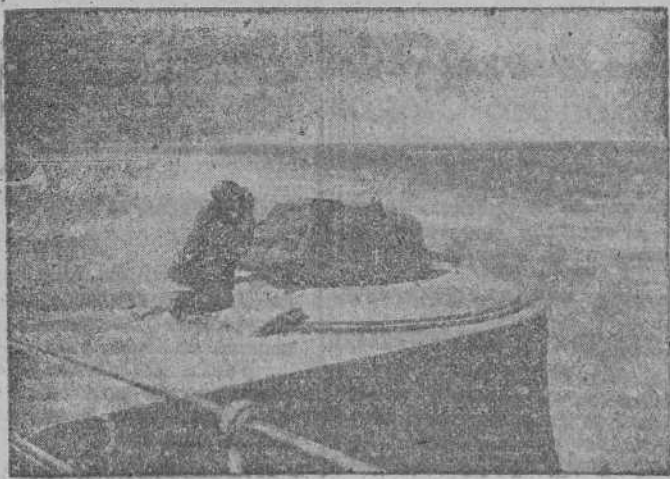
Desde el Cabo Norte hasta el Golfo de Vizcaya, las fuerzas armadas del Reich protegen las costas del Continente. Detalle de la defensa costera en Bélgica

Shanghai, 8.—Las autoridades han protestado enérgicamente acerca de las autoridades americanas por la detención brutal de los marineros japoneses efectuada ayer. La nota de protesta da a entender que se reservan el derecho de pedir una indemnización por este atentado de la marina americana.—EFE.