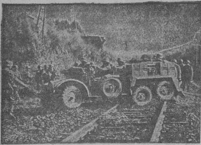
COLUMNA ALEMANA MOTORIZADA, AVANZANDO POR UNO DE LOS FRENTES DE FRANCIA