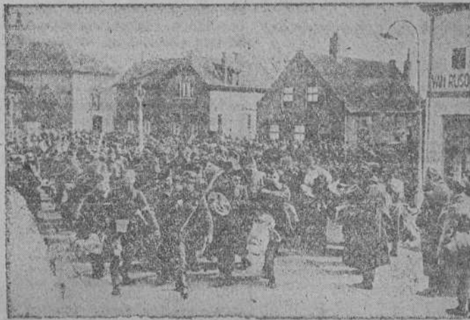
LAS GRANDES MASAS DE PRISIONEROS QUE LOS ALEMANES HICIERON EN LOS FRENTES DE OCCIDENTE. DESPIERTAN LA CURIOSIDAD DE LA RETAGUARDIA CONQUISTADA

mientos de maquinaria y depósitos militares del territorio no ocupado serán entregados intactos. Los puertos, fortificaciones permanentes y arsenales de construcción naval no podrán ser destruidos o averiados. El Gobierno francés facilitará la repatriación de la población al territorio ocupado. El Gobierno francés impedirá la transferencia de los objetos de valor y depósitos del territorio ocupado al no ocupado. Todos los prisioneros de guerra habrán de ser puestos en libertad y el Gobierno francés entregará además a todos los súbditos alemanes indicados por el Gobierno alemán, que se encuentran en Francia o en sus colonias. El armisticio entrará en vigor en cuanto se firma el armisticio con Italia. El cese de las hostilidades se efectuará seis horas después de que el Gobierno italiano notifique dicha firma.—EFE.