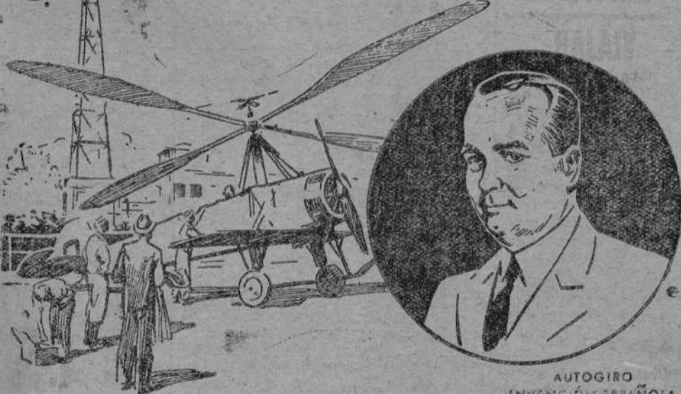
AUTOGIRO INVENCIÓN ESPAÑOLA JUAN DE LA CIERVA 1895-1936

Todos los grandes inventos son fruto de ideas luminosas. Existen en el universo materias y energías, que utilizadas con el acierto de una feliz idea producen efectos asombrosos. He aquí el secreto de la INSTANTINA, combinación especial de eficacísimos elementos terapéuticos, inocuos y seguros, que cortan con la máxima rapidez los resfriados y sus consecuencias así como toda clase de dolores.