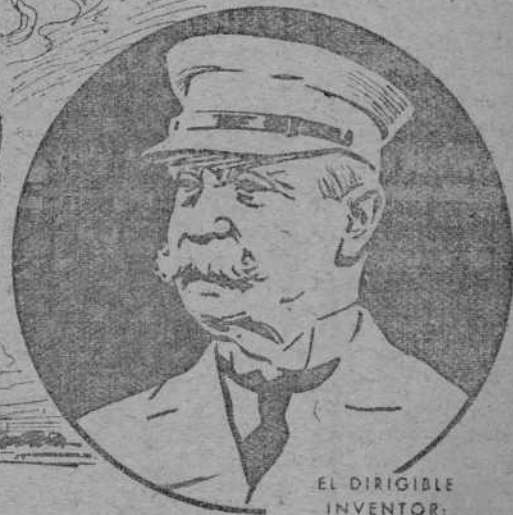
EL DIRIGIBLE INVENTOR: CONDE DE ZEPPELIN 1838-1917

Todos los grandes inventos son fruto de ideas luminosas. Existen en el universo materias y energías, que utilizadas con el acierto de una feliz idea producen efectos asombrosos. He aquí el secreto de la INSTANTINA, combinación especial de eficacísimos elementos terapéuticos, inocuos y seguros, que cortan con la máxima rapidez los resfriados y sus consecuencias así como toda clase de dolores.