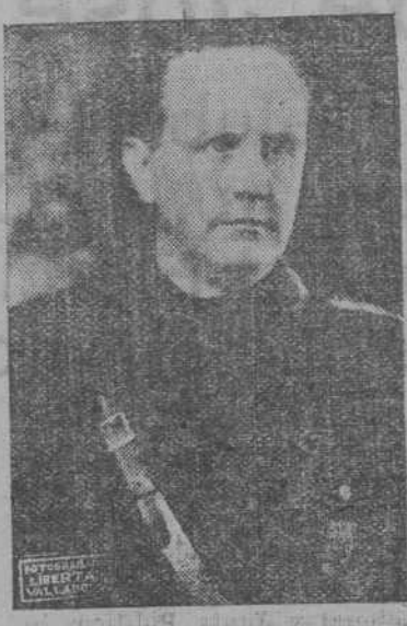
FOTOGRAFIA DE JOSÉ ANTONIO

Y sin embargo, los antecedentes sociales de José Antonio, el medio en que viviera, su profesión y su formación intelectual, fueron la causa de que unos dudasen de la sinceridad de sus propósitos, otros de su acierto en plantearles y otros, incluso algunos que luchaban a su lado y que luego volvieron a él con tritos y confesos de la equivocación que habían sufrido, de no aceptar a un explicarse por qué no se sumaba a sus manejos y oscuras conveniencias, o a los privilegios de la clase a que pertenecía.