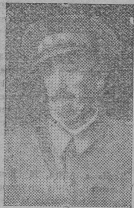
He aquí la faz del bravo coronel Moscardó, que mandaba las huestes de la fortaleza alcazarina, al entrar las fuerzas libertadoras: don José Moscardó Ituarte.

Sublime serenidad en los semblantes, que vuelven los ojos ha-