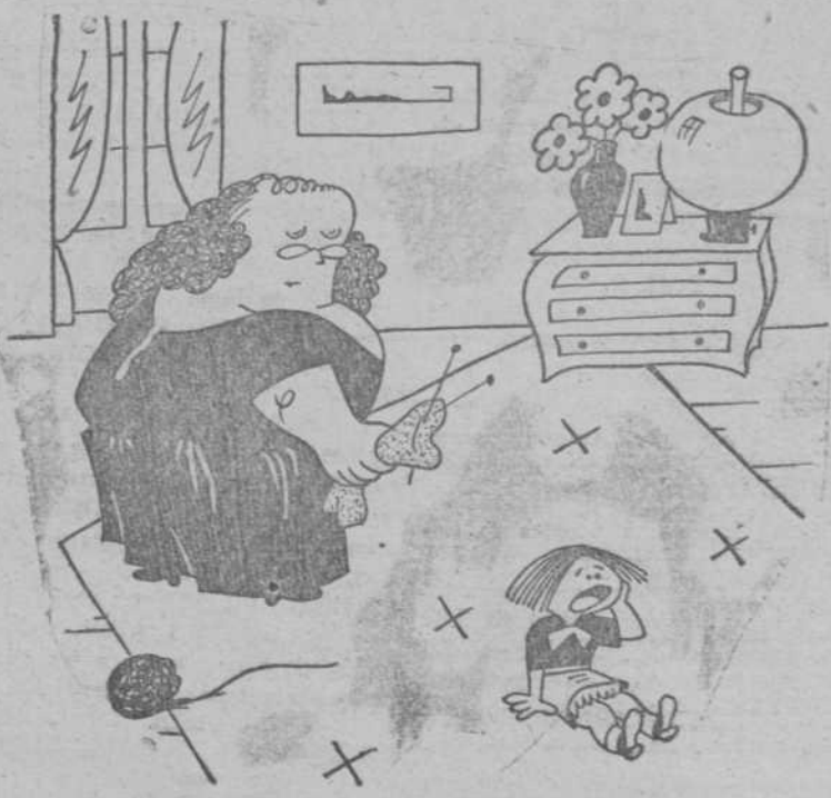
--¿Por qué lloras, guapina? --Ya no me acuerdo...