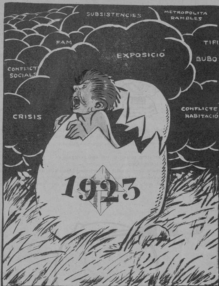
L'ANY NOU TREU EL CAP.

Sempre ens queda l'esperança de que, no acostumats a menjar molt els demés dies de l'any, els agafi una indigestió i se'n vagin a l'altre món.