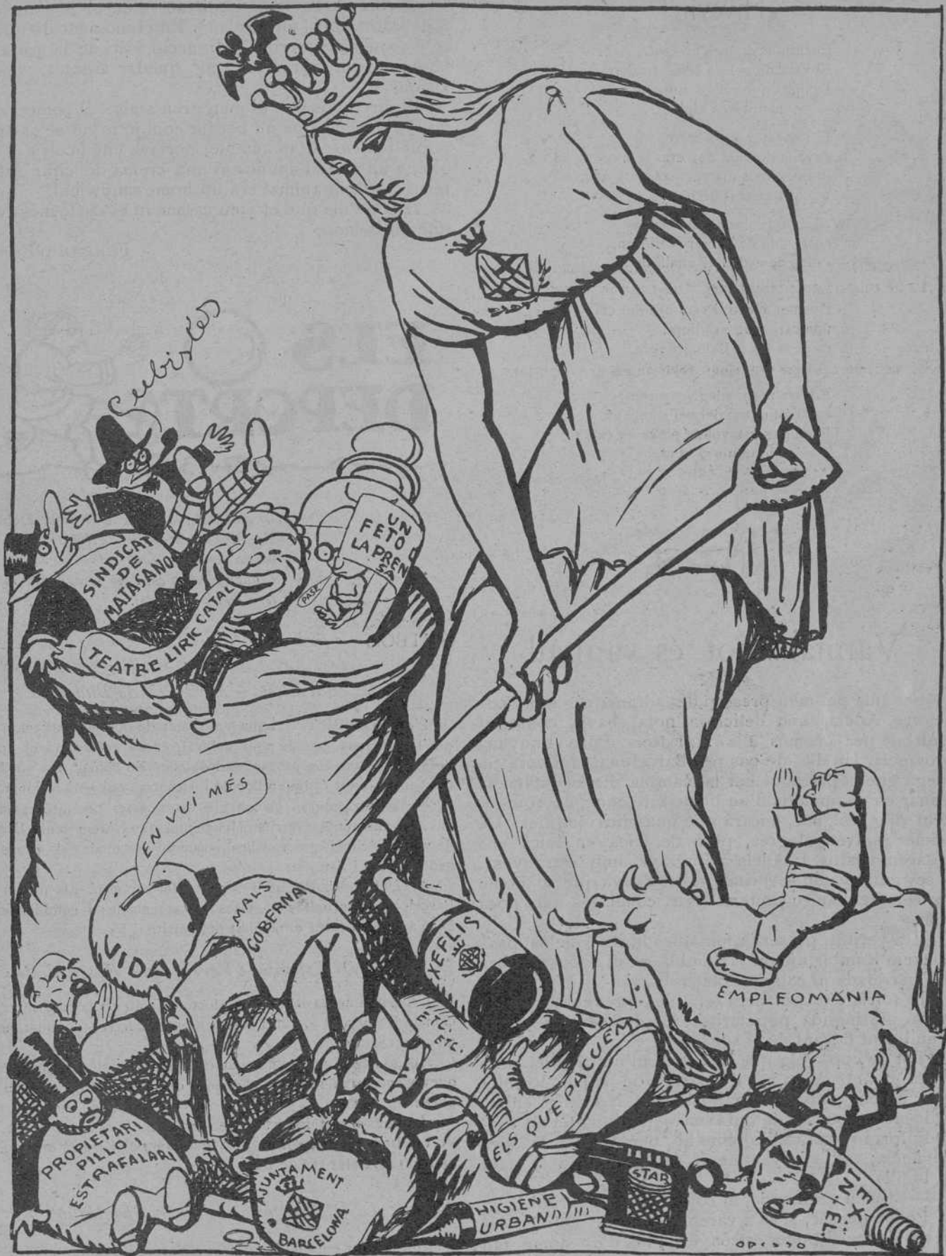
NETEJA DE FI D'ANY