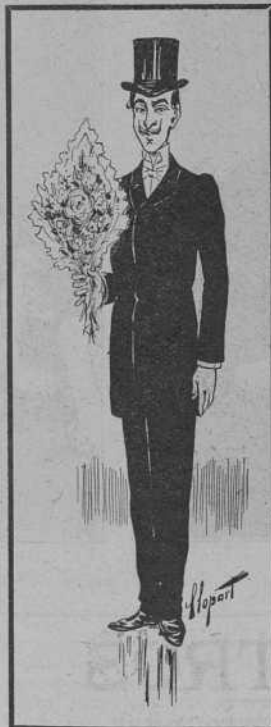
—Jo no, senyors; tot ho fa al efecte de las flors.