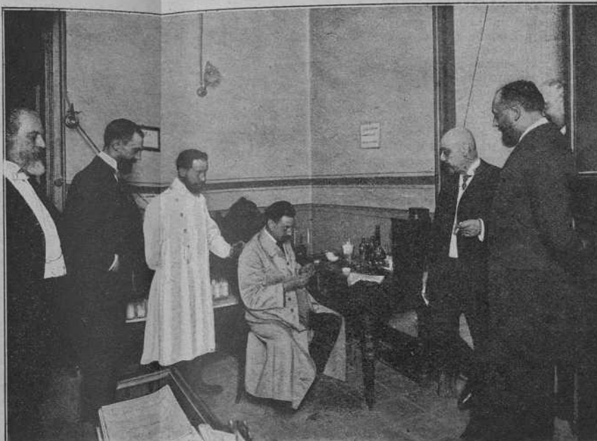
Exámen de la llet.