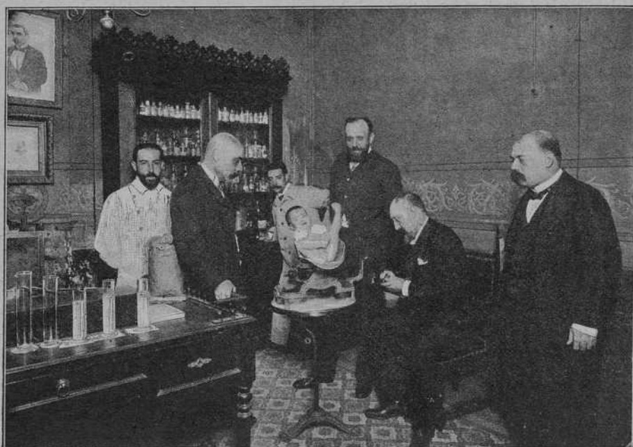
Com se pesan las criaturas, pera comprobar el seu creixement.