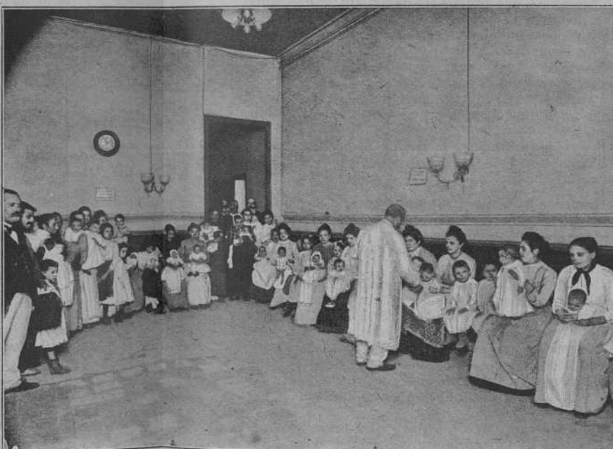
La sala d'espera á l' hora de la repartició de la llet.

Ella es casta, ella es verge y ella es pura, ella es guapa, ella es mona, ella es divina. Ella en ff, es, car lector, una xicoteta que 'm te ferit de mort; m' ha donat pota.