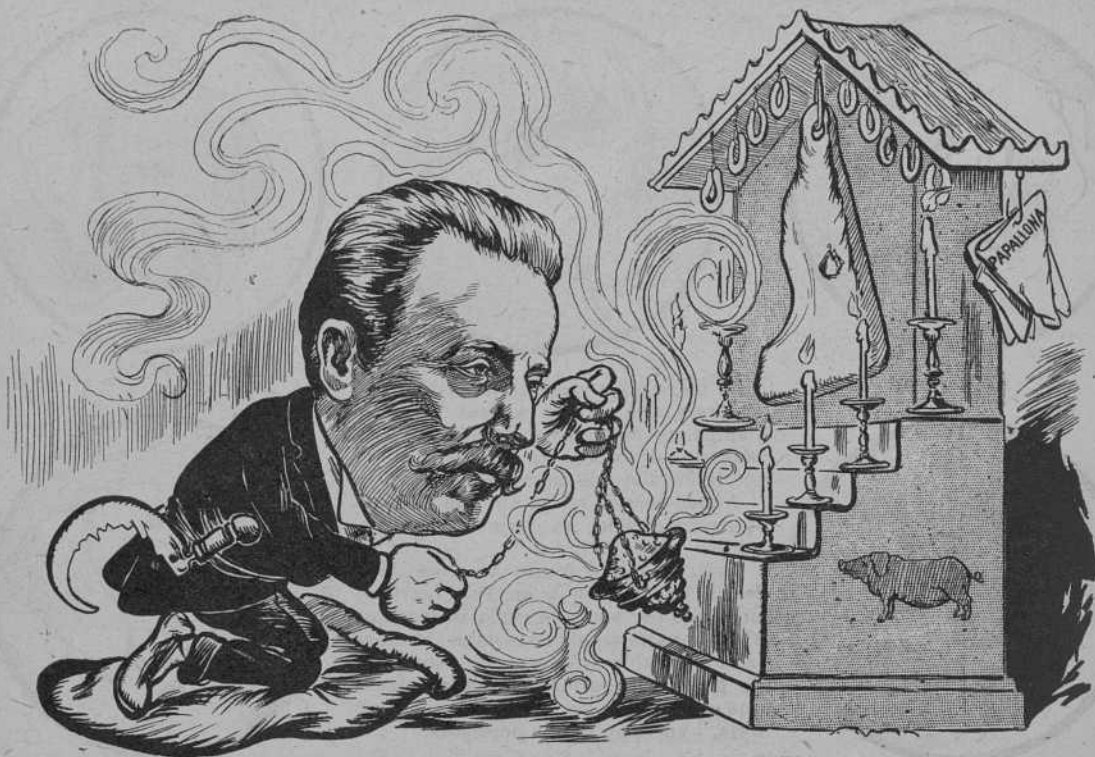
Incensant al gran Cansalada.

serietat aludeix á las teuladas de vidre, no está bé. Voilà tout.