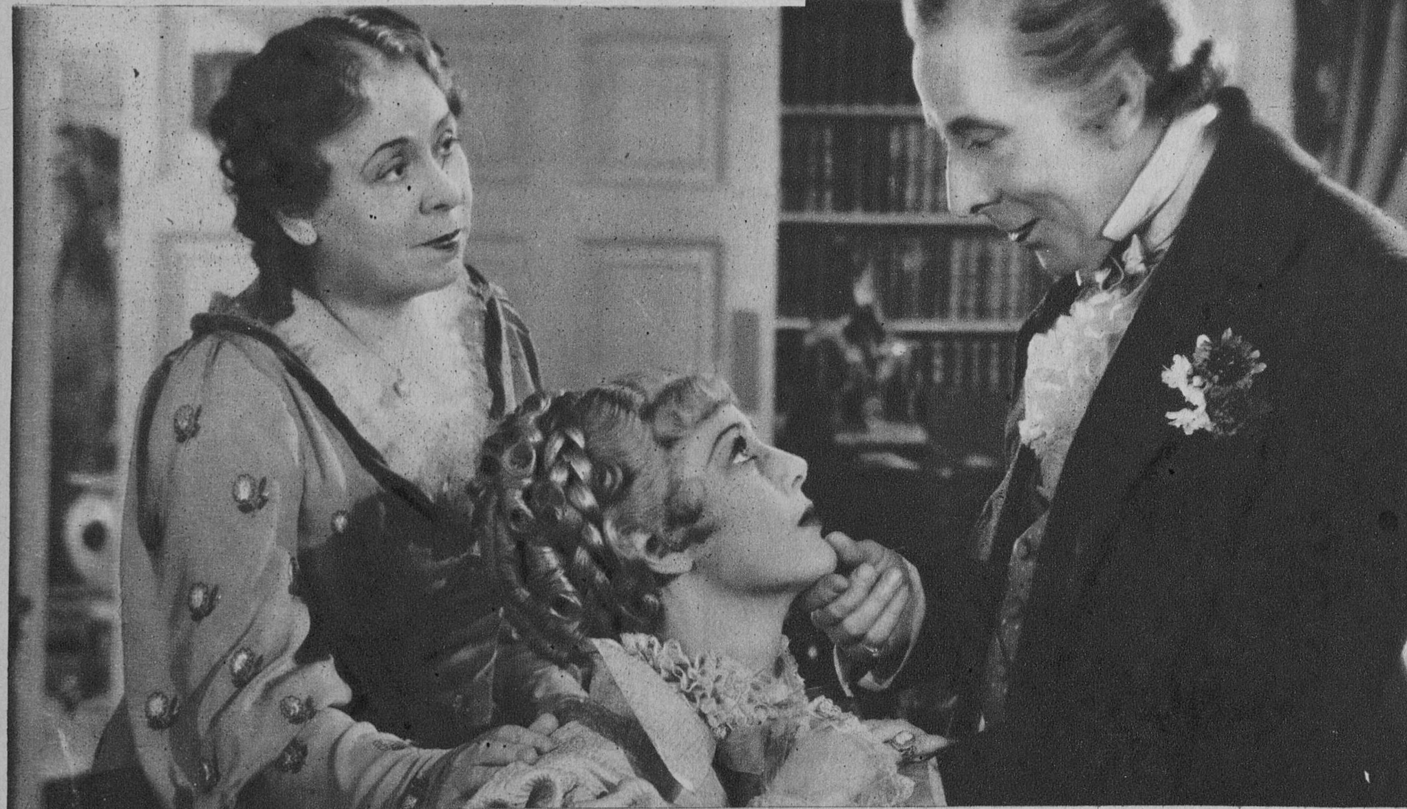
Una interesantísima escena del gran film «The house of Rothschild», de los Artistas Asociados, en el que toman parte Boris Karloff, Loretta Young y Robert Young.