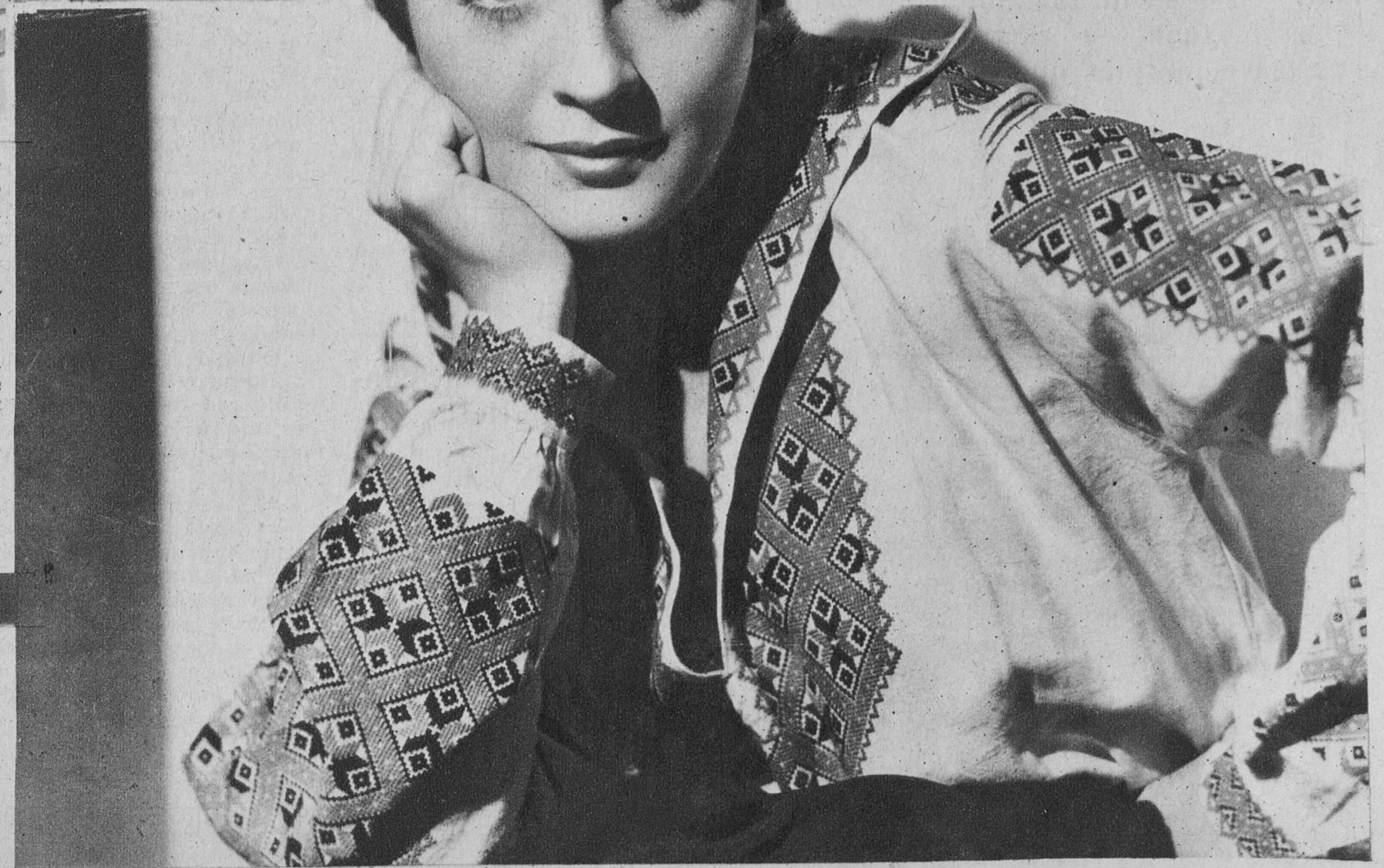
Anna Sten, la gran actriz europea, actualmente en los Estudios americanos →