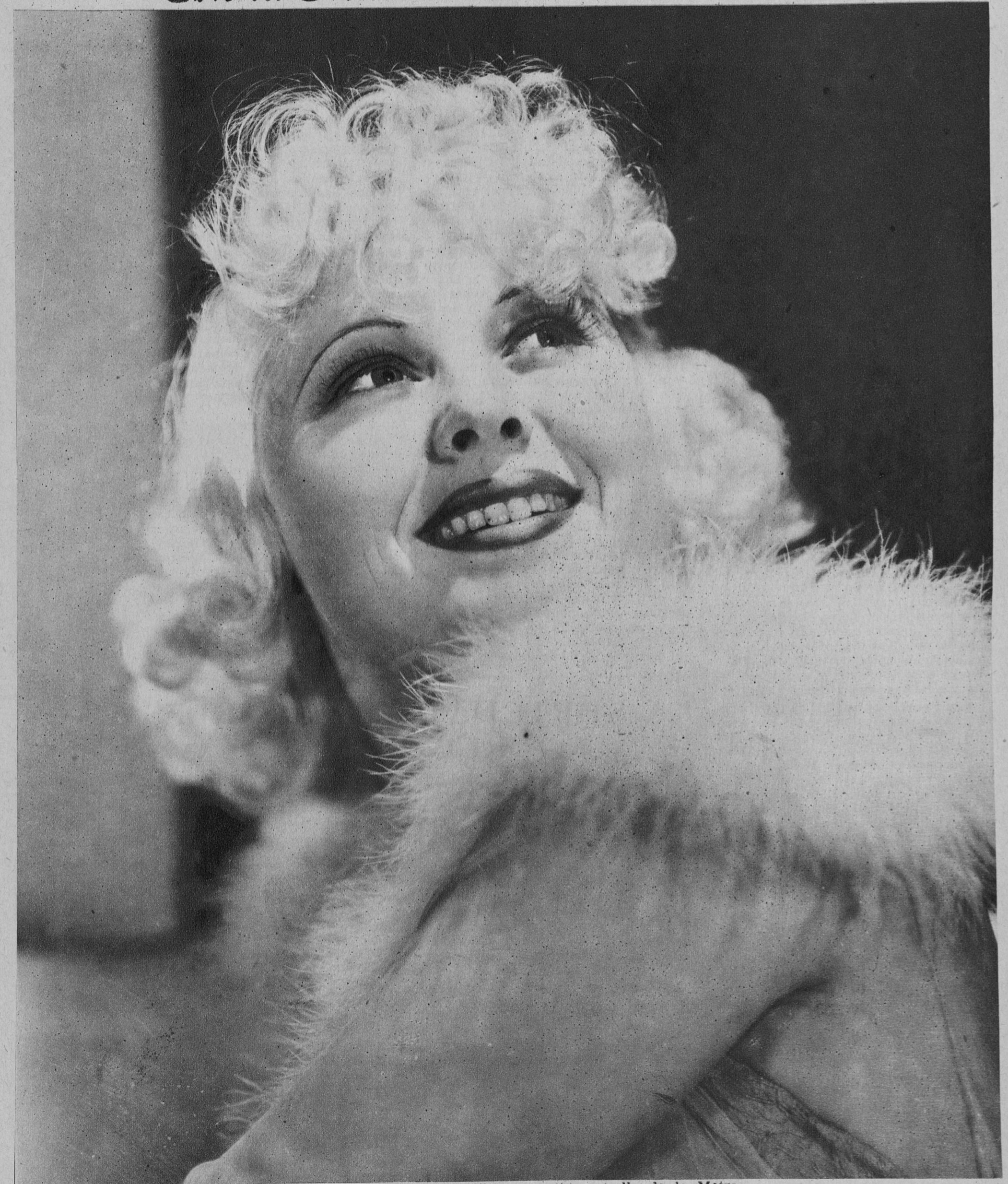
Mary Carlisle, la gentil y sugestiva estrella de la Metro-