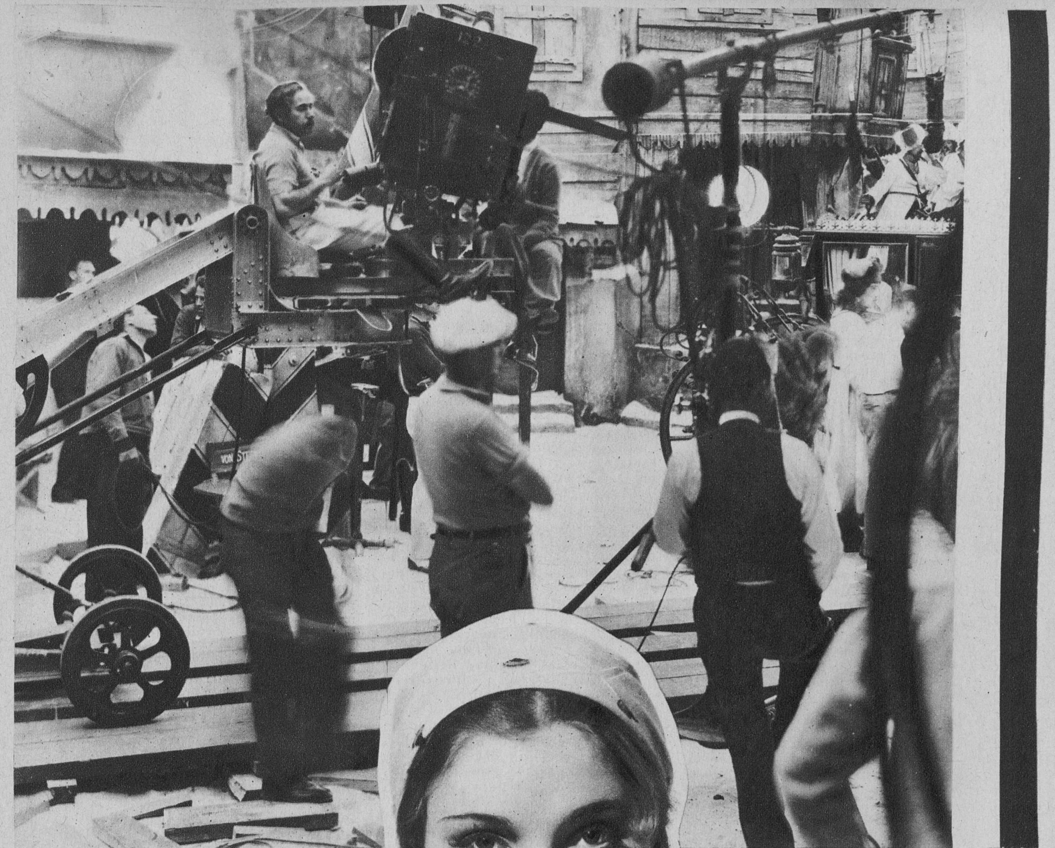
Durante la filmación de «Capricho imperial», cinta de la Paramount en la que Marlene Dietrich interpreta el papel de Catalina de Rusia, el famoso director Von Sternberg quiere cerciorarse de que el enfoque de la cámara es precisamente el que conviene a la toma de la escena