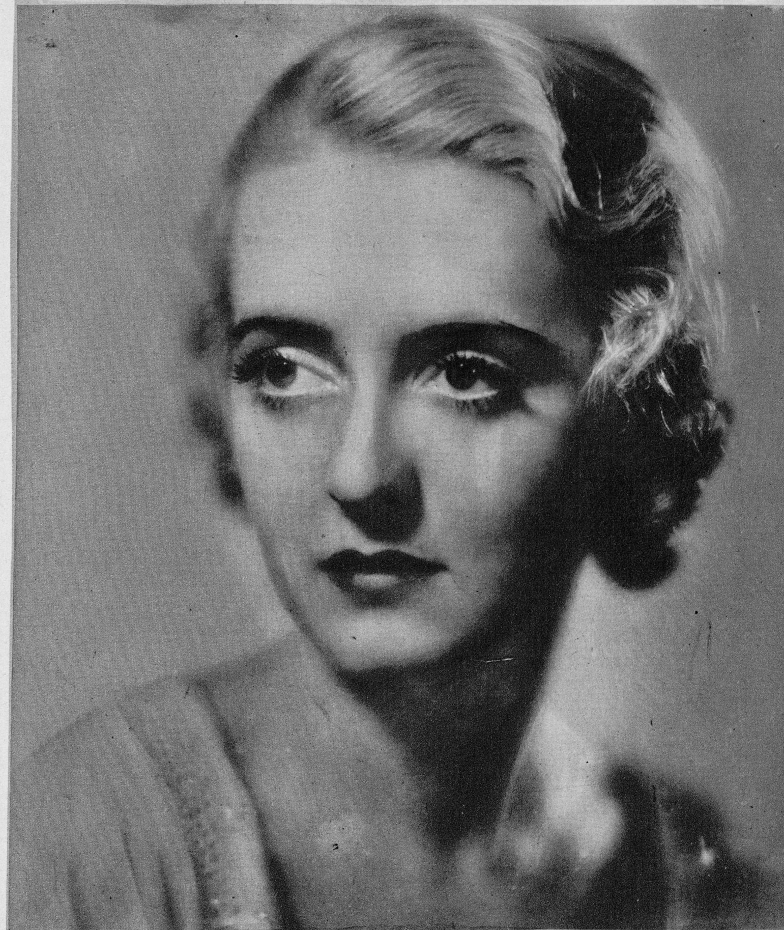
Bette Davis. destacada figdra de la Columbia, a quien muy pronto veremos en varias cintas de esta casa productora