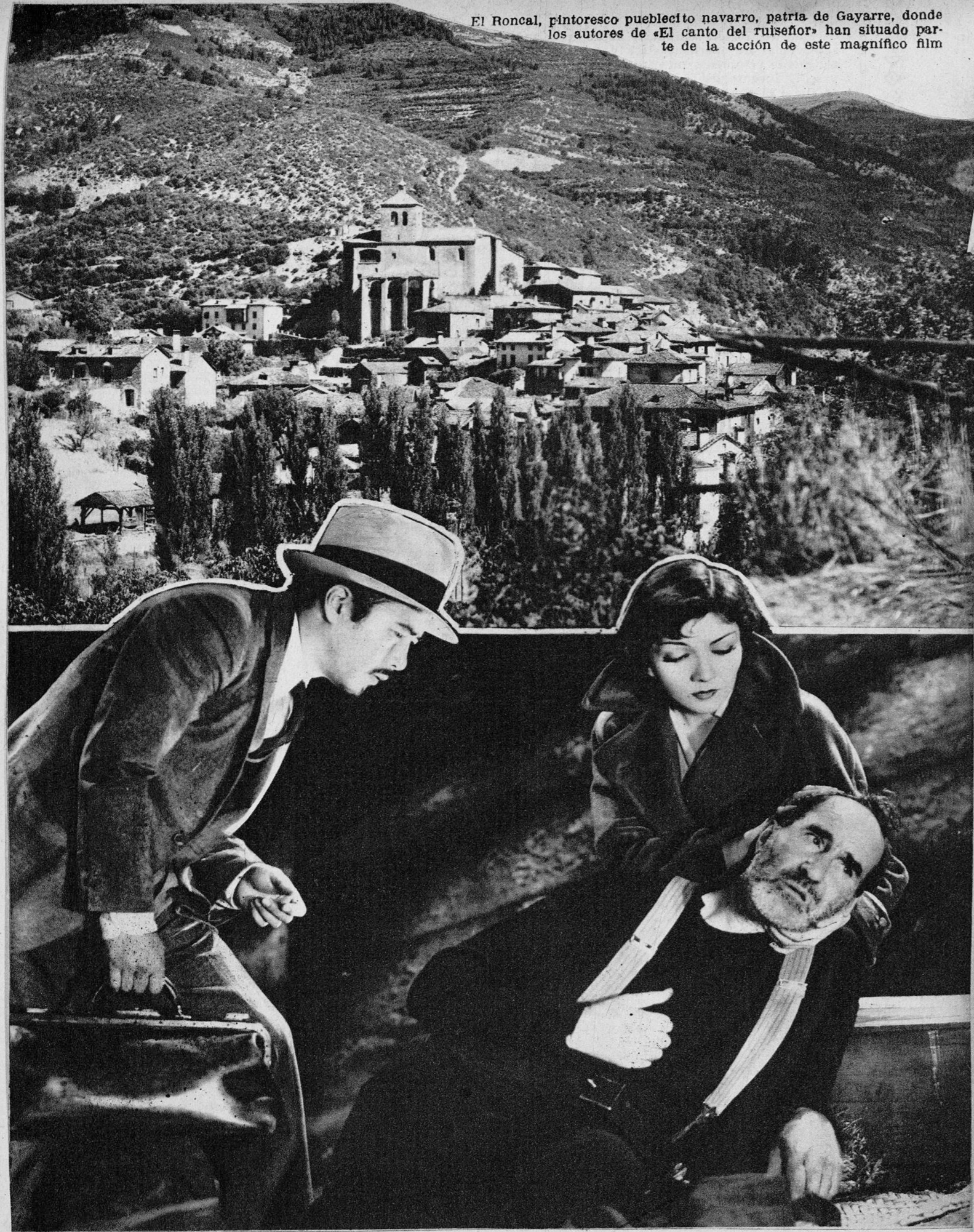
Ernest Torrence, muriendo en los brazos de Claudette Colbert, en una escena de la cinta «A la sombra de los muelles», la última en que tomó parte este gran artista