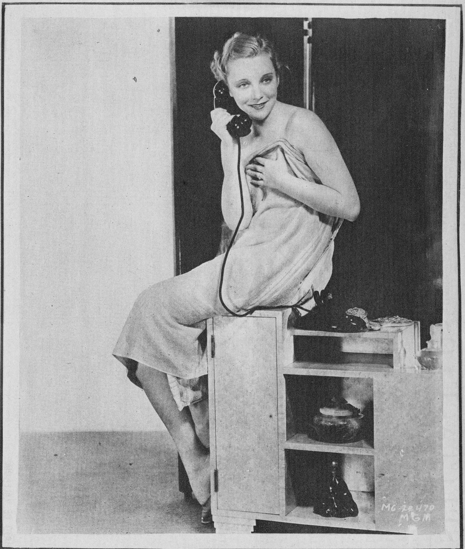
La deliciosa rubia Virginia Bruce, de la M. G. M., ha sido sorprendida en el baño por la llamada telefónica inopinada de uno de sus admiradores. La falta de oportunidad no es obstáculo para que la bella actriz atienda amablemente

De no encontrarlo en su localidad le será remitido contra reembolso pidiéndolo a LABORATORIOS PUIG - Valencia, 293 - Barcelona