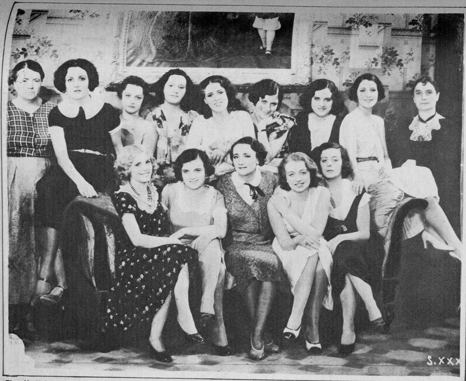
Elsa Merlini, con el bello y abundante regimiento de sus colaboradoras, en una escena de la más reciente de sus producciones