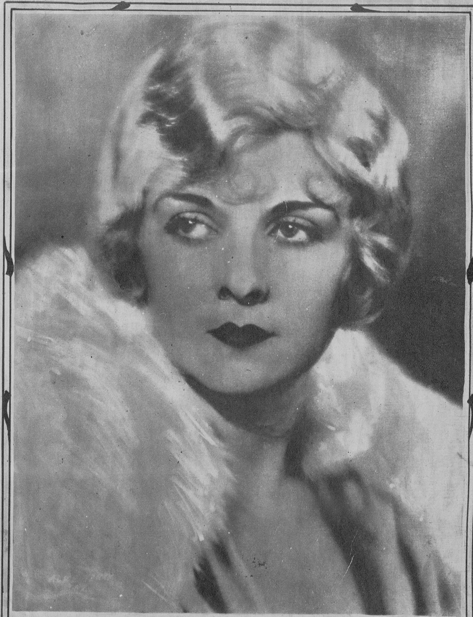
La estrella Alice Terry, que ha ingresado, junto con su esposo, en «Los Artistas Asociados»