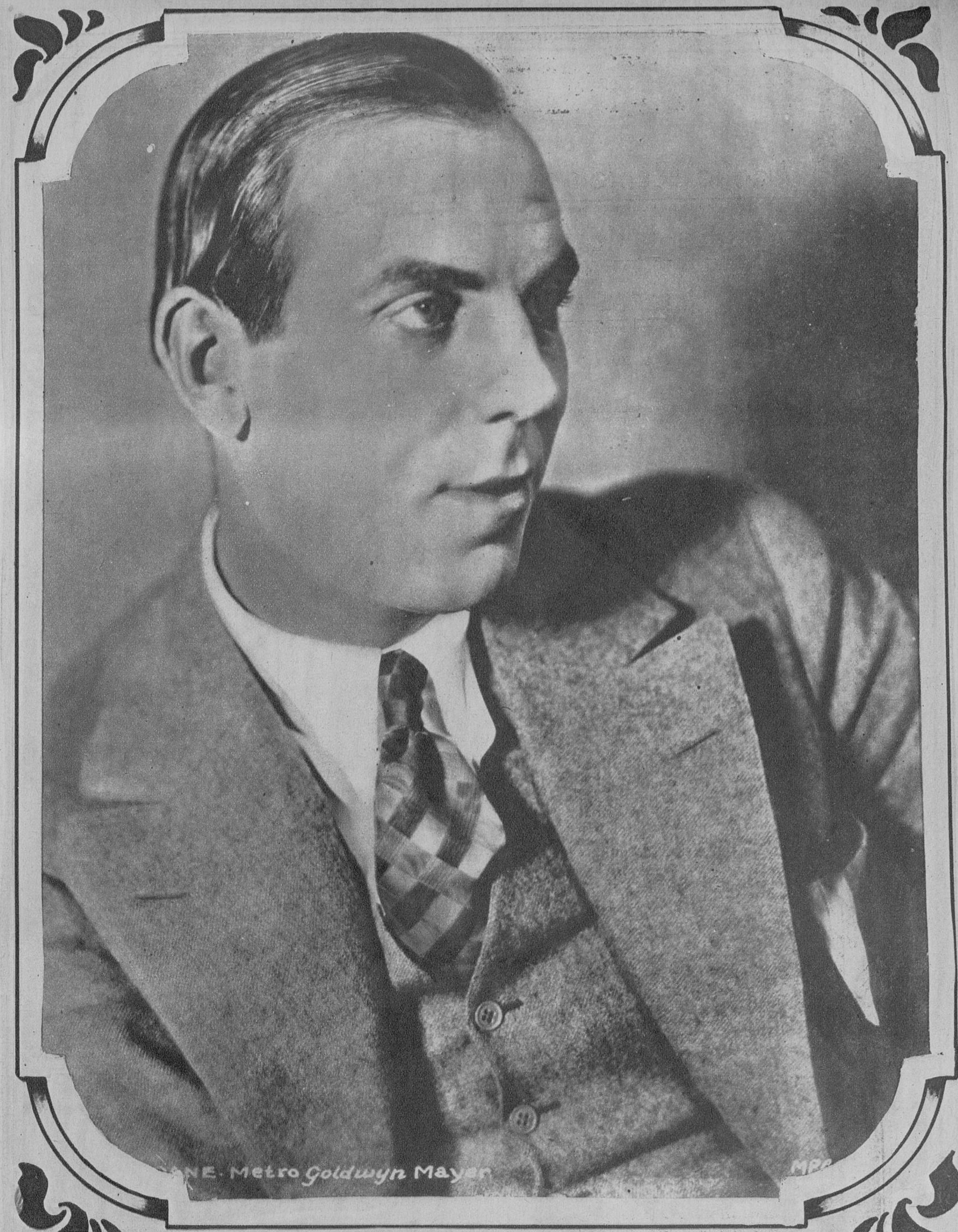
Rex Ingram, que figura en la lista de los directores de «Los Artistas Asociados»