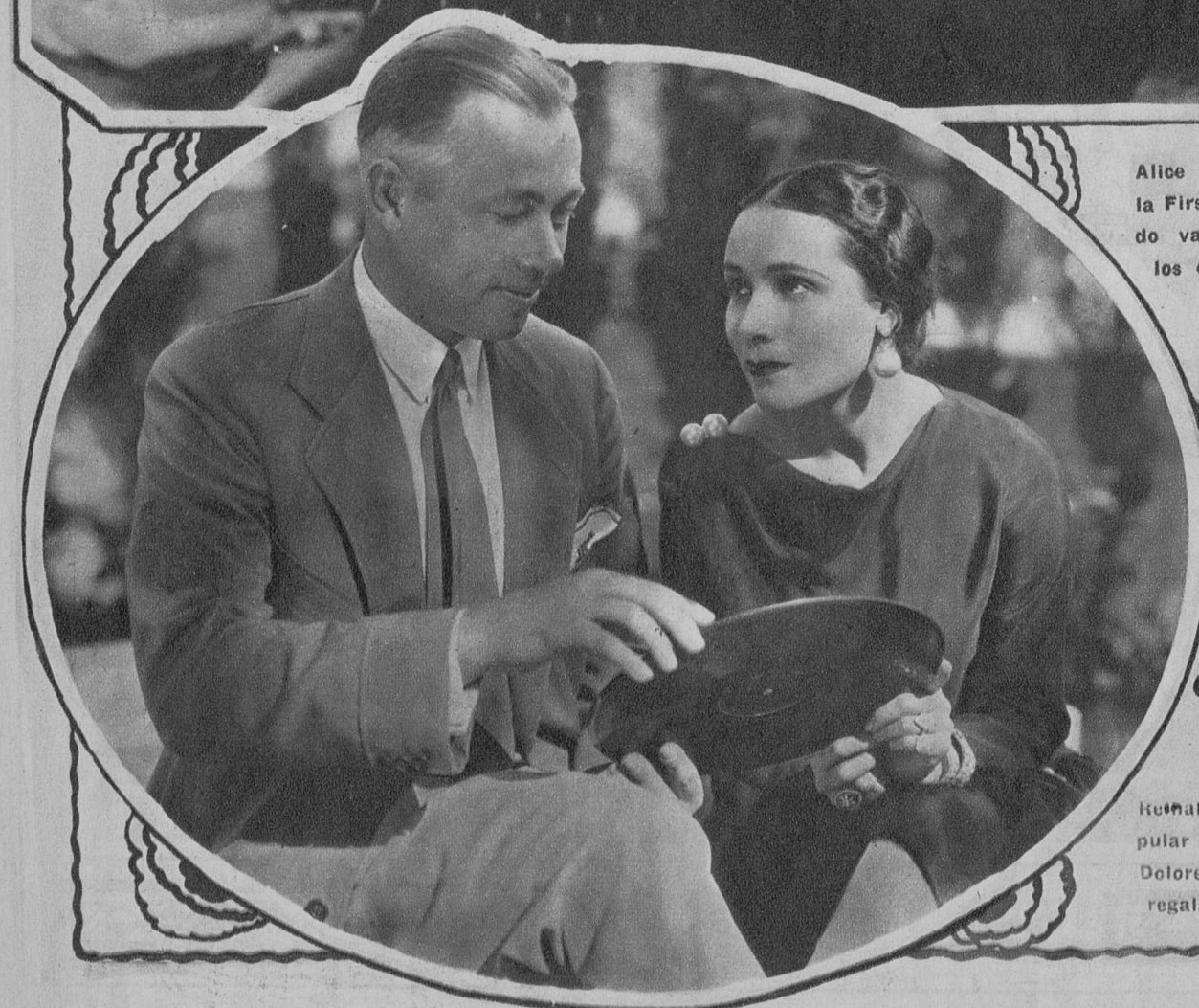
Alice White, estrella de la First, que está filmando varias películas en los estudios de California