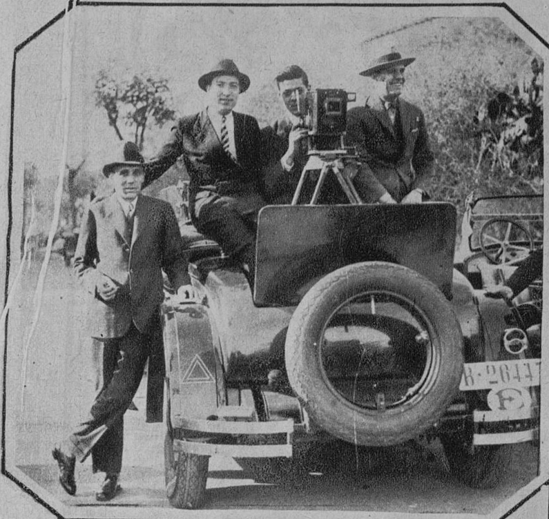
La manufactura editorial Trilla, S. A., que impresionó la ca- rrera ciclista.