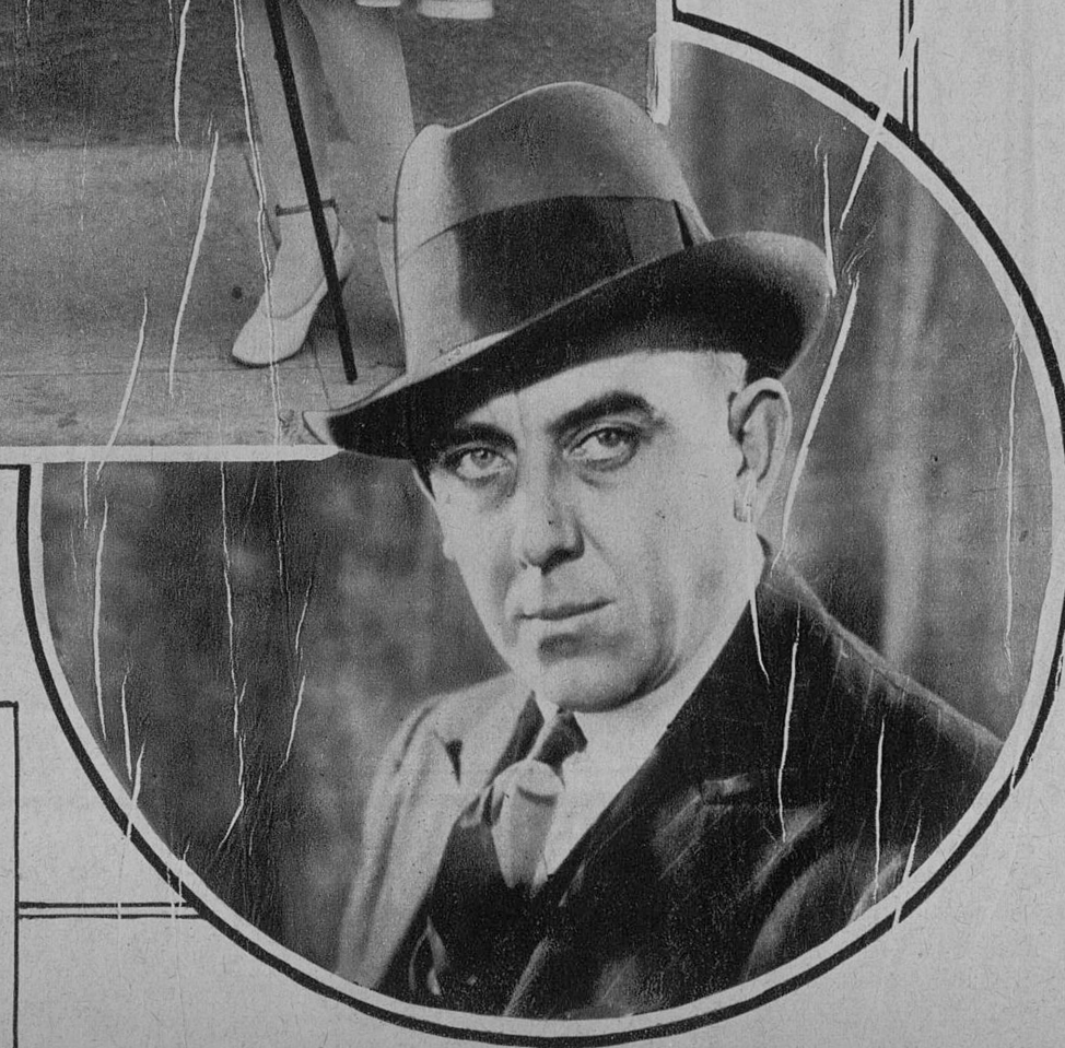
GRAHAM OUTTS CELEBRE PRODUCTOR INGLÉS, CONTRATADO PARA LA FIRST NATIONAL BRITANICA, EN LA PRODUCCION «CONFETTI», PRIMERA CINTA DE AQUELLA PRODUCCION.