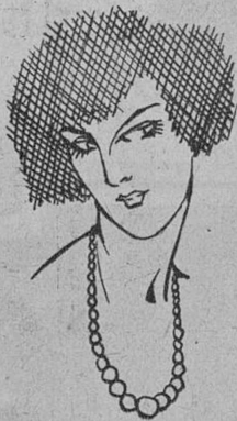
DOROTHY MACKAIL TAL COMO APARECE EN «LOCA POR LOS HOMBRES», EN COLABORACION CON JACK MULHALL. PROXIMA PELICULA DE LA FIRST NATIONAL.