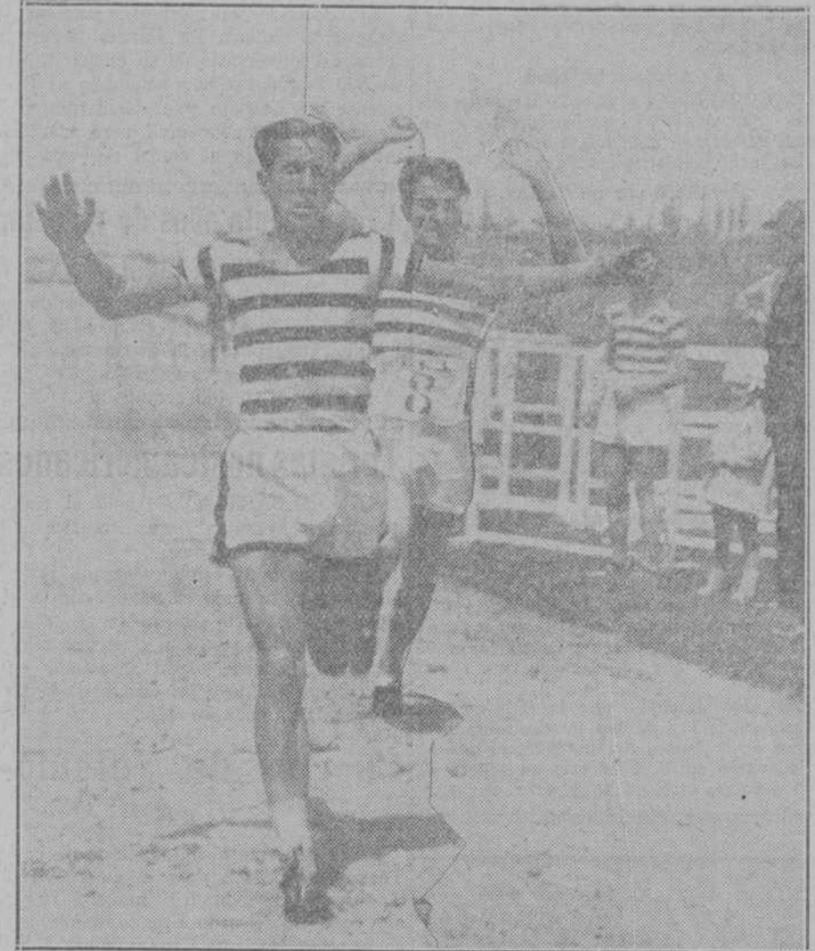
EN EL STADIUM.—Llegada a la meta del ganador en la prueba del campeonato de Castilla de 400 metros (vallás).