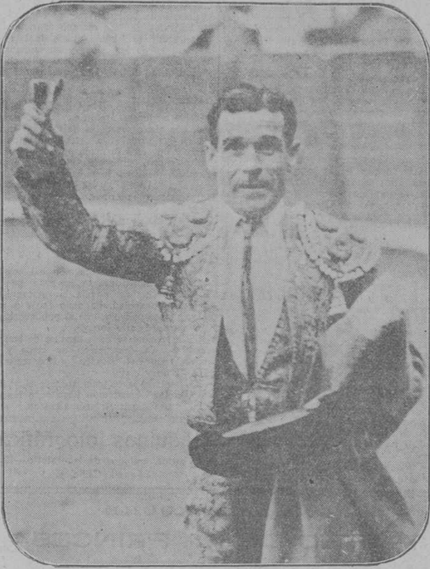
Uno de los últimos retratos de Gitanillo.