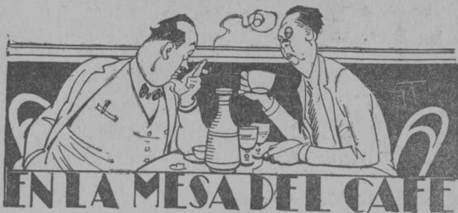
EN LA MESA DEL CAFE