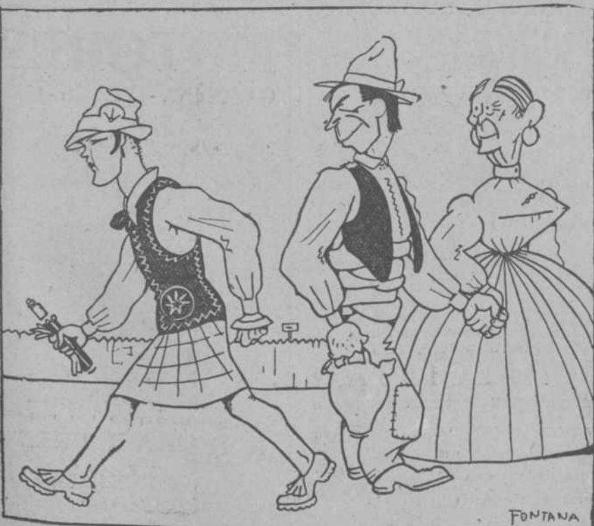
EL ISIDRO.—¡Mira, mira! Me "dicias" tú que trajese chaqueta, y aquí van "toas" las "alegantes" en mangas de carmisa.