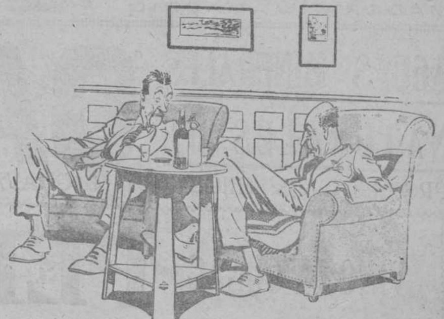
—Chico mi casa es un infierno. Mi mujer no sabe hablarme mas que de su primer marido.