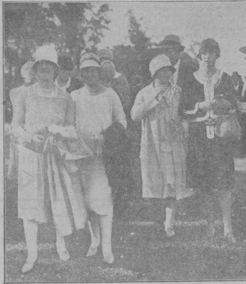
Un viaje pintoresco en el encuentro de un momento. En la foto: el Sr. y la Sra. y los hijos en el campo de fútbol.

Invitamos al redactor del anterior sueldo a realizar una excursión por España antes de describir nuevamente la vida española, o a sostener una conversación con alguno de nuestros compatriotas. O por lo menos "hojear" nuestras revistas.