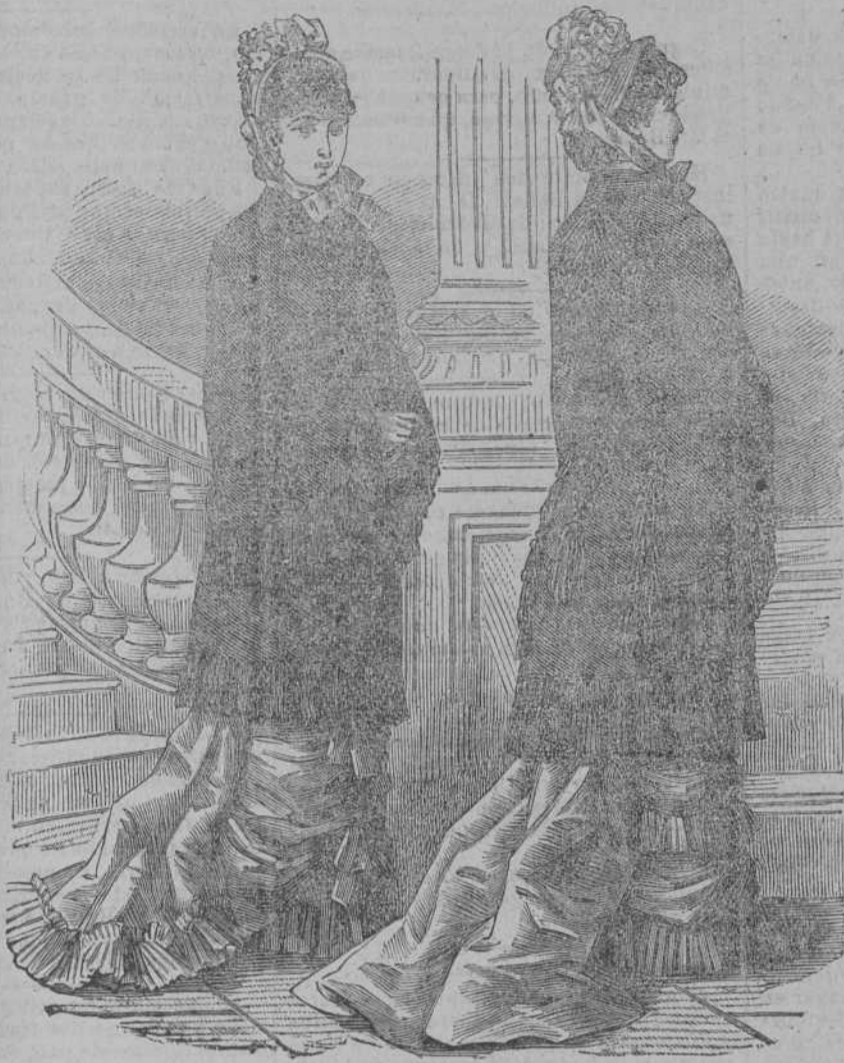
ABRIGOS VISITA De paño negro inglés. 60 pesetas

Así se titulan unos almacenes magníficos, los mayores que se conocen en Madrid dedicados á la venta de géneros necesarios á las familias, y en particular de altas novedades para vestir. Situada en el centro de la capital y en barrios aristocráticos como la calle de la Montera y la de la Puebla ocupan una gran extensión de terreno y unas fachadas parecidas á dos castillos; admirando sus escaparates sesobresvan los grandes surtidos bien ordenados siempre de última moda, imponiendo á Madrid las fantasías de buen tono que atraen á los compradores que buscan la economía en los precios y la bondad en los géneros; por eso son y serán los comercios más frecuentados de la corte. Además, el propietario de La Isla de Cuba, señor García, agradecido á las señoras, ha establecido un modo de vender á precio fijo de rigor, único procedimiento serio y que no da lugar á engaños para nadie. No es nuestro propósito hacer aquí un inventario que sería interminable por las grandes existencias y variedad de artículos, pero consta que cuanto se vende en La Isla de Cuba lleva el sello de la elegancia y de la novedad, y su mérito principal, despues de estas condiciones, es que se vende de mucho más barato que en los demás comercios de Madrid.