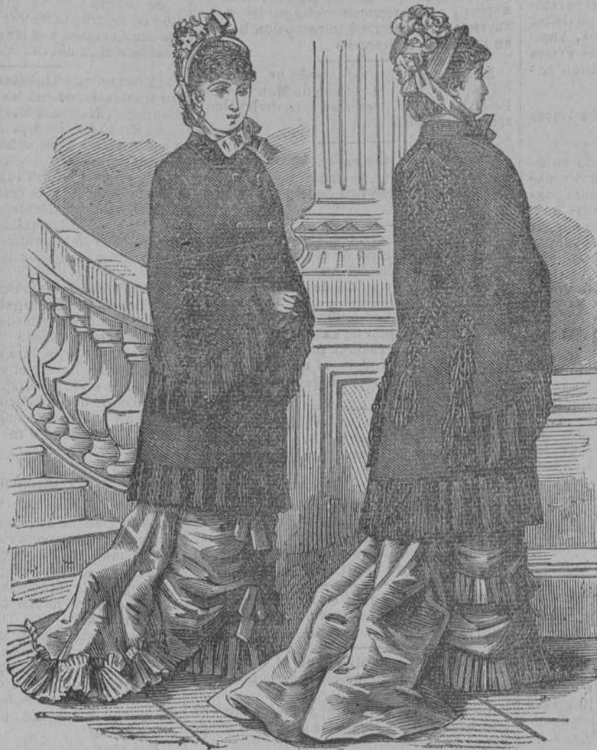
ABRIGOS VISITA De paño negro inglés. 60 pesetas

Así se titulan unos almacenes magníficos, los mayores que se conocen en Madrid dedicados á la venta de géneros necesarios á las familias, y en particular de altas novedades para vestir. Situados en el centro de la capital y en barrios aristocráticos como la calle de la Montera y la de la Puebla ocupan una gran extensión de terreno y unas fachadas paralelas á dos calles: admirando sus escaparates se observan los grandiosos surtidos bien ordenados y siempre de última moda, imponiendo á Madrid las fantasías de buen tono que atraen á los compradores que buscan la economía en los precios y la bondad en los géneros; por eso son y serán los comercios más frecuentados de la corte. Además, el propietario de La Isla de Cuba, señor García, agradecido á las señoras, ha establecido un modo de vender á precio fijo de rigor, único procedimiento serio y que no da lugar á engaños para nadie. No es nuestro propósito hacer aquí un inventario que sería interminable por las grandes existencias y variedad de artículos, pero conste que cuanto se vende en La Isla de Cuba lleva el sello de la elegancia y de la novedad, y su mérito principal, después de estas condiciones, es que se vende de mucho más barato que en los demás comercios de Madrid.