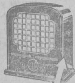
RECEPTOR Y ALTAVOZ EN UN SOLO MUEBLE. Telefunken 33 para corriente continua, y corriente alterna.

EL NUEVO SUPERSELECTOR ELIMINA COMPLETAMENTE LA EMISORA LOCAL