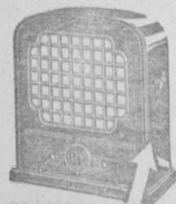
RECEPTOR Y ALTAVOZ EN UN SOLO MUEBLE Telefunken 33 para corriente continua, y corriente alterna.

de tres válvulas, son los mejores receptores en su clase construidos hasta el presente, con una selectividad excepcional.