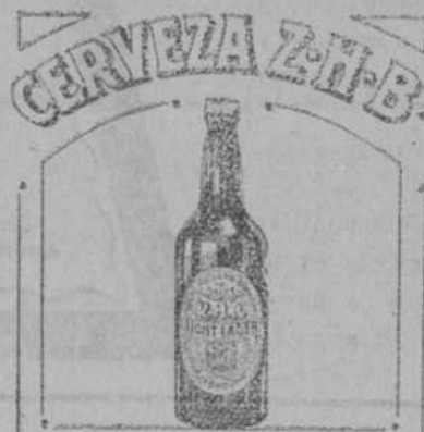
AGENTES PARA MARRUECOS CORIAT & CIA EN TANGER

Los señores Coriat y Compañía, agentes de la cerveza Z. H. B., tienen el honor de informar a su fiel clientela, que a pesar de la tan buena acogida que dió el público al concurso de cápsulas Z. H. B., efectuado en Diciembre del año pasado, este año se propone hacer un mayor regalo, que consiste en