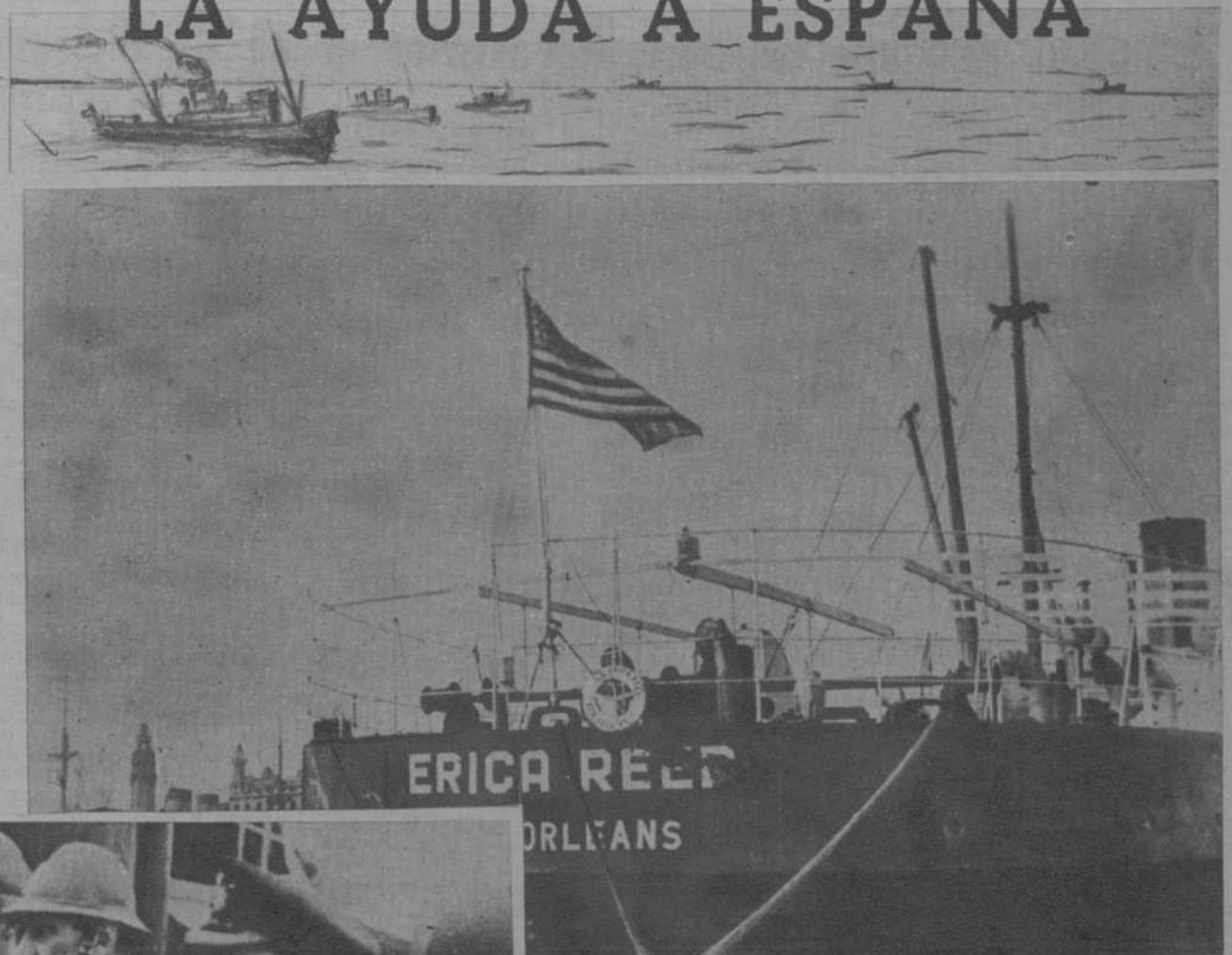
El buque norteamericano "Erica Reed" que ha desembarcado en Barcelona un cargamento de víveres, medicamentos y ropas, valorado en trescientos mil dólares