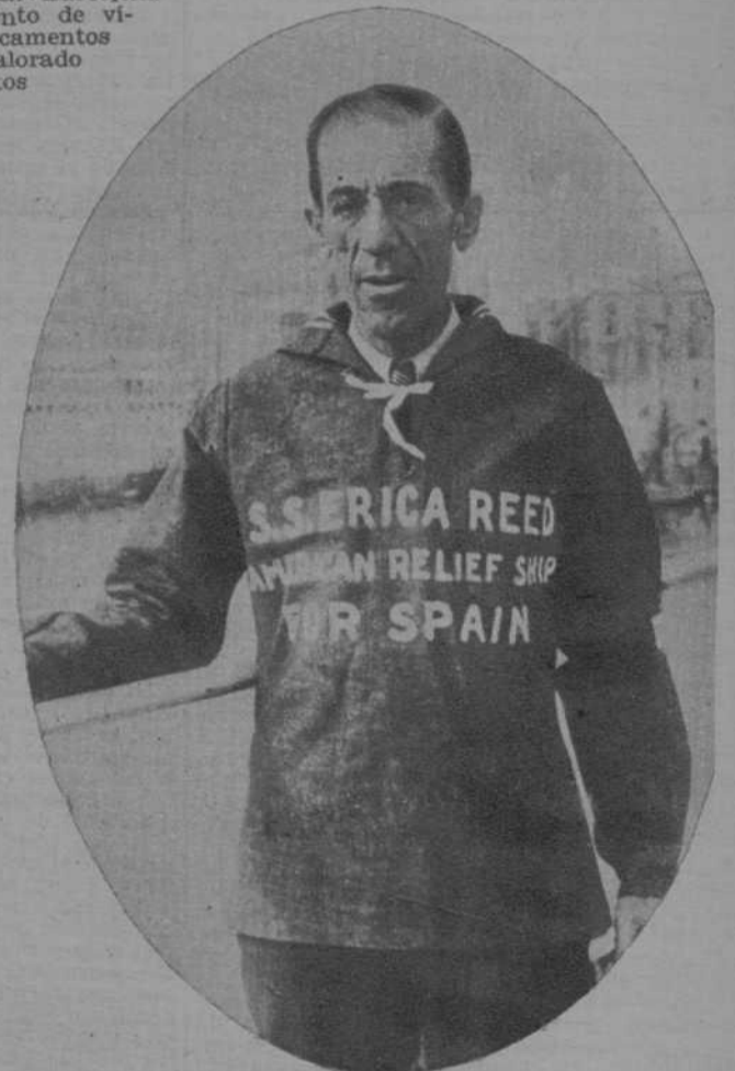
Uno de los tripulantes