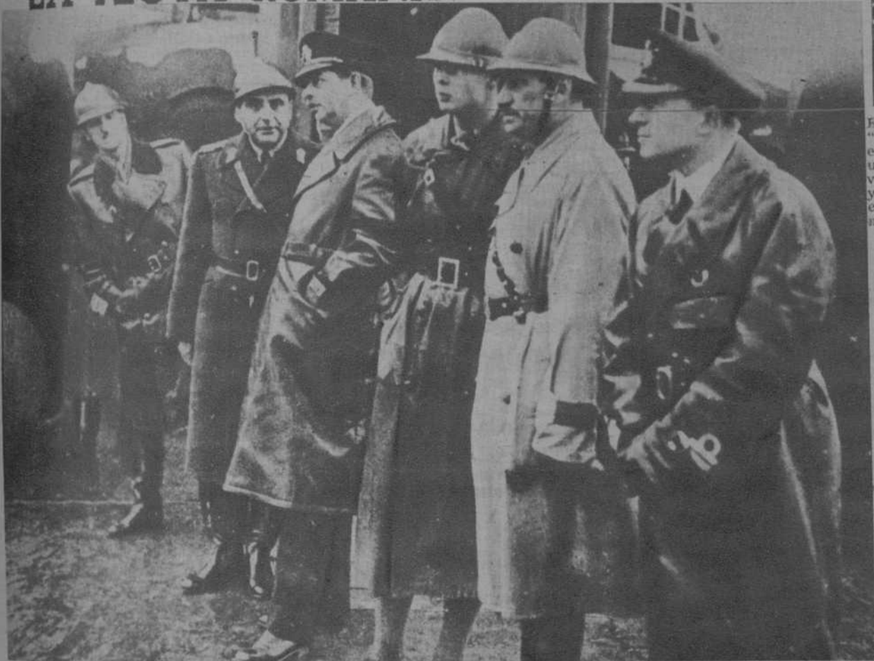
El rey Carol y el príncipe Miguel, visitándola acompañados de ministros