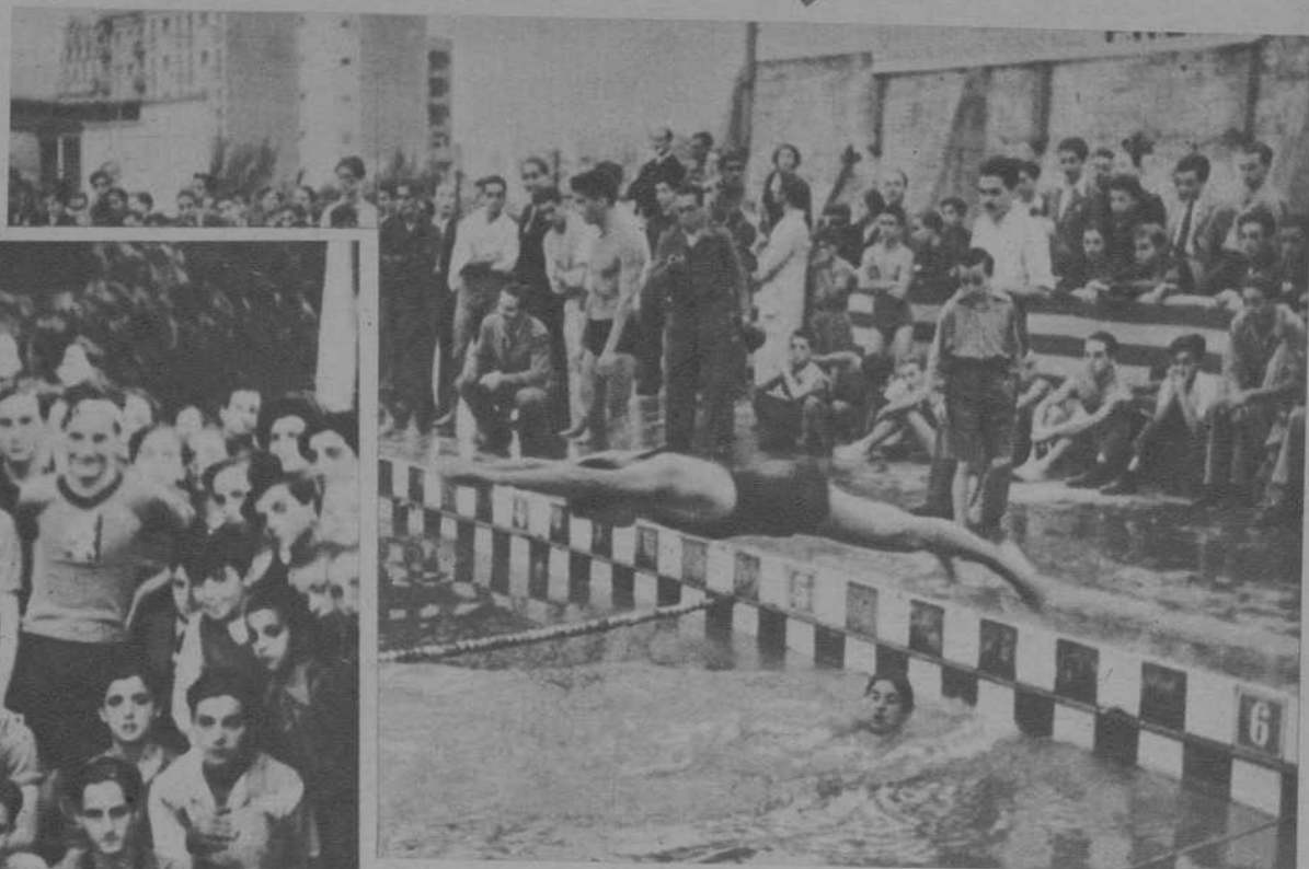
COMPETICION NATATORIA DE RELEVOS EN LA FIESTA DEPORTIVA