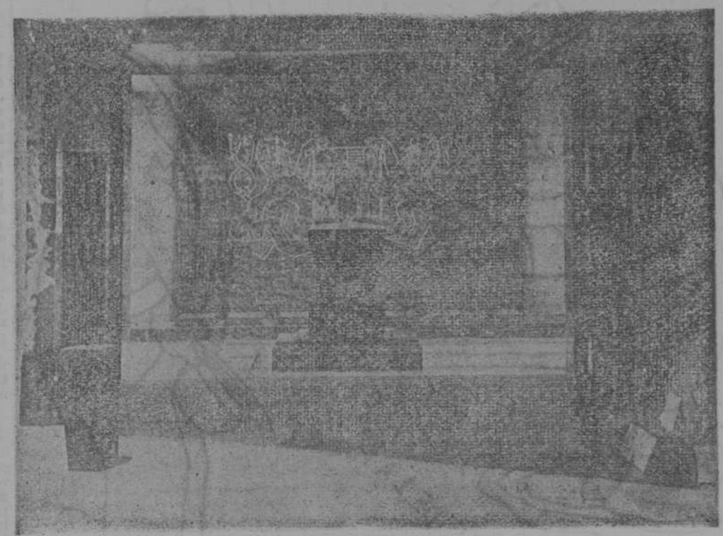
En el monte Zizka se encuentra en vías de terminarse el panteón checoslovaco en el que serán enterrados el Presidente Masaryk y otros grandes checos que hayan contribuido a la resurrección de la nación checa. Una vista del panteón. Al fondo el sarcófago de mármol que contendrá los restos de Masaryk

cos se engañan. En efecto, nada permite creer que el Gobierno británico esté dispuesto a apoyar en forma alguna tales proposiciones.