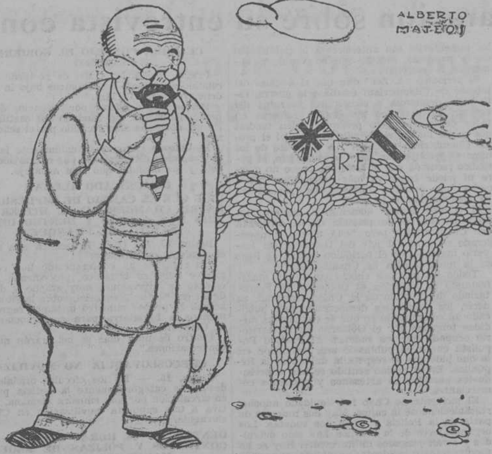
—¿Iremos juntos hasta el fin, en favor del Derecho, como en 1914?