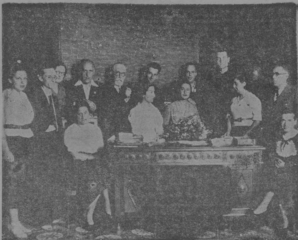
He aquí a la Comisión organizadora de la Jornada de Sacrificio, reunida en la sede de los Jóvenes Amigos de España, para realizar los últimos detalles del plan de la Jornada.

Hubo unos instantes de silencio. Estalló luego una ovación estruendosa.