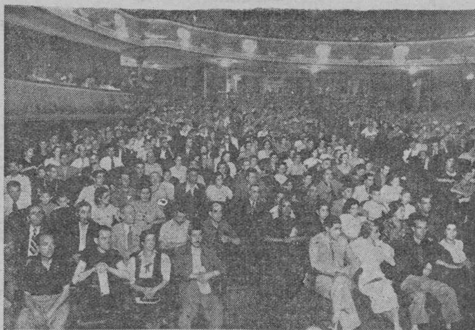
Aspecto de la sala del Tivoli en el festival organizado a beneficio de las guarderías infantiles, sostenidas por la S. I. A.