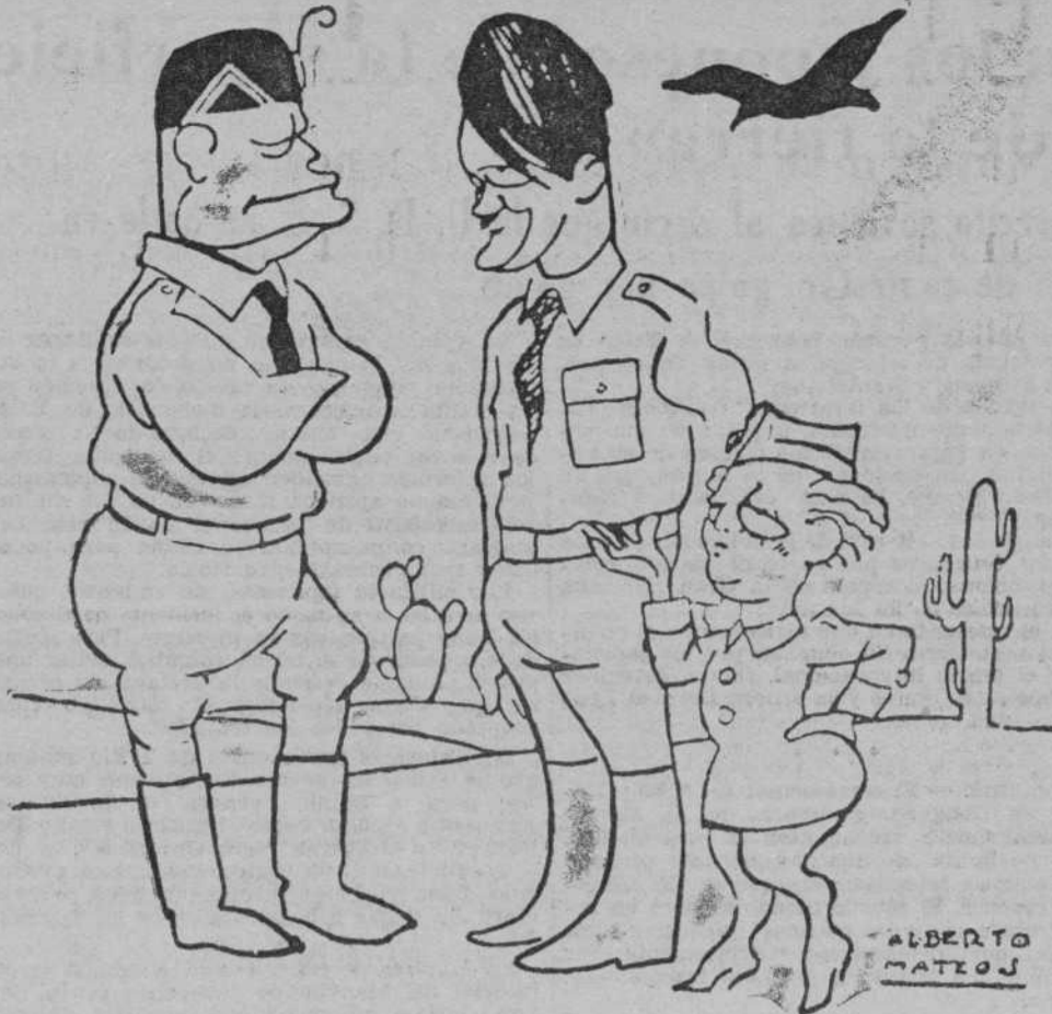
—Y nosotros que creíamos a los rojos completamente perdidos... —Sí, claro; pero "de perdidos es el río".