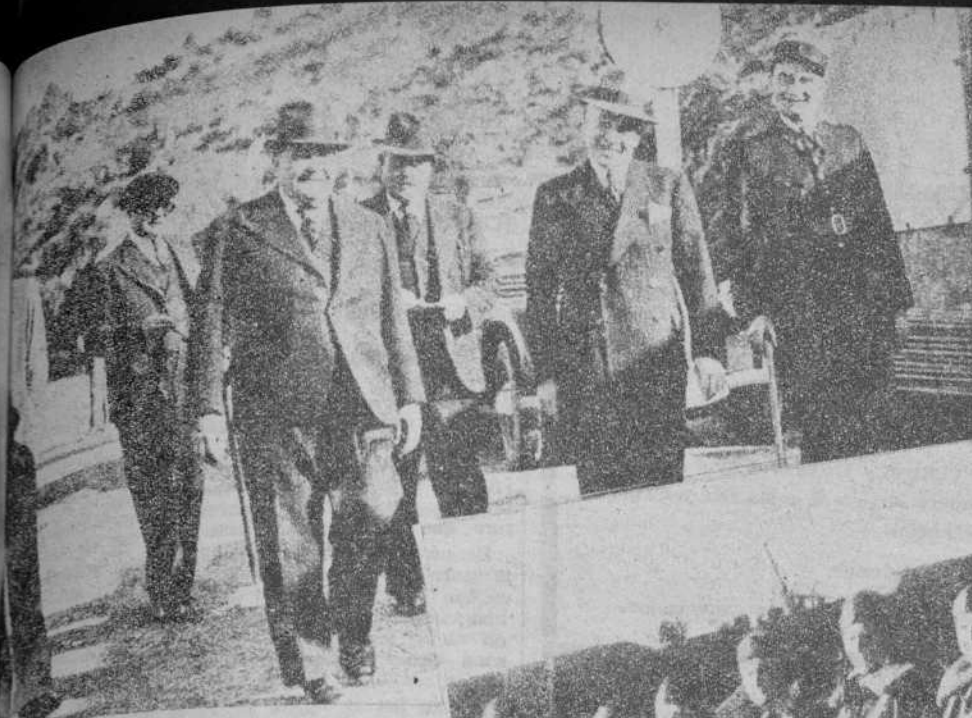
LOS BOMBARDEOS DE PORTBOU POR LOS PIRATAS DEL AIRE ITALO-ALEMANES

El prefecto de los Pirineos y el alcalde de Portbou, en su visita de inspección hasta el límite extremo de la frontera francesa para apreciar los daños causados