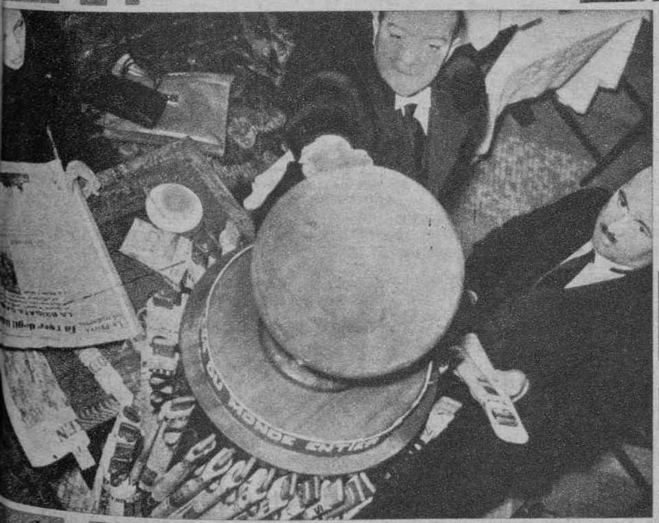
LA GEOGRAFIA EN EL CAFE París. — Un gran café del barrio de Montparnasse pone a la disposición de sus clientes un Mapa Mundi y a su alrededor gran número de periódicos extranjeros. Los parroquianos pueden consultar el Mapa Mundi y el periódico