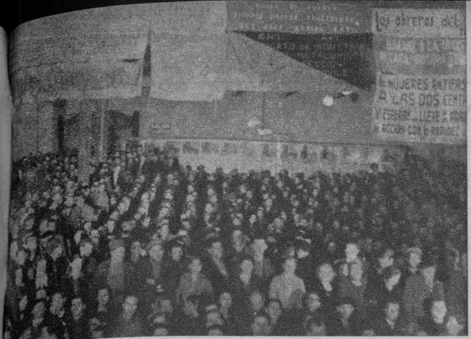
EL MITIN DE LA U. G. T.-C. N. T. EN MADRID La sala del Monumental Cinema La presidencia del acto