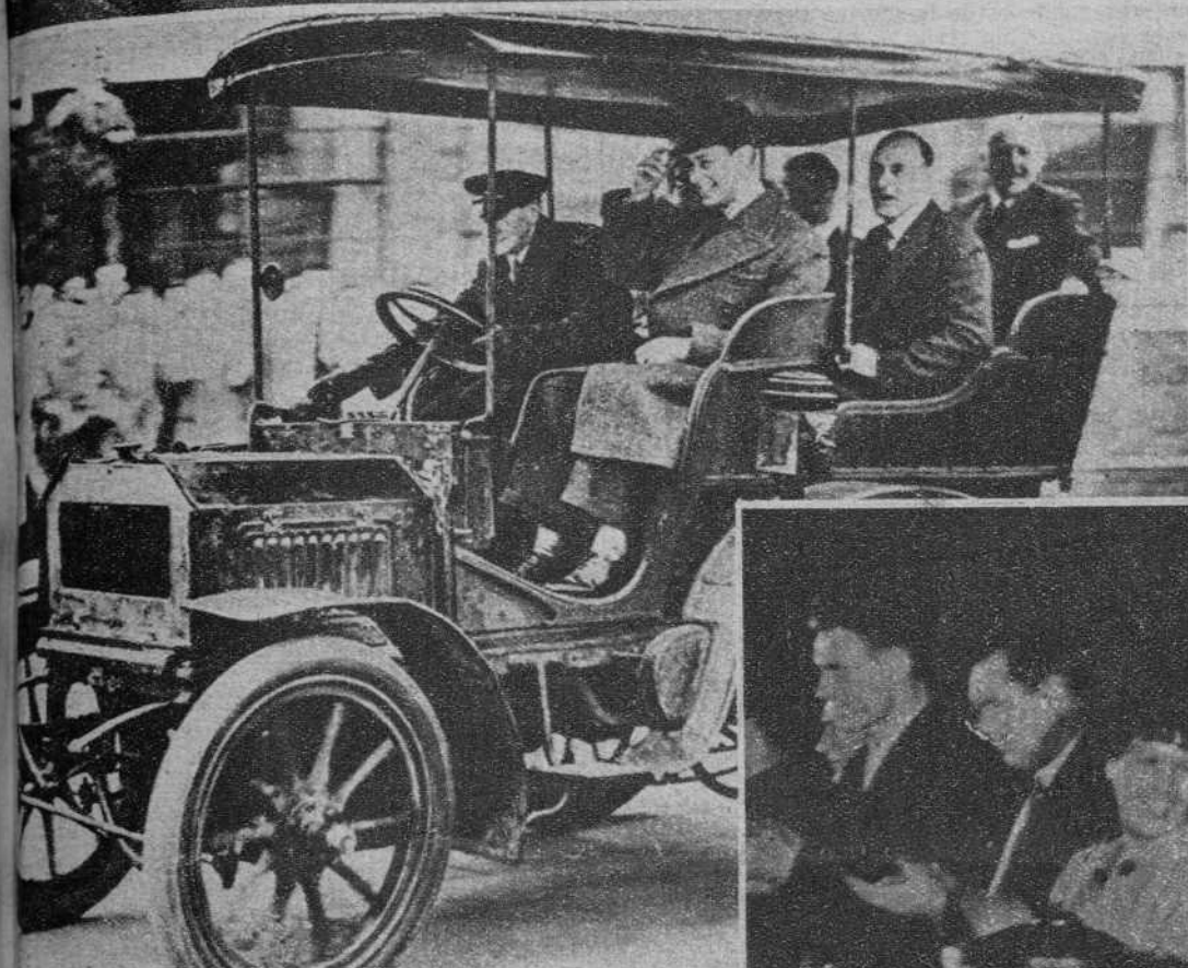
EL PRIMER AUTO QUE UTILIZO EDUARDO VII El rey de Inglaterra, Jorge VI, en el auto de su abuelo, junto con lord Swinton, ministro del Aire