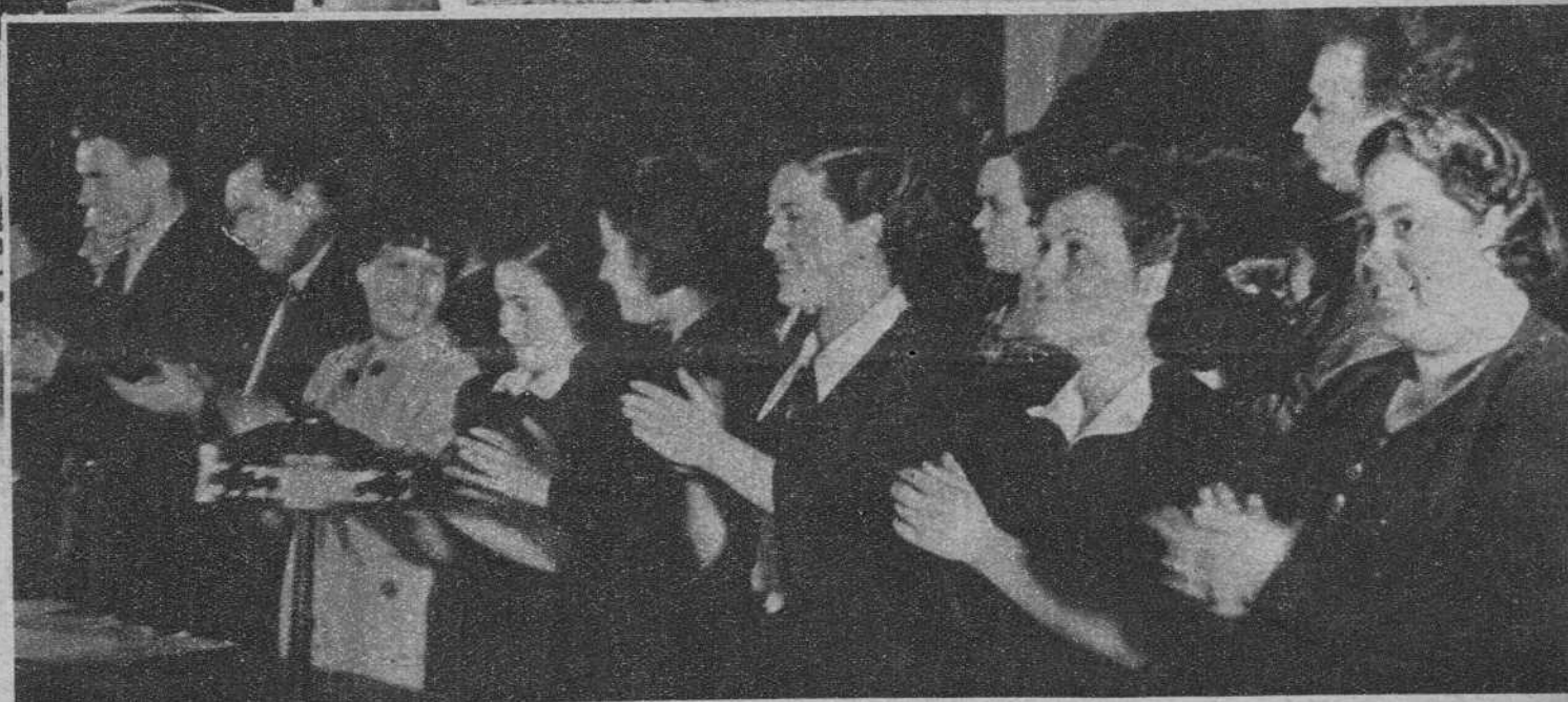
LA JORNADA INTERNACIONAL DE LAS MUJERES, EN MOSCU En el Palacio de la Cultura, de la fábrica Stalin. — El grupo de mujeres españolas que asistieron al acto