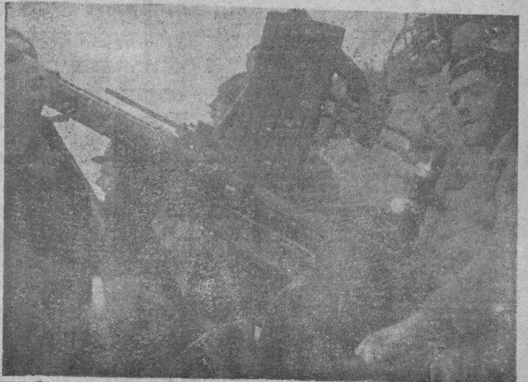
Un cañón antiaéreo, disparando contra piratas del aire