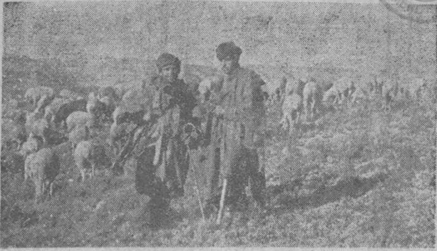
Soldados de la República, guardando el ganado cogido al enemigo