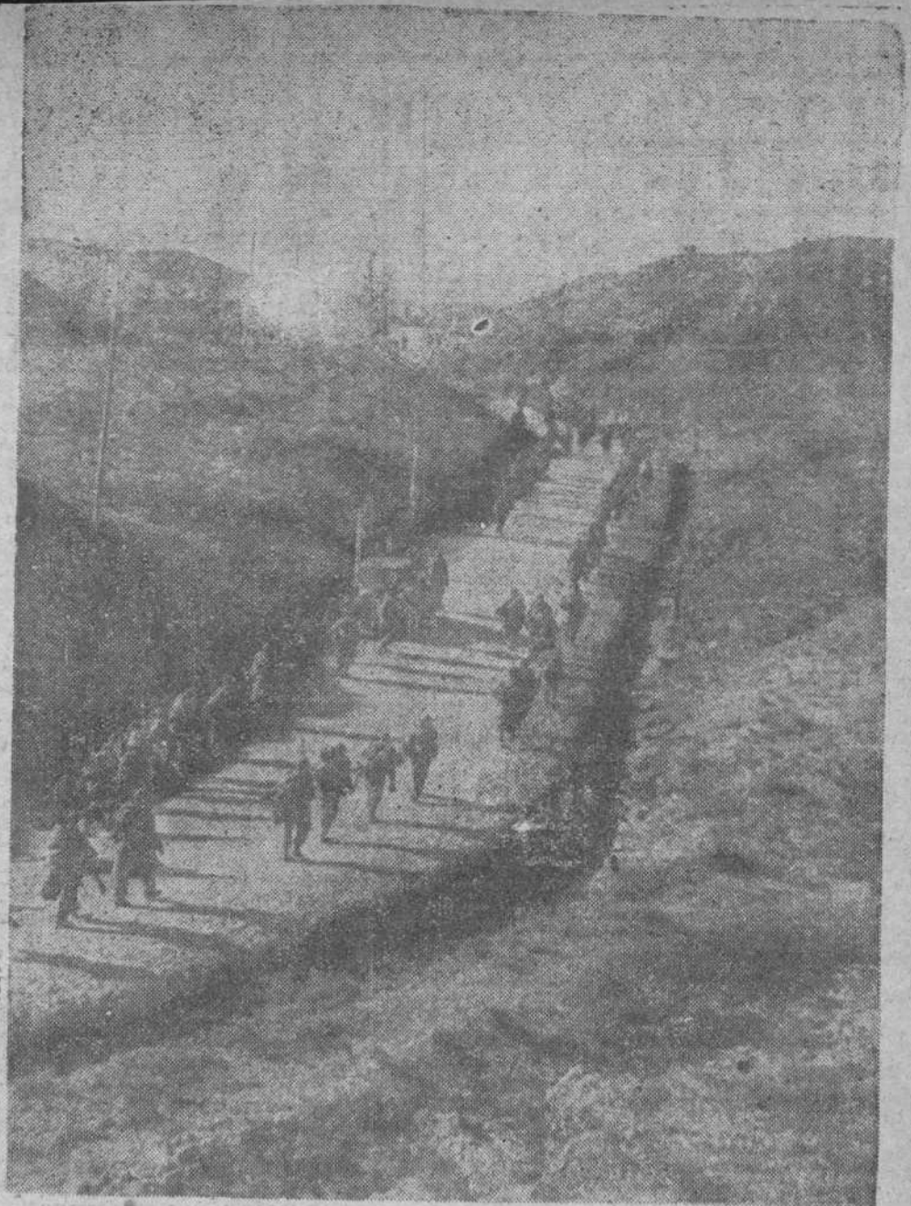
Una columna del Ejército de la República