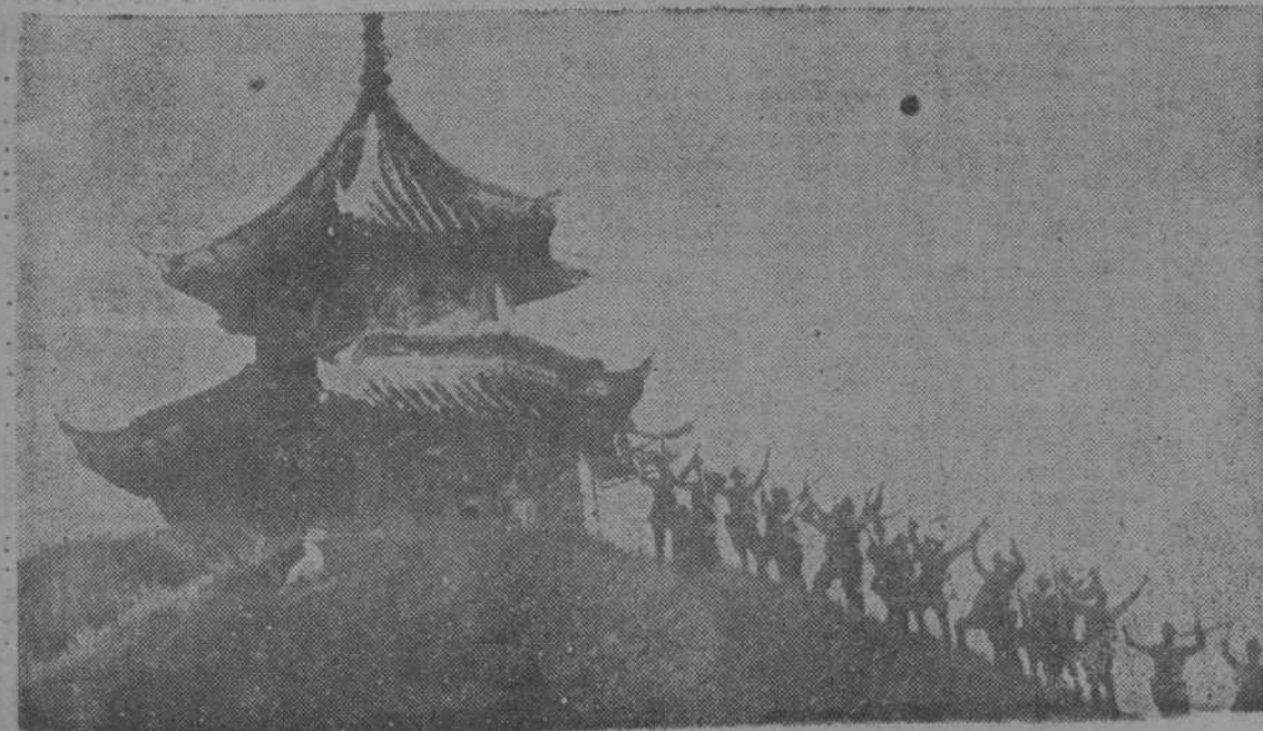
El general japonés Doihara, muerto en uno de los combates