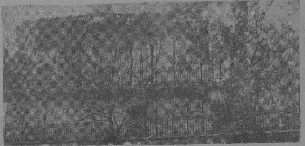
Uno de los edificios en que resistían los facciosos, es pasto de las llamas