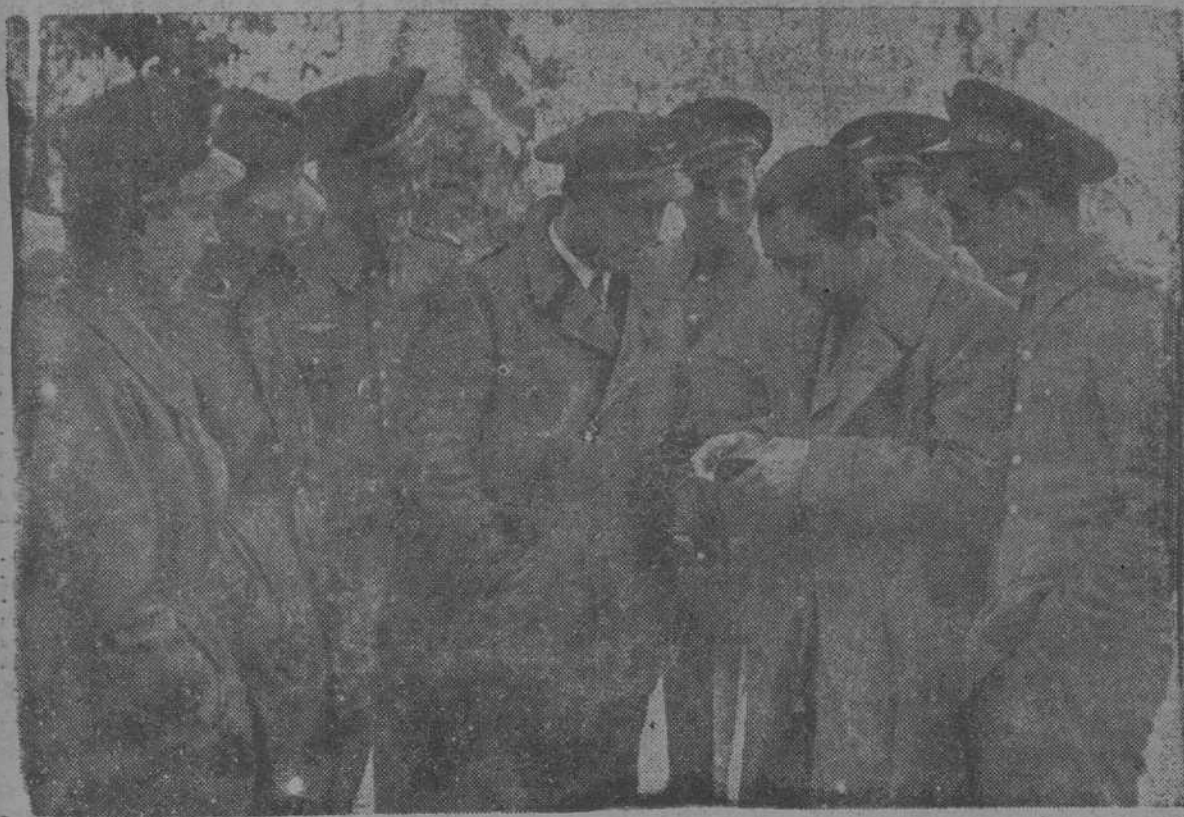
Grupo de aviadores que han participado en la toma de Teruel