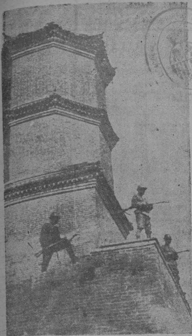
Centinelas japoneses en la torre de una posición fortificada a lo largo de la vía férrea de Peking-Hangkeu