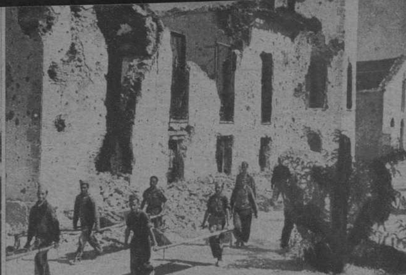
Después del combate en el que la artillería republicana, para desalojar al enemigo, ha tenido que destruir las casas convertidas en fortalezas, las tropas republicanas recogen los heridos abandonados por los facciosos