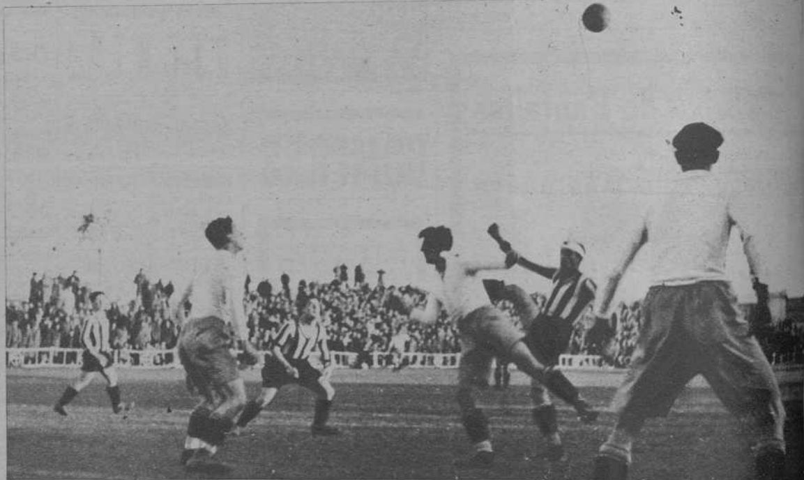
Una fase del partido de Liga «Zaragoza - Girona»