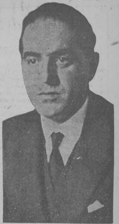
EL DOCTOR MARAÑÓN, COMENTADOR DE LAS IDEAS MEDICAS DEL PADRE FEYJOO

ESTE NUMERO HA SIDO VISADO POR LA CENSURA