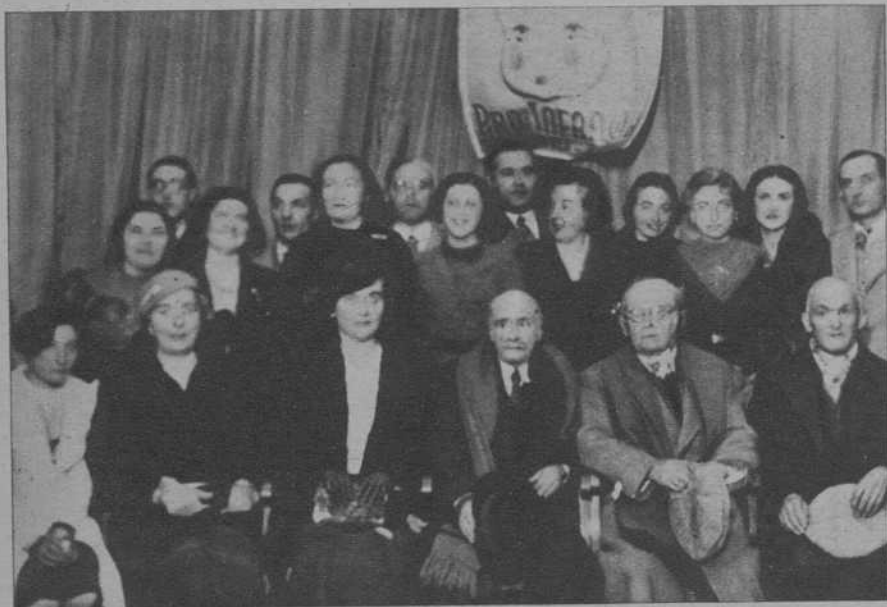
San Feliu de Llobregat. — El Comité del Sello pro infancia