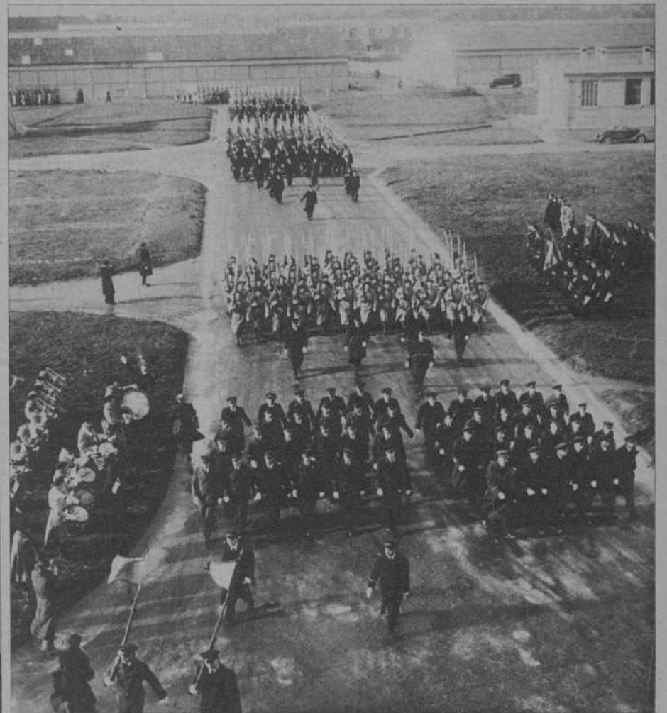
Paris. — Después de imponer condecoraciones el ministro del Aire, en el Aeródromo del Bourget, desfilan las tropas.