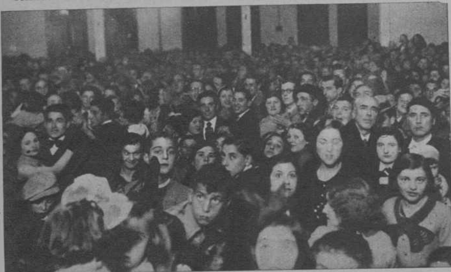
San Feliu de Llobregat. — Los concurrentes a la fiesta a beneficio del Sello pro infancia