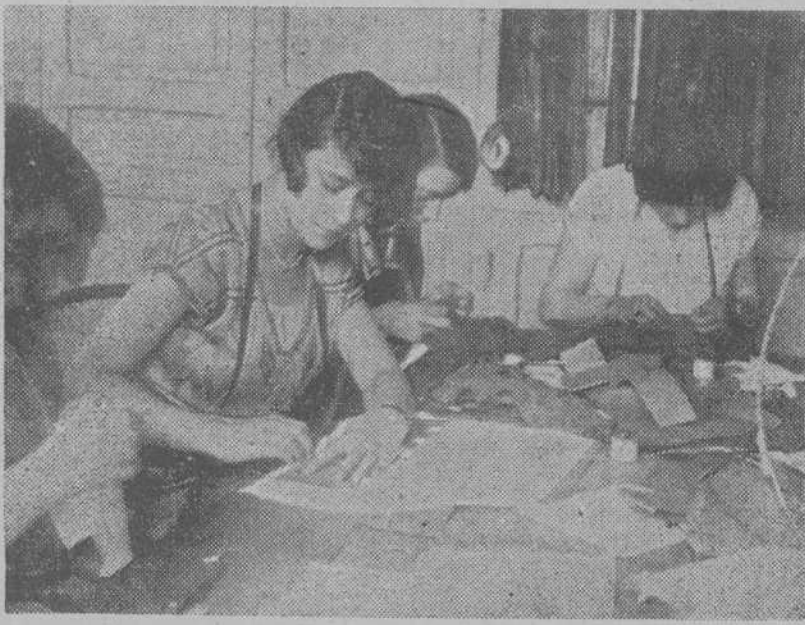
LAS MODISTILLAS ATIENDEN A SU LABOR PACIENZUDA, COSIENDO Y CANTANDO PARA HACERLA MENOS PESADA

La evolución se observa en los países nuevos de América, pero todavía más en la Europa Occidental, donde ha sido más brusco el cambio. Francia tiene hace años mujeres chofer y mujeres barbero, guardias de orden público y, recientemente, policías. Hay en Londres buen número de mujeres que trabajan en el puerto, en la conducción de traneas y dirección de grúas. Y en uno y otro país, como en cualquier de Europa, infinidad de mujeres oficinistas, empleadas en las dependencias del Estado y el Municipio, en las casas de Banca y comercio. Francia estima la intervención de la mujer en la vida pública en un