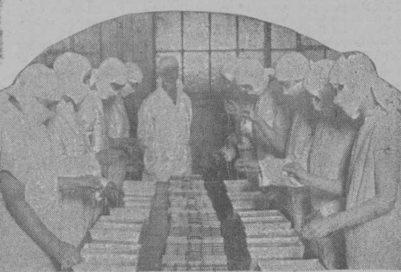
OFICIO DE MUJER: VEDLAS TRABAJANDO EN UN LABORATORIO PREPARANDO LAS SEDAS QUE HABRAN DE SERVIR PARA CURAR LAS HERIDAS...

treinta y cinco por ciento, e Inglaterra en un veinte.