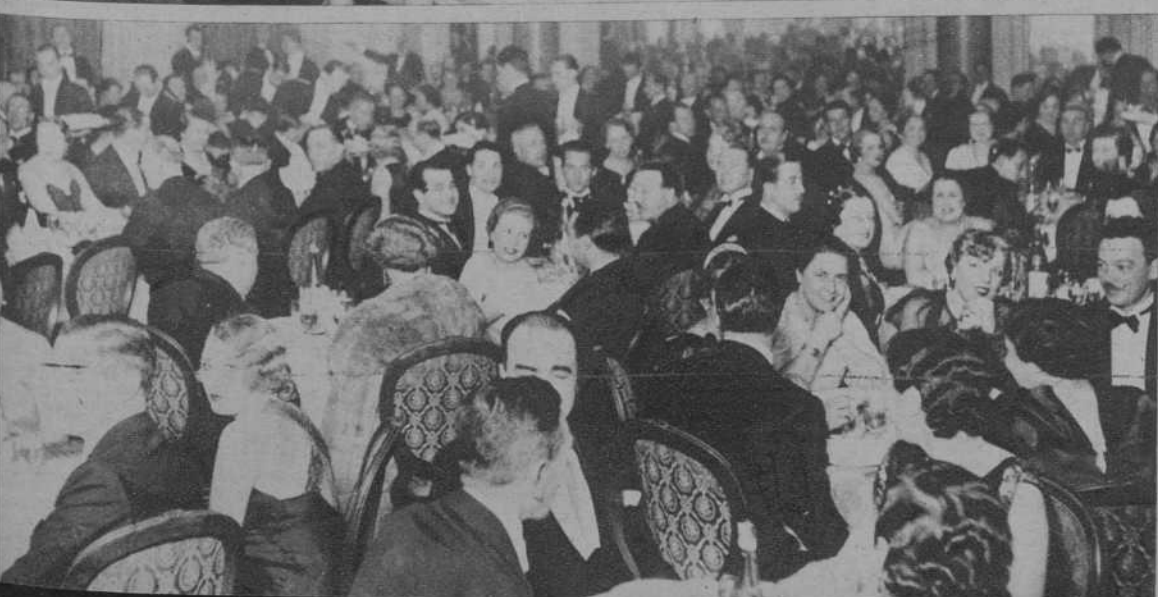
El paquete de la novia italiana en el Ritz