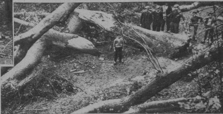
Los daños causados por la tramontana en Bañolas.