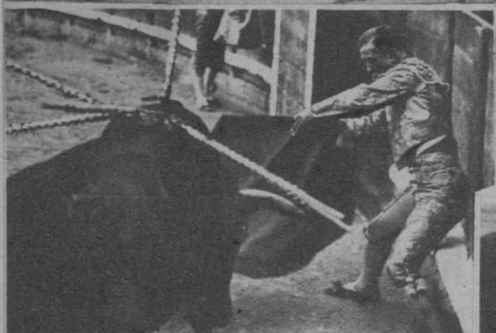
Pedro Basauri, «Pedrucho», el pundonoroso torero vasco-catalán, cuya inclusión en el cartel de la grandiosa corrida Goyesca, representa un gran acierto por parte del señor Balañá, que ha querido premiar así los méritos indiscutibles del formidable estoqueador, que no podía estar ausente tratándose de una fiesta de exaltación de la belleza de las mujeres catalanas