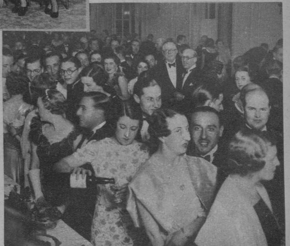
Baile celebrado por la Peña Hipica.