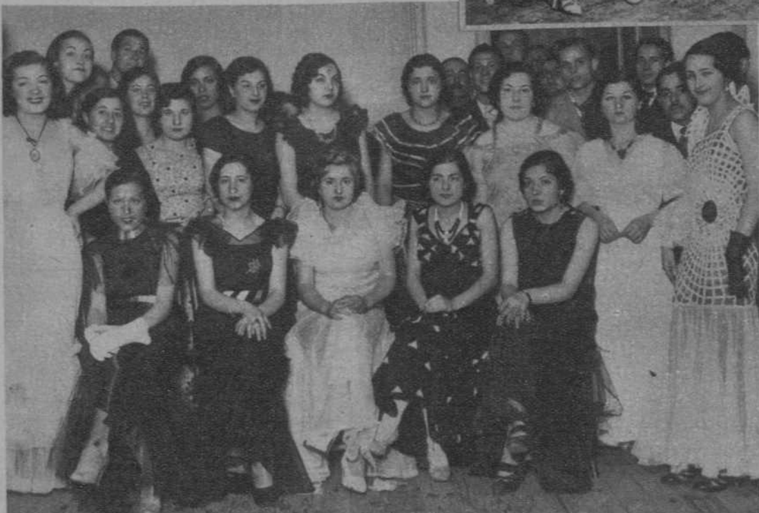
Participantes en el concurso del vestido de cuatro pesetas organizado por la Peña Universo.