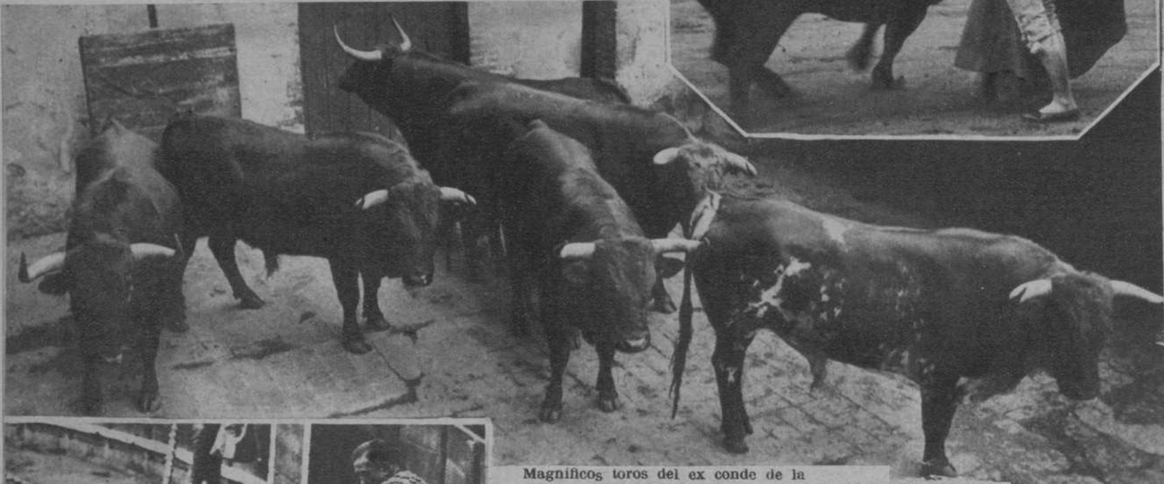
Magníficos toros del ex conde de la Corte, que serán lidiados en la Corrida Goyesca

DOMINGO, DIA 15, GRANDIOSA CORRIDA GOYESCA, CON ASISTENCIA DE LAS MISSES BARCELONA, PRIMAVERA, «MERCADOS» Y DE TODAS LAS POBLACIONES DE CATALUÑA