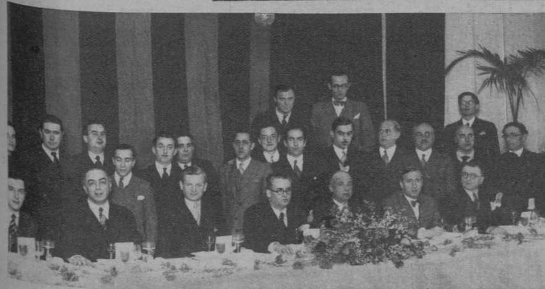
El banquete de los periodistas extranjeros a las autoridades barcelonesas.