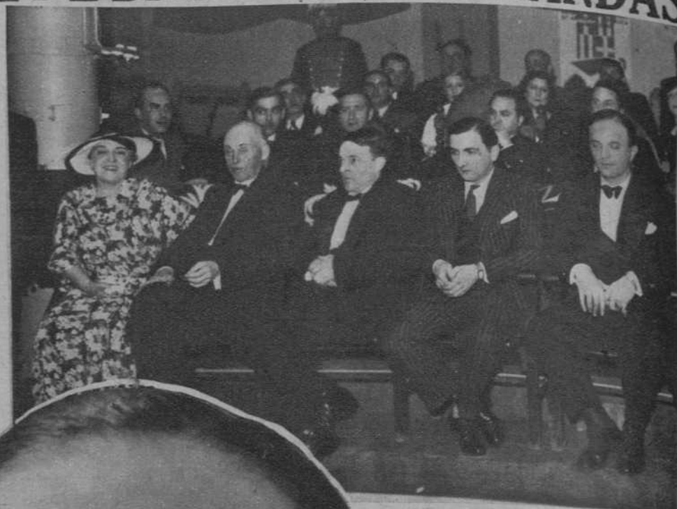
Presenciando las primeras partidas disputadas.