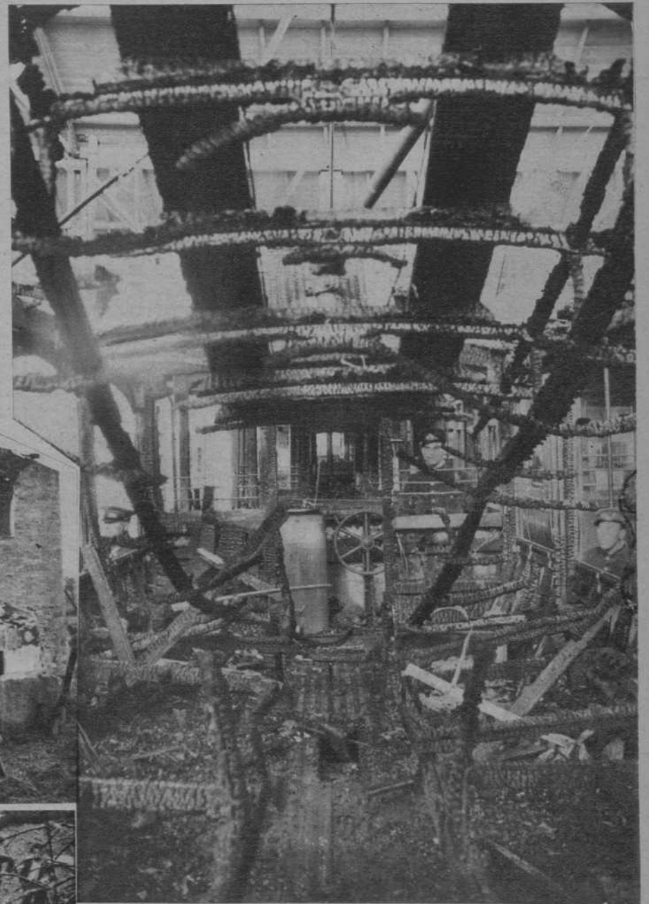
El tranvía incendiado en La Bordeta la noche del miércoles