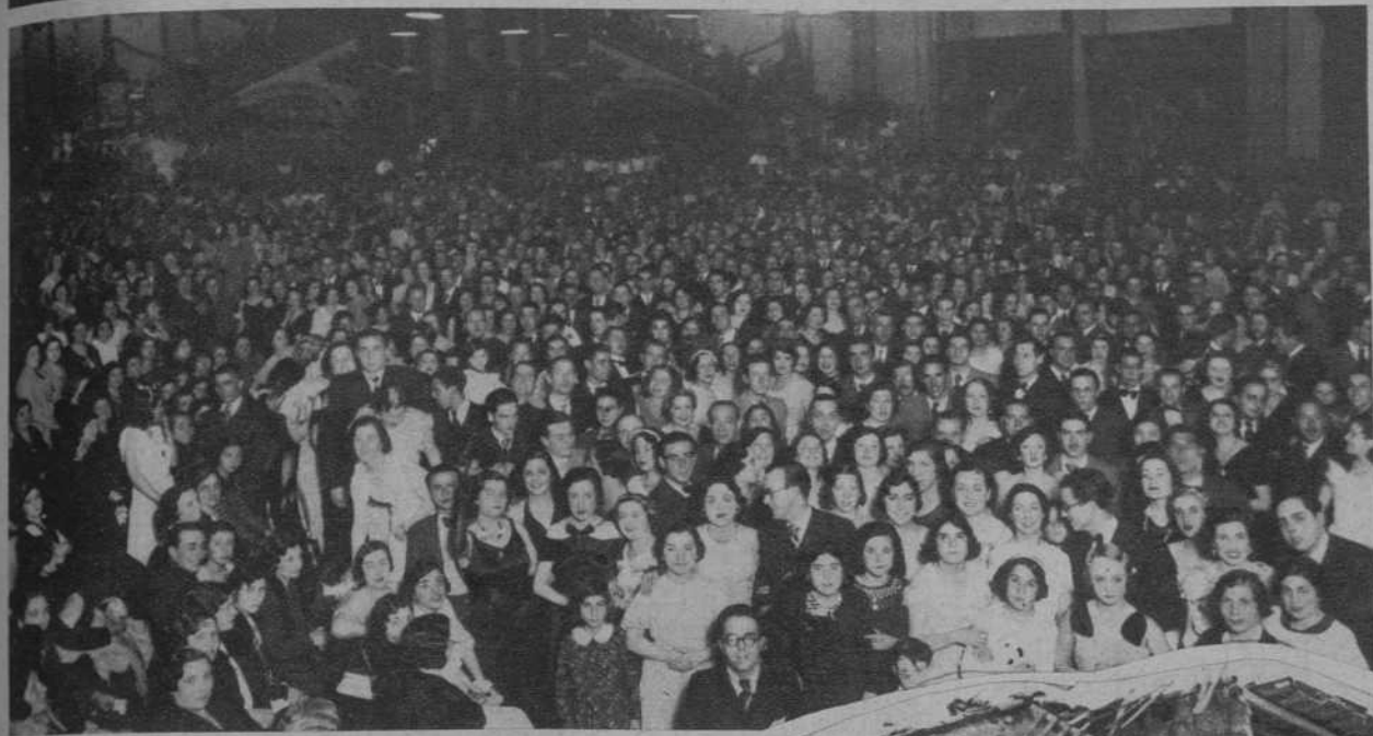
Un aspecto del Palacio de Bellas Artes durante el baile florido.