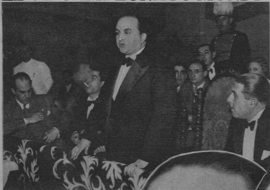
El Consejero de Cultura de la Generalidad, en el acto de la inauguración, celebrado la noche del viernes en el Billar Club Barcelona.