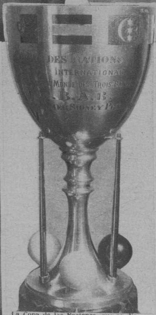
La Copa de las Naciones, que se disputan los participantes en el Campeonato.