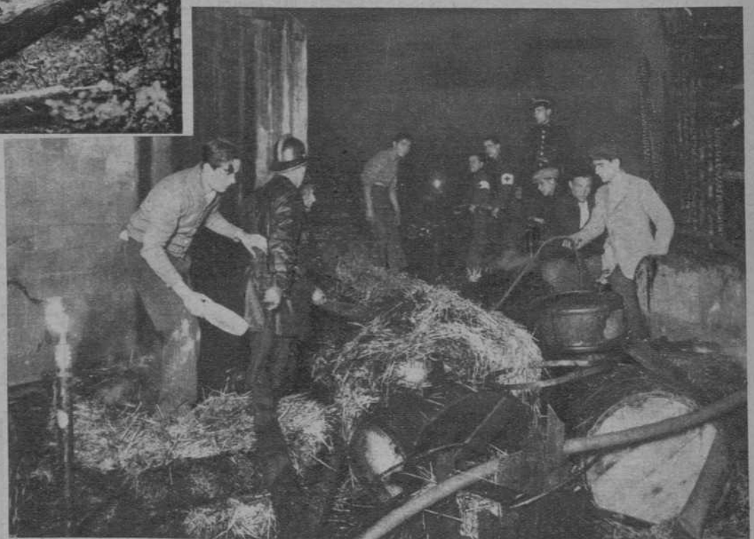
El incendio en una fábrica de decoraciones de cristal, de la calle Rosés, 7 ocurrido la noche del miércoles.