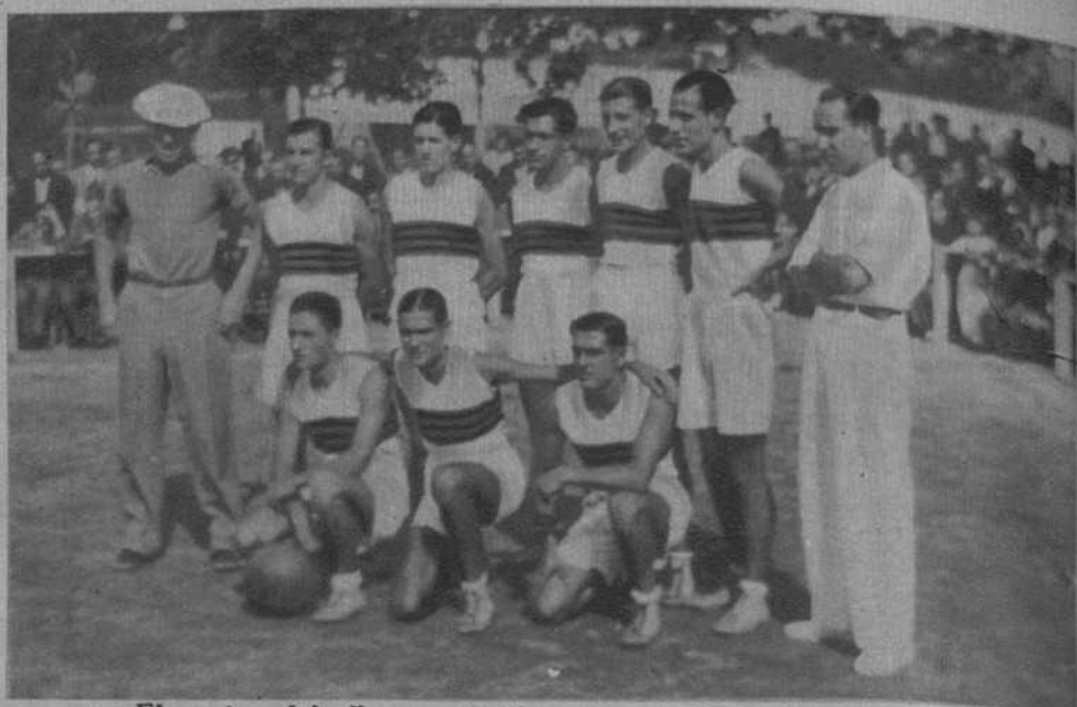
El equipo del «Iluro», de Mataró, vencedor del «Madrid» en el Campeonato de basquet ball.