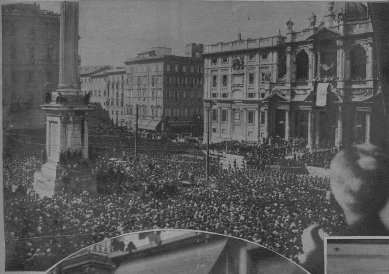
Roma.—El Papa, bendiciendo a la multitud desde el gran balcón de la basílica de Santa María la Mayor