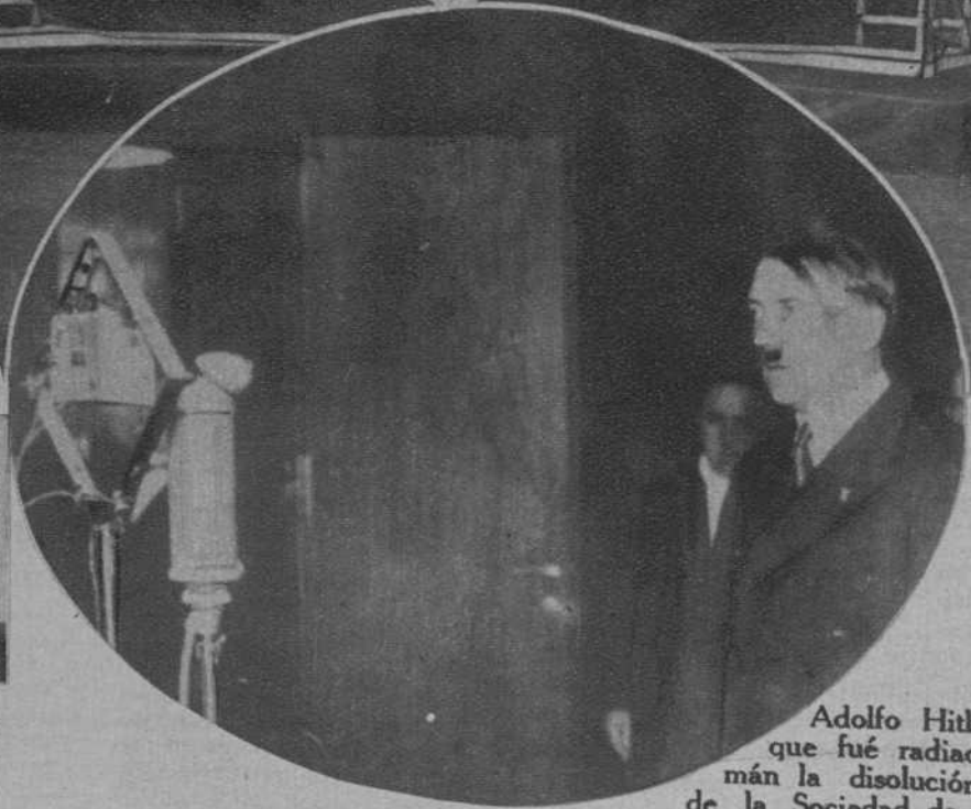
El Canciller de Alemania, Adolfo Hitler, pronunciando el discurso que fué radiado anunciando al pueblo alemán la disolución del Reichstag y la retirada de la Sociedad de Naciones.