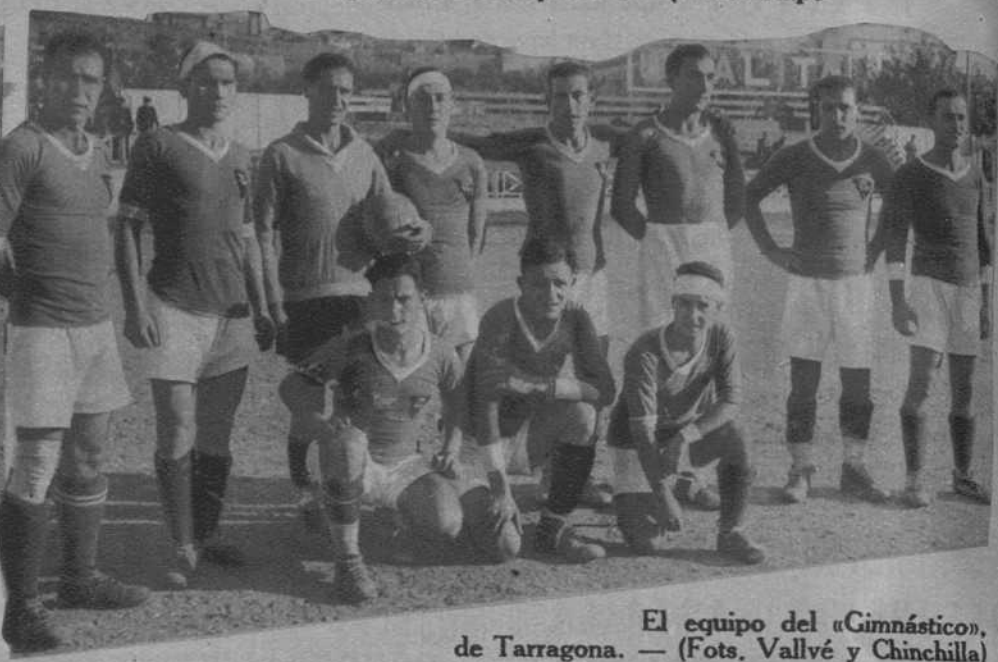
El equipo del «Gimnástico», de Tarragona.