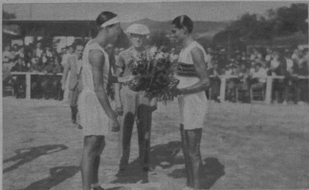
Mataró.—Los capitanes del «Madrid» y del «Iluro», durante las cortesías preliminares del partido de Campeonato de basquet ball entre el «Iluro» y el «Madrid»