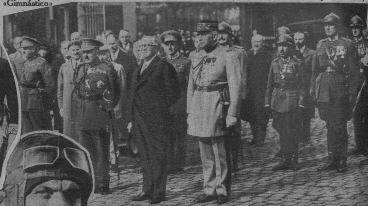
Bruselas.—Un destacamento del segundo regimiento de lanceros, que combatió durante la Gran Guerra al lado del séptimo regimiento francés, rinde homenaje al soldado desconocido, asistiendo a la ceremonia el embajador de Francia, el general Chardigny, agregado militar francés y el representante del Gobierno belga