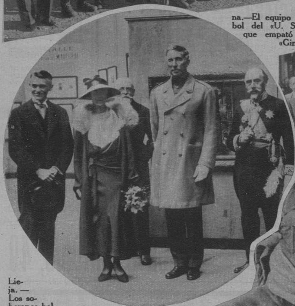
Lieja.— Los soberanos belgas, en la Exposición de Artes inaugurada en el Palacio de Bellas Artes