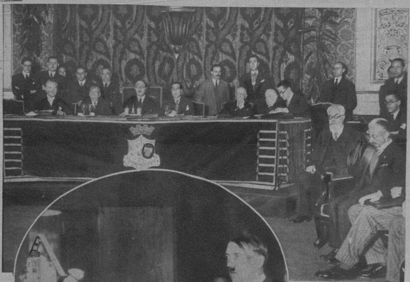
Madrid.—Bajo la presidencia del ministro de Estado, se ha inaugurado la V Conferencia Internacional para la unificación del Derecho penal.