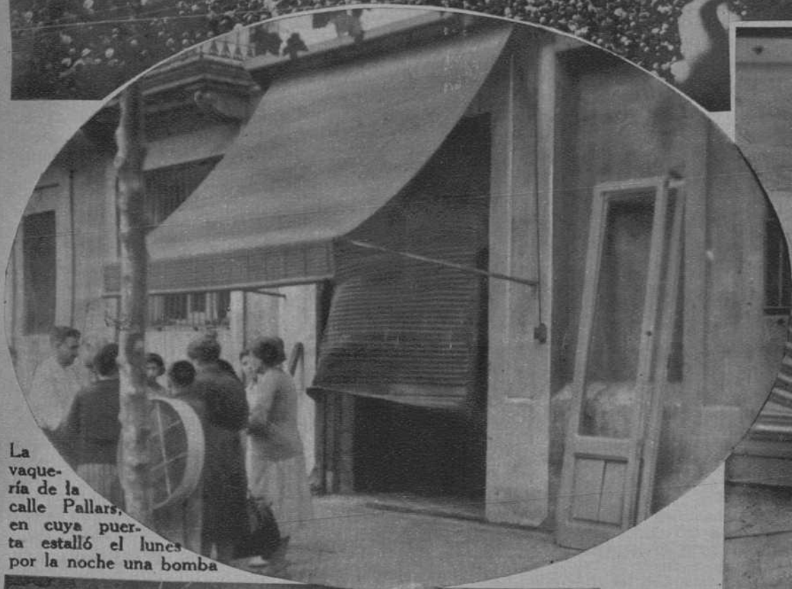
La vaquería de la calle Pallars, en cuya puerta estalló el lunes por la noche una bomba