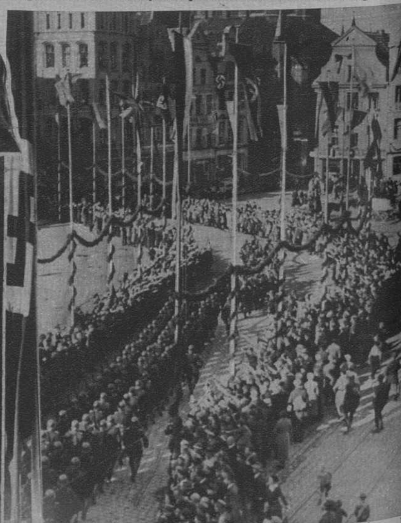
Desfile de topas en las calles de Rostock, para celebrar la unión de Mecklenburgo-Schweim y Mecklenburgo-Strelitz