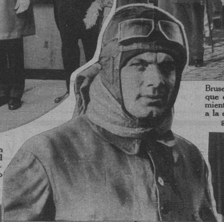
El ingeniero alemán Tiluig, que falleció al estallar un cohete destinado a ser lanzado a la estratosfera