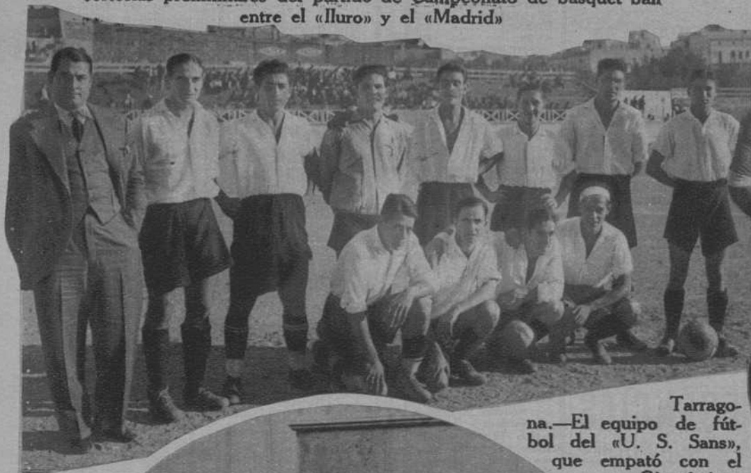
Tarragona.—El equipo de fútbol del «U. S. Sans», que empató con el «Gimnástico»