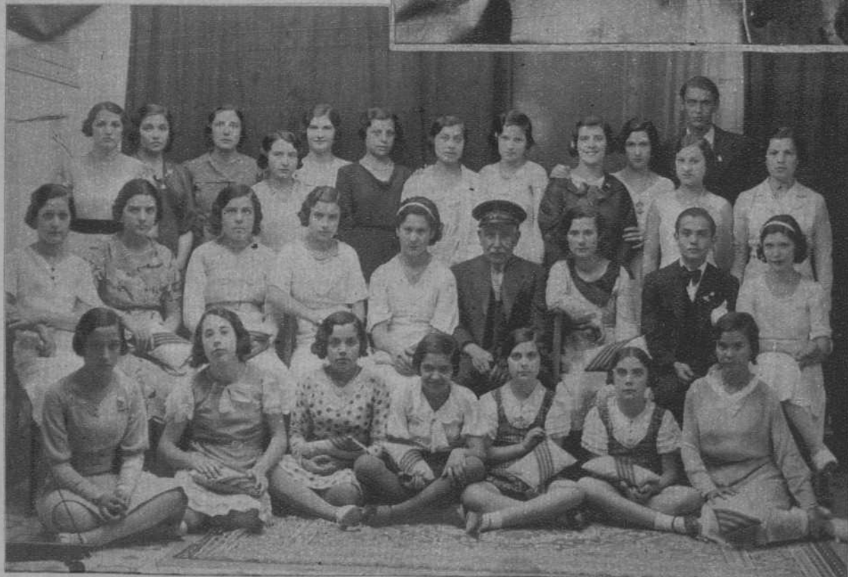
Caldas de Montbuy.—Grupo de señoritas participantes en la fiesta de la flor, destinándose la cantidad recaudada por la Asociación Benéfica, a los pobres.