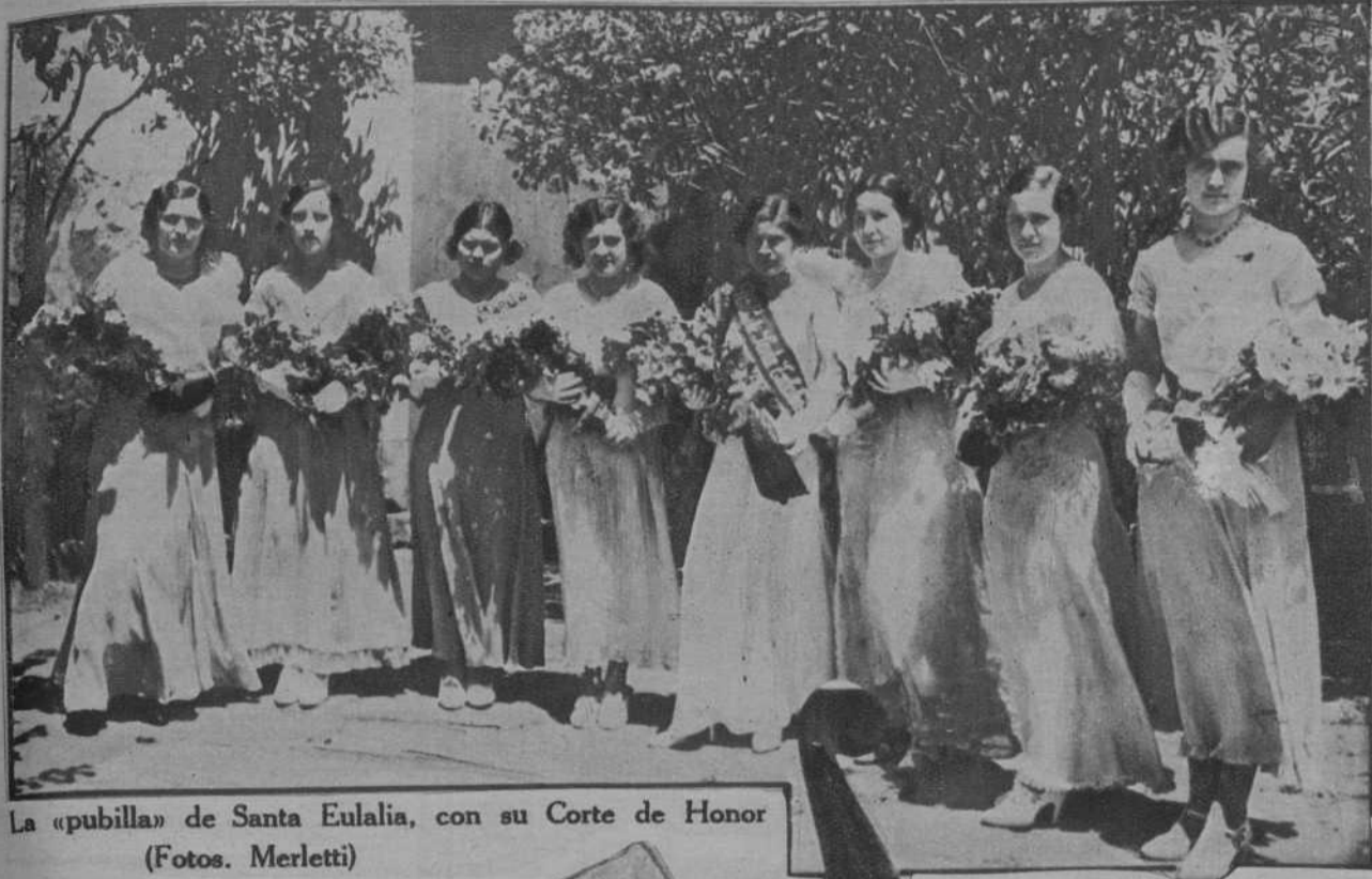
La «pubilla» de Santa Eulalia, con su Corte de Honor