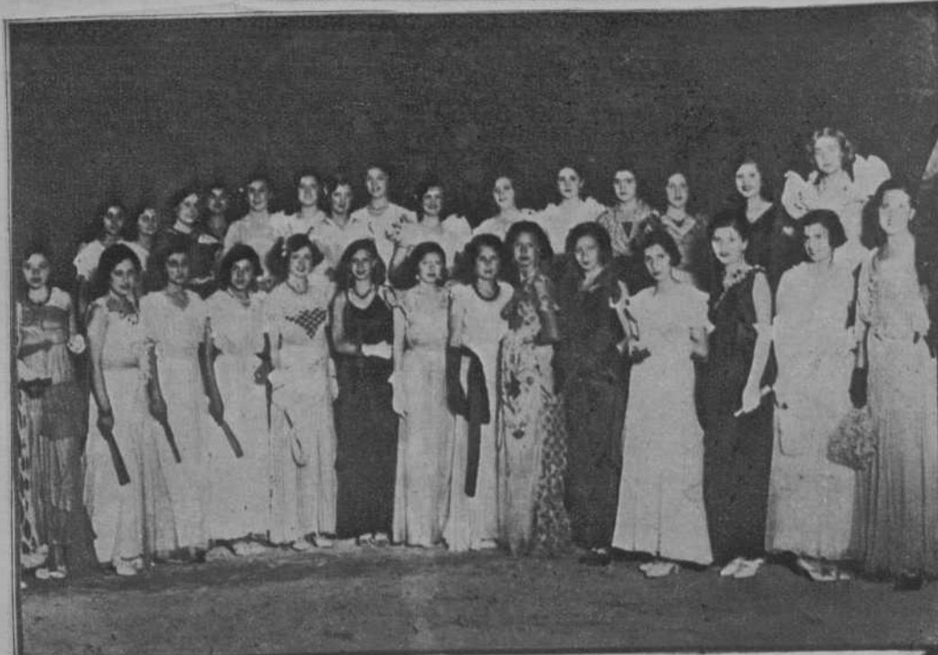
Señoritas que participaron en el Concurso de trajes de cuatro pesetas, organizado por el Comité central fallero