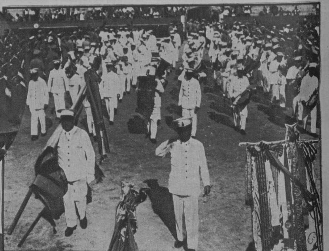
La Banda Municipal de Castellón de la Plana