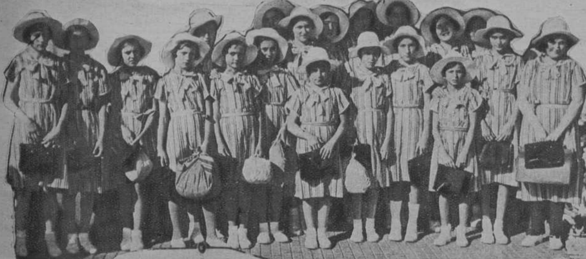
Salida del segundo grupo de colonias que sostiene en Ripoll la Asociación de Amigos de los Pobres