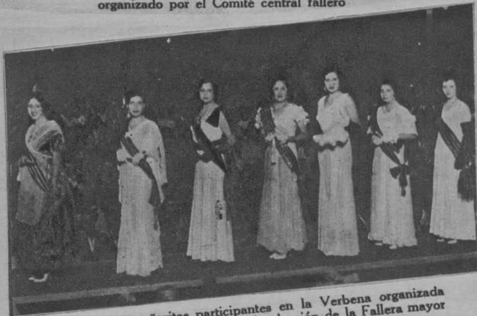
Las señoritas participantes en la Verbena organizada por el Comité central fallero, para la elección de la Fallera mayor