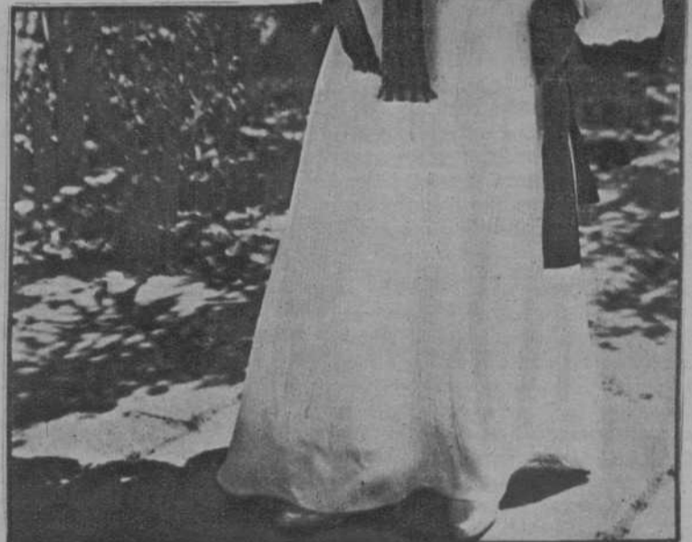
LAS FIESTAS DE GUILLERMO EL TACITURNO, EN ORANGE