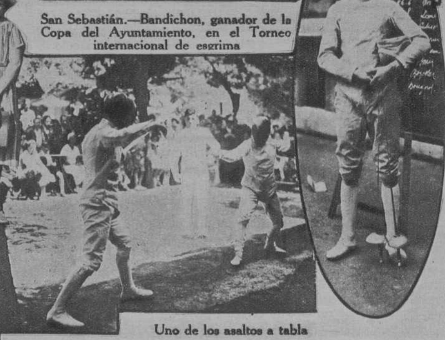
Uno de los asaltos a tabla