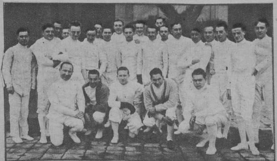
Los participantes en el Torneo.