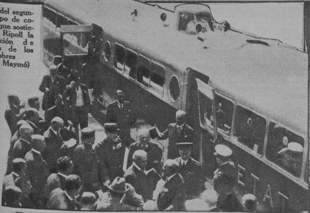
Cherburgo.—Llegada en un auto-rail del Presidente de la República, para asistir a la inauguración de la nueva estación marítima. — (Foto. Keystone)