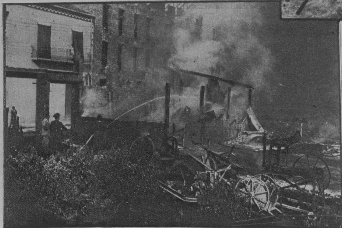
Llerida.—Un incendio destruyó el almacén de carpintería y embalajes de la fábrica de cristales y espejos de los señores Cardona y Munné.