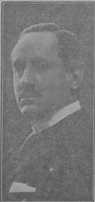
LO QUE OPINA EL DOCTOR DON AUGUSTO PI Y SUÑER

El catedrático de la Facultad de Medicina de la Universidad de Barcelona, doctor don Augusto Pi y Suñer, ha contestado a nuestro requerimiento: