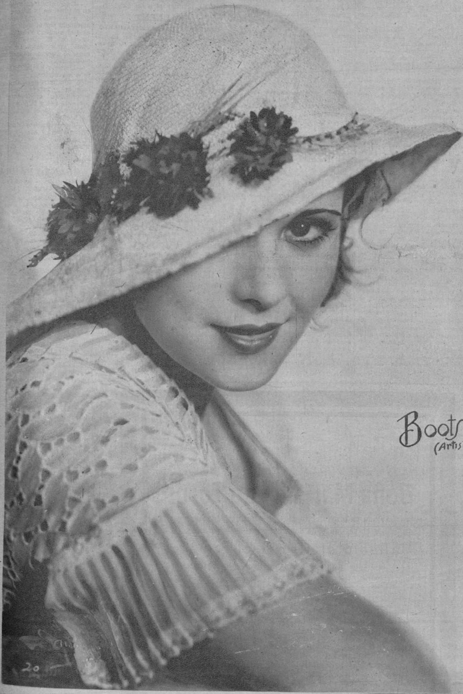
Boots Mallory (Artista de Cine)