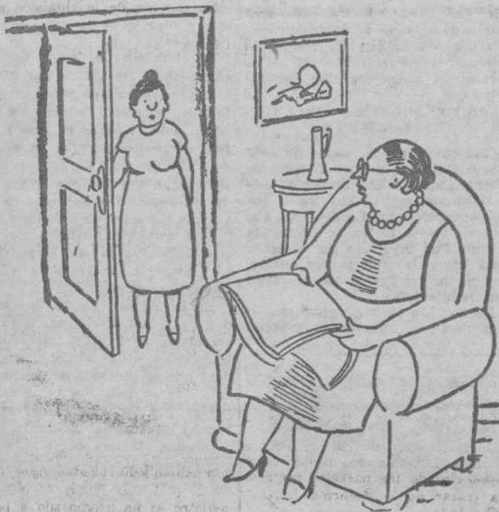
—Señora, se me ha caído la mantilla del niño a la calle cuando la estaba sacudiendo en el balcón. —¡Torpel! ¡Ahora se constipará el niño! —Eso no señora. La lleva puesta.