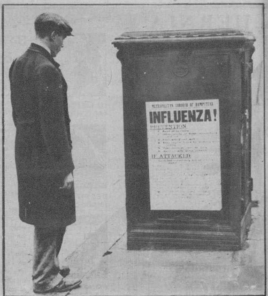
La gripe ha obligado a la municipalidad de Hampstead a fijar carteles en los que se indican las medidas para preservarse de la enfermedad.