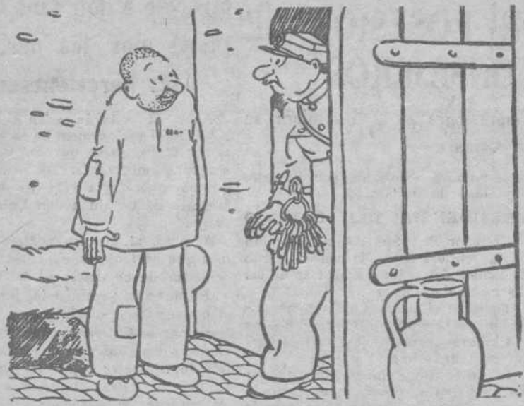
El preso nuevo.—¿Quiero usted decirme la salida para caso de incendio?