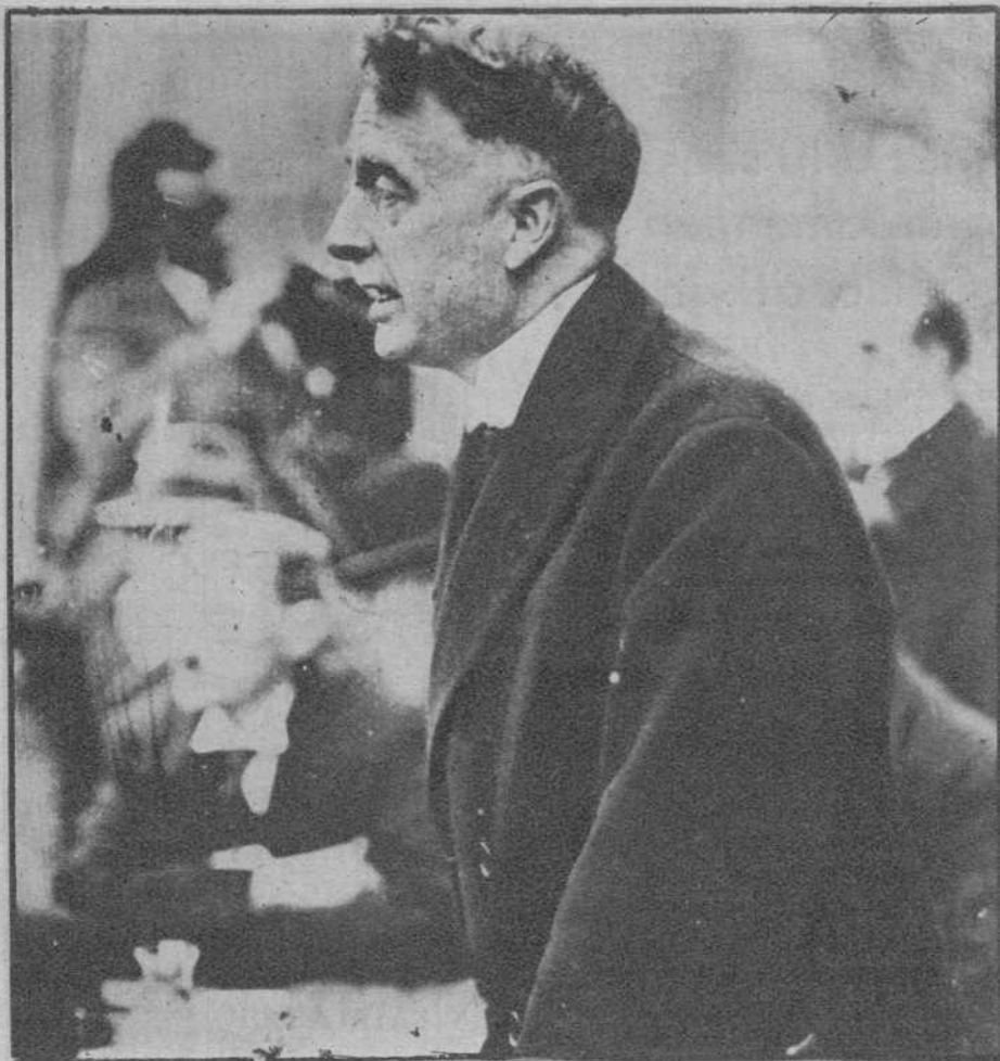
El adversario del Presidente de Irlanda, Cosgrave, en un acto electoral