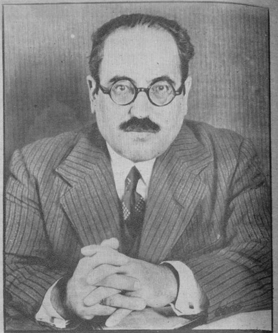
El nuevo gobernador civil de Barcelona, don Claudio Ametlla.