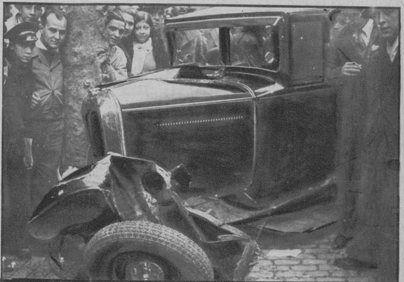
Destrozos causados en el coche particular