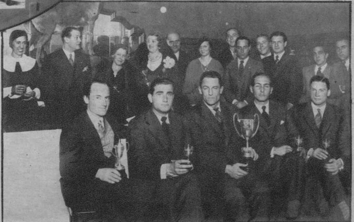
Barcelona.—Reparto de premios en el salón del Hotel Victoria, de la carrera social celebrada en Nuria el 8 del actual, a cuyo acto asistió numerosa concurrencia.