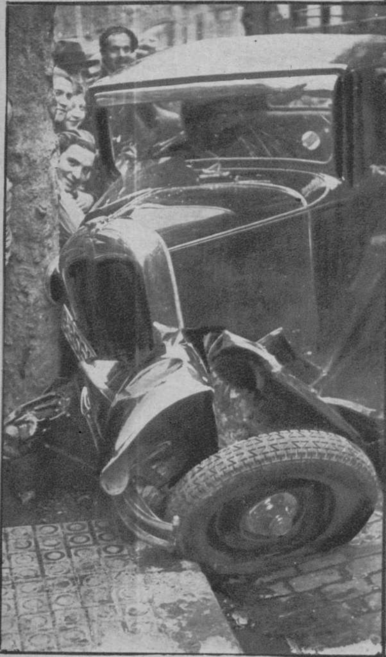
Estado en que quedó el auto particular de la matrícula de Barcelona, con el que chocó el auto-escalera de los bomberos

DEL ACCIDENTE DE AUTO EN LA CALLE DE MUNTANER, OCURRIDO AYER, EN EL QUE RESULTARON VARIOS HERIDOS