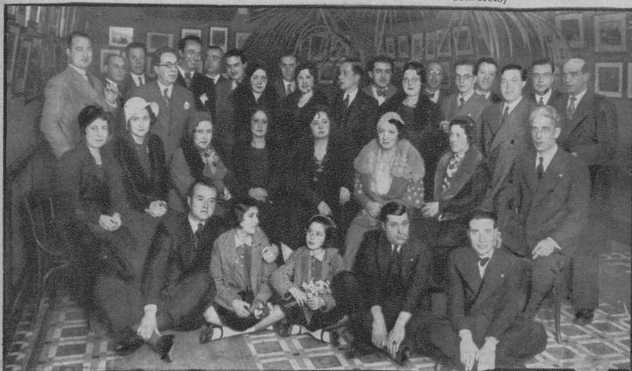
Barcelona.—Acto inaugural de la Exposición anual de la Agrupación fotográfica de Cataluña