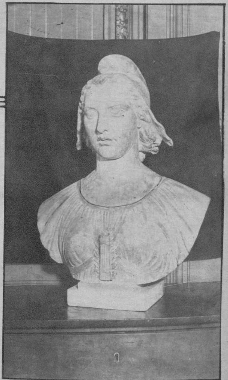
París.—Nuevo busto de la República, obra del artista Poisson.