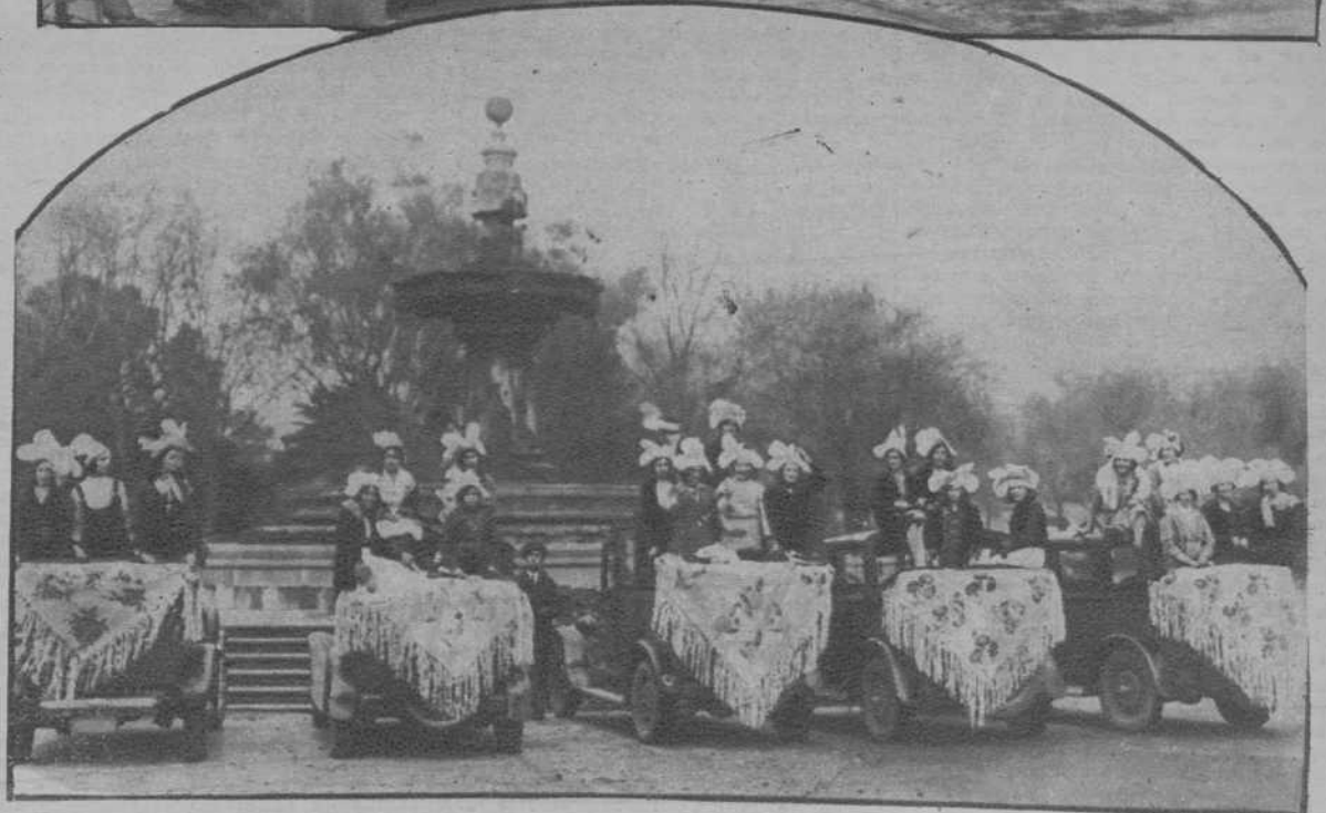
Barcelona.—Dos aspectos de la fiesta de las modistillas.