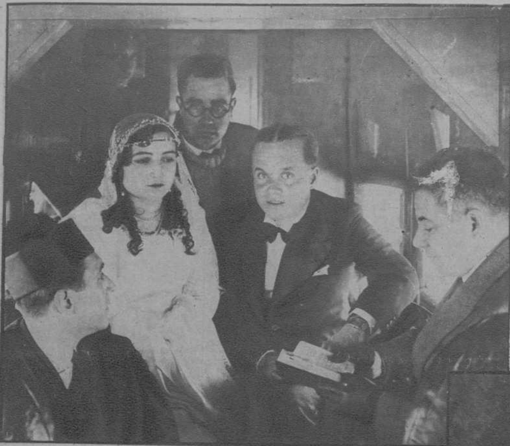
En el interior del avión. Momento en que el juez municipal efectúa la boda de «Miss Aero Popular».

MADRID.—LA PRIMERA BODA EN AVION CELEBRADA EN EUROPA. — «MISS AERO POPULAR», SE HA CASADO. — DEL AERODROMO DE CUATRO VIENTOS SE HA ELEVADO UN AVION TRIMOTOR EN EL QUE, EN PLENO VUELO SOBRE MADRID, SE HA CELEBRADO EL MATRIMONIO DE «MISS AERO POPULAR».