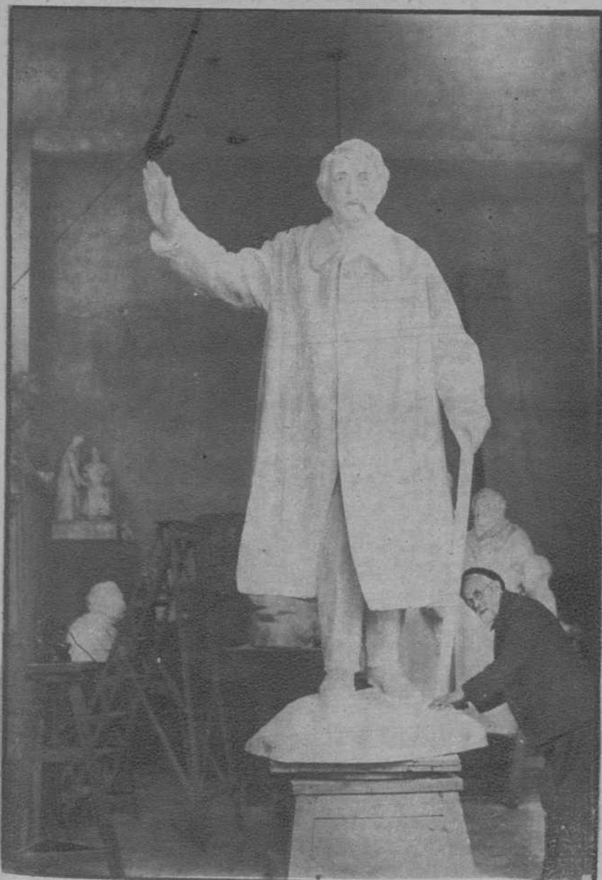
Paris.—Estatua de Aristides Briand, obra del escultor francés Guillaume para el monumento que en breve será inaugurado en Pacy-sur-Eure