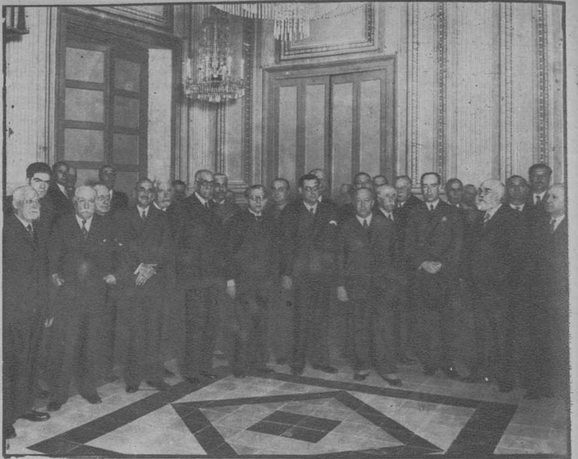
Barcelona.—Las autoridades, en el acto de inauguración oficial del Instituto Agrícola de San Isidro.