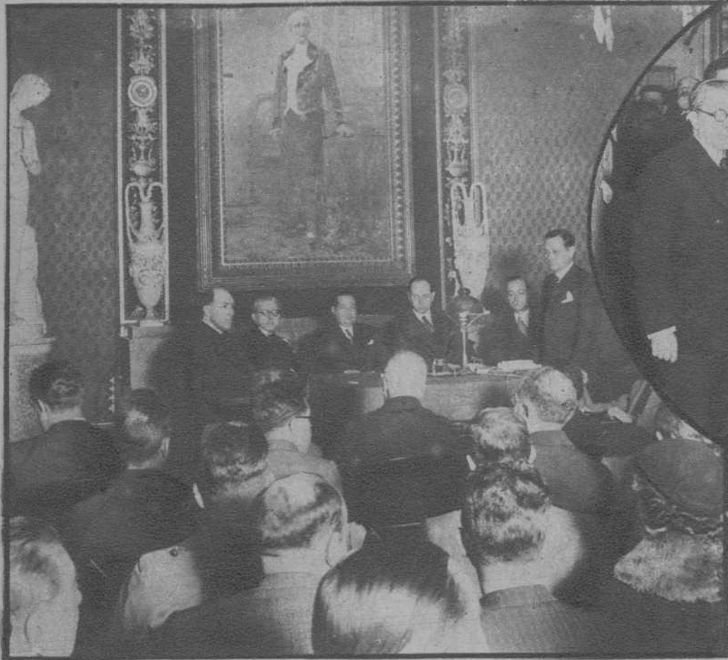
Barcelona.—Inauguración, en el Palacio de la Lonja, de la Exposición Retrospectiva de documentos mercantiles