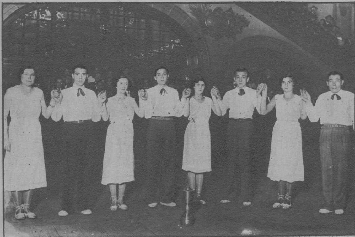
Barcelona.—La Juventud Ampurdanesa, de Figueras, ganadora de la Copa de Honor de la Generalidad, en el concurso de sardanas celebrado en el Pueblo Español de Montinich.