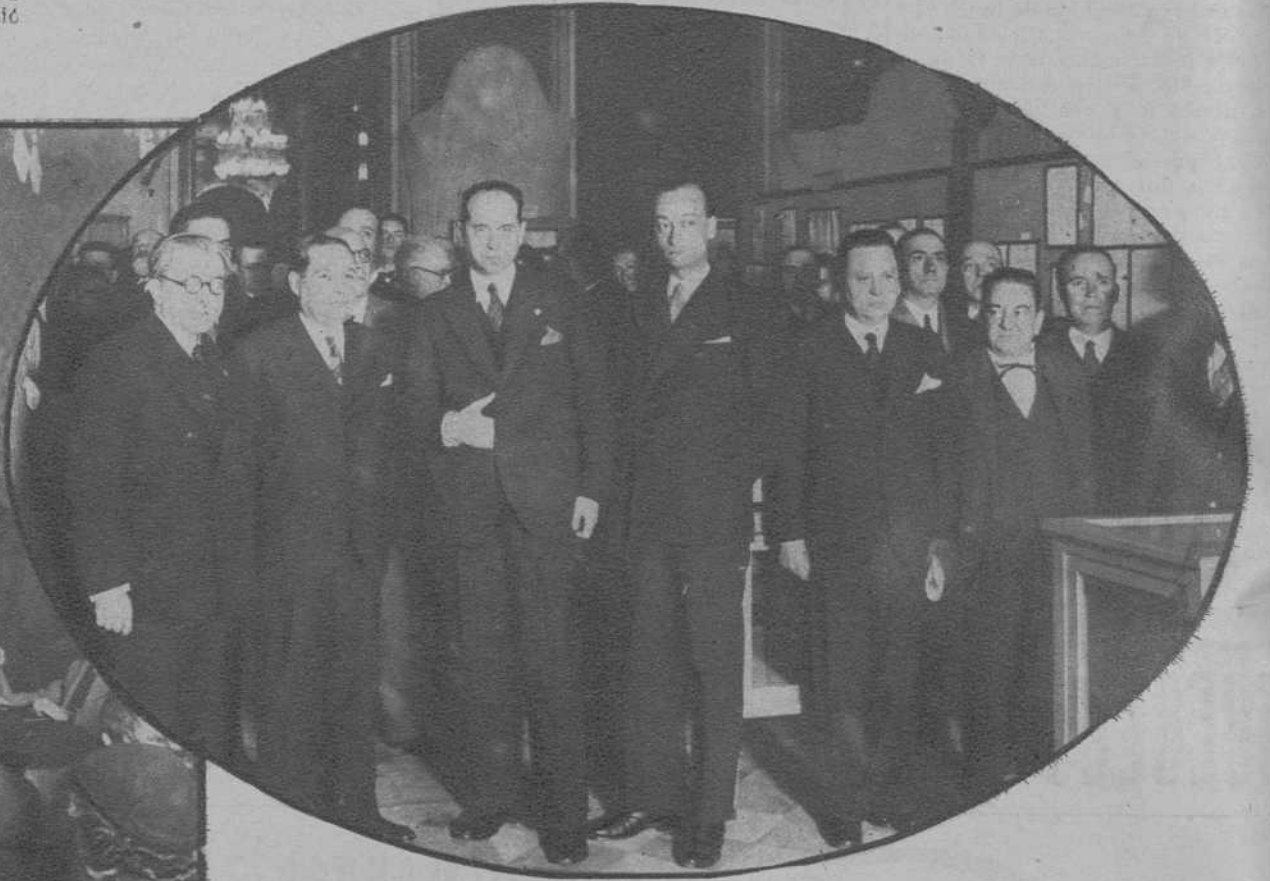
Barcelona.—Las autoridades que asistieron al acto inaugural