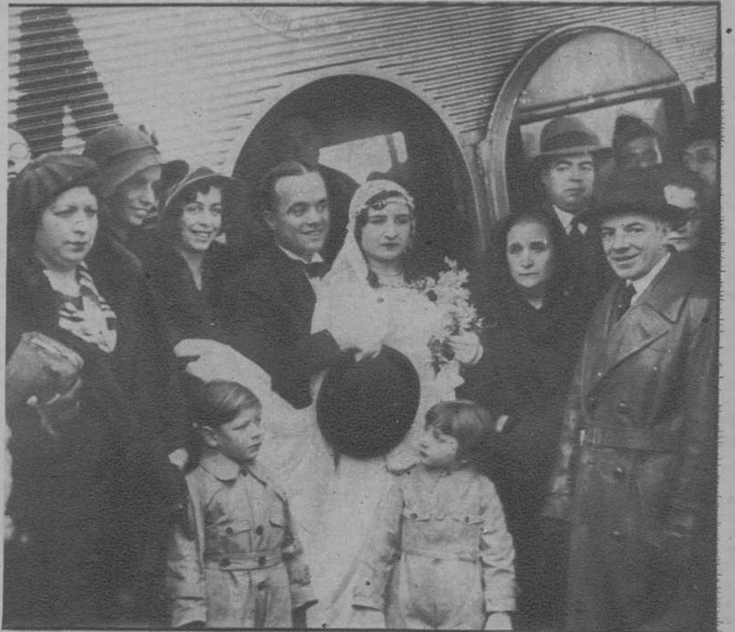
Los novios, al ir a entrar en el avión, para emprender el vuelo durante el cual han de casarse