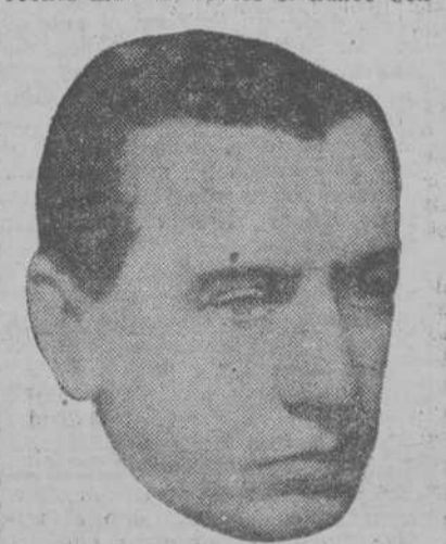
Don Arturo Alessandri, nuevo Presidente de la República Chilena

tiempo que la primera fuese obligatoria—base principal de la verdadera democracia; mejoró notablemente las condiciones económicas del profesorado, y dictó, entre otras leyes sociales, el Código del Trabajo, las de Tribunales de Conciliación y Arbitraje, que pusieron término a los constantes y perjudiciales conflictos entre patronos y obreros, regulando sus relaciones, obligaciones y derechos mutuos; creóse el Banco Cen-