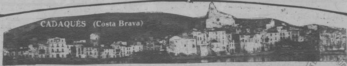
CADAQUÉS (Costa Brava)

REDACCIÓN DIRECCIÓN COMERCIAL Y ANUNCIOS Plaza de Cataluña, 9 - Tel. 14160 IMPRESA Y TALLERES MUNTANER, 49 ENTRADA: Pasaje de la Merced, núm. 8 Teléfono 31518