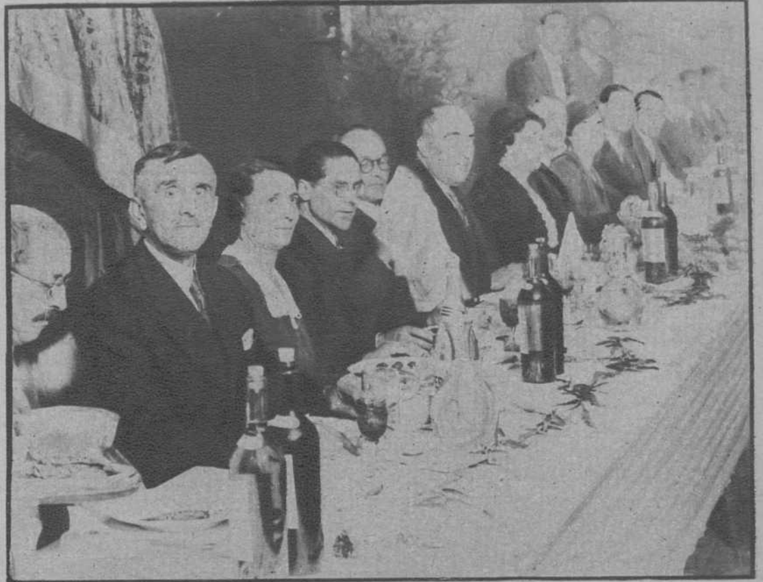
Presidencia del banquete de fraternidad Mutualista, celebrado en el restaurant La Patria.