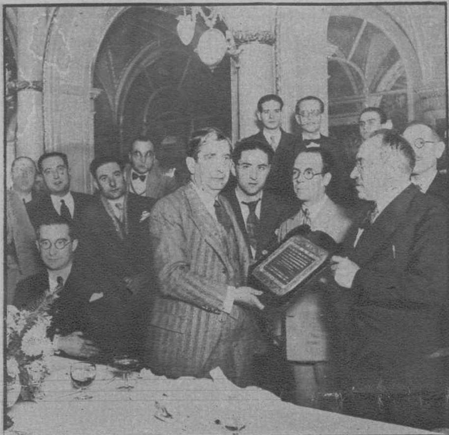
La Asociación Nacional de Maestros Particulares de Cataluña, entregando a don Marcelino Domingo una placa nombrándole socio de honor de dicha entidad.