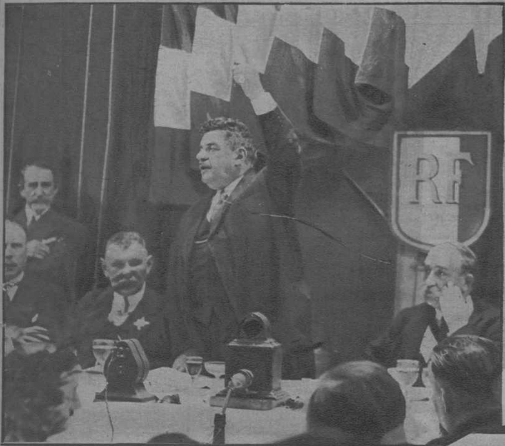
Lens.—M. Herriot, afirmando en un discurso la voluntad pacifista de Francia.