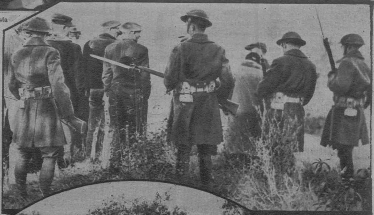
Taylorville (E. U.).—Las tropas, cerrando el paso a los sin trabajo, que intentaban saquear la ciudad.