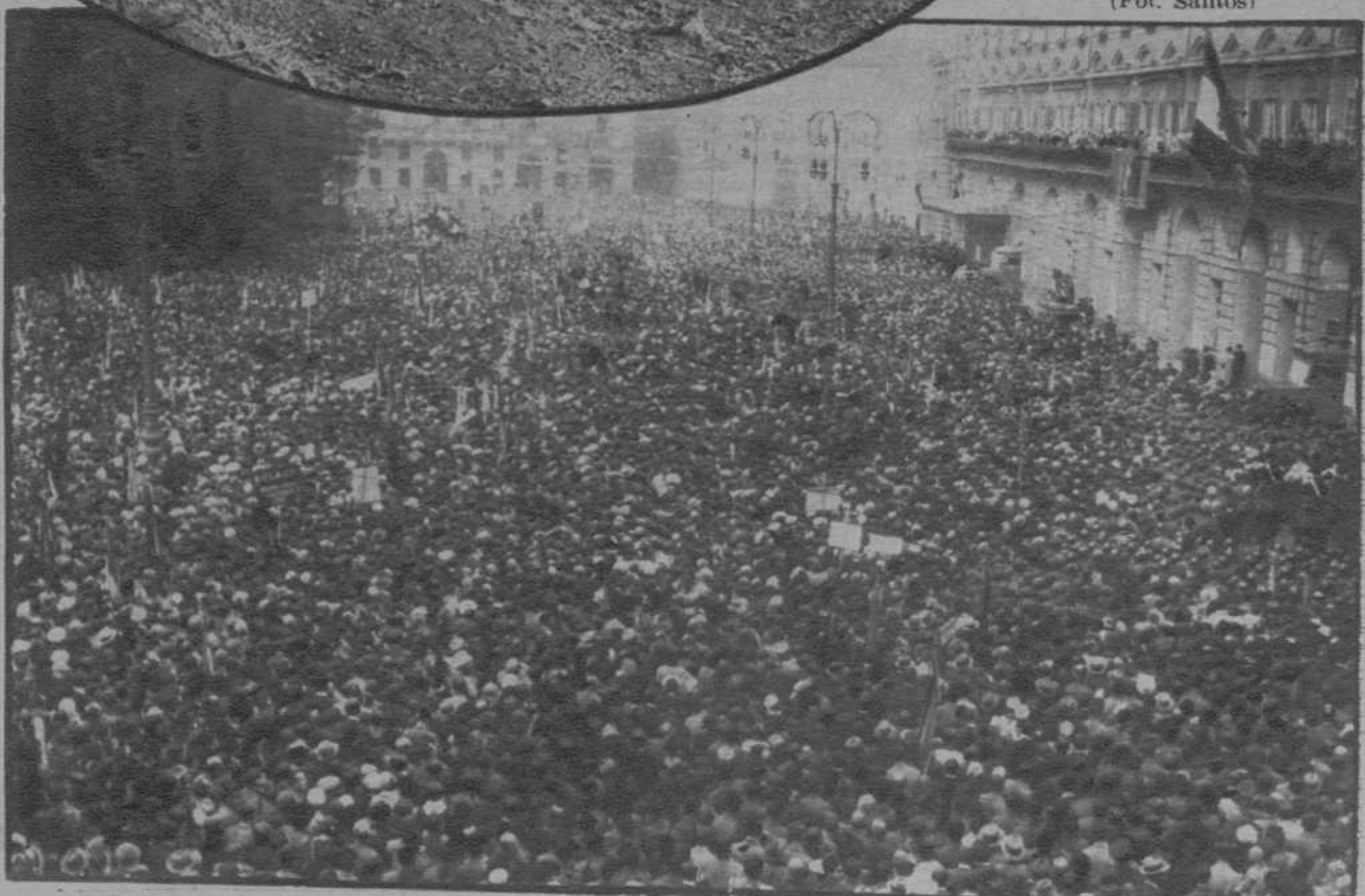
Turín.—La plaza de la ciudad italiana, mientras Mussolini habla ante 100.000 fascistas.

Casa Lufri. Apartado 9.033. Madrid Conforme su anuncio, remítame a vuelta de correo un CASCO ONDULADOR por Ptas. 9'50, contra reembolso (o adjunto sellos de Correos por 9'50 Ptas.). Nombre ..... Dirección ..... Indíquese si el Casco es para raya al lano o al mento