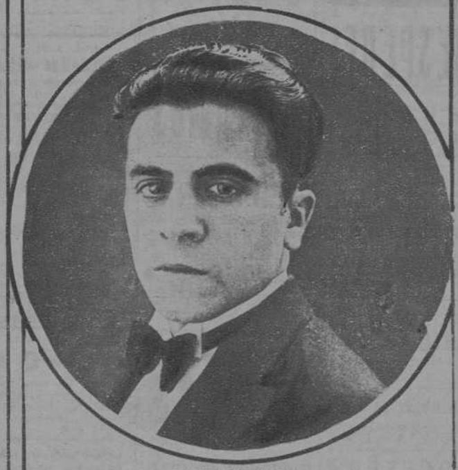
El notable tenor PEDRO DE DEU