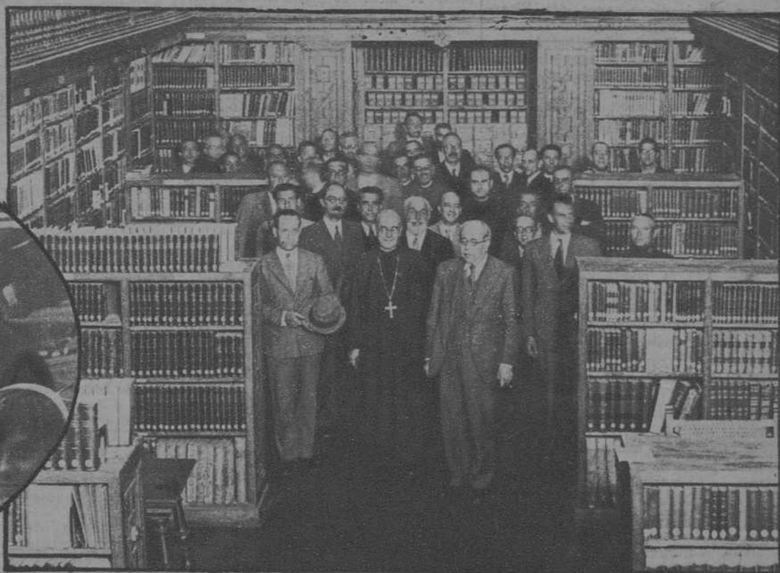
El señor Azaña visita la biblioteca del Monasterio.