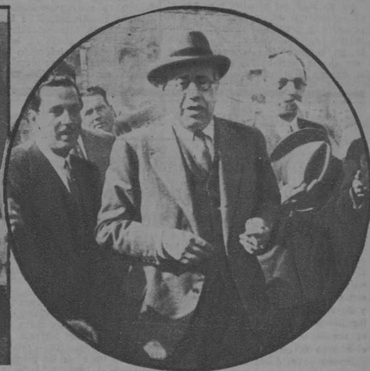
El señor Azaña, con el gobernador, contemplando el panorama