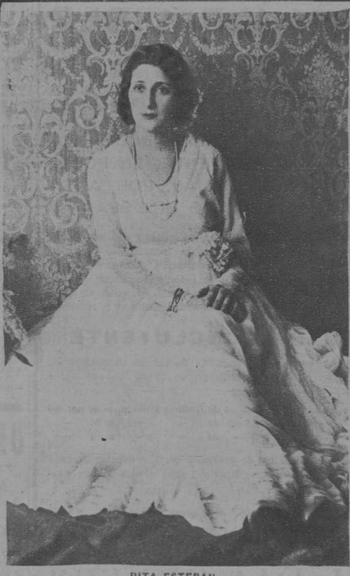
RITA ESTEBAN, notable tiple de zarzuela