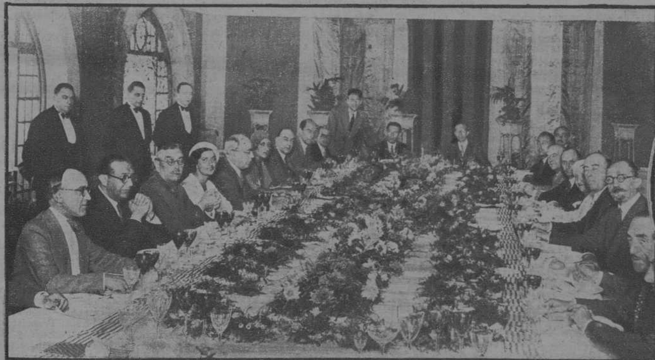
Banquete ofrecido por la Generalidad al jefe del Gobierno, en el Restaurant Catasús, de Montserrat