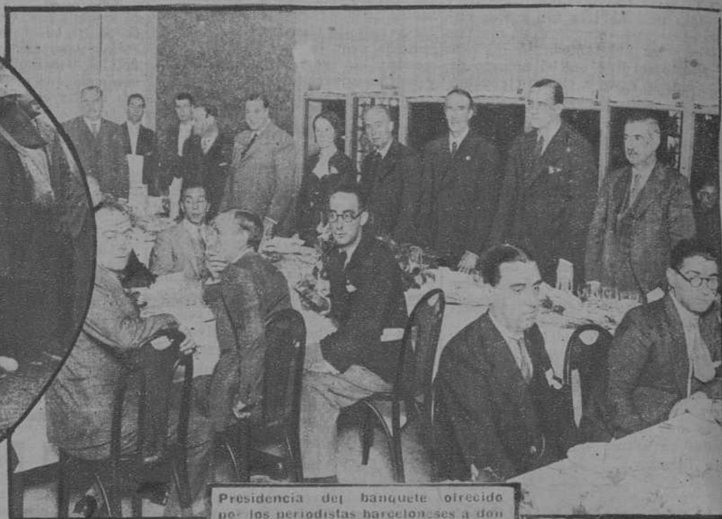
Presidencia del banquete ofrecido por los periodistas barceloneses a don Luis Bello.