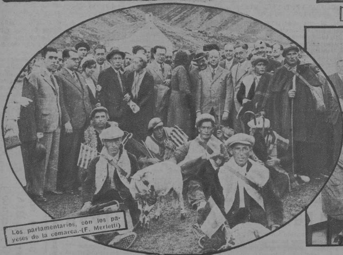
Los parlamentarios, con los pa-yeses de la comarca.