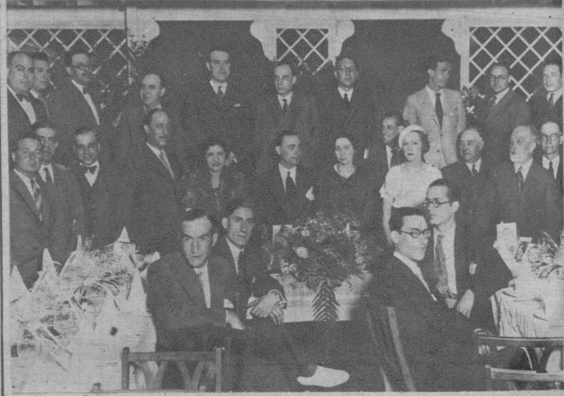
Cena en honor del pintor Morell, celebrada en el restaurant Joanet, de la Barceloneta.