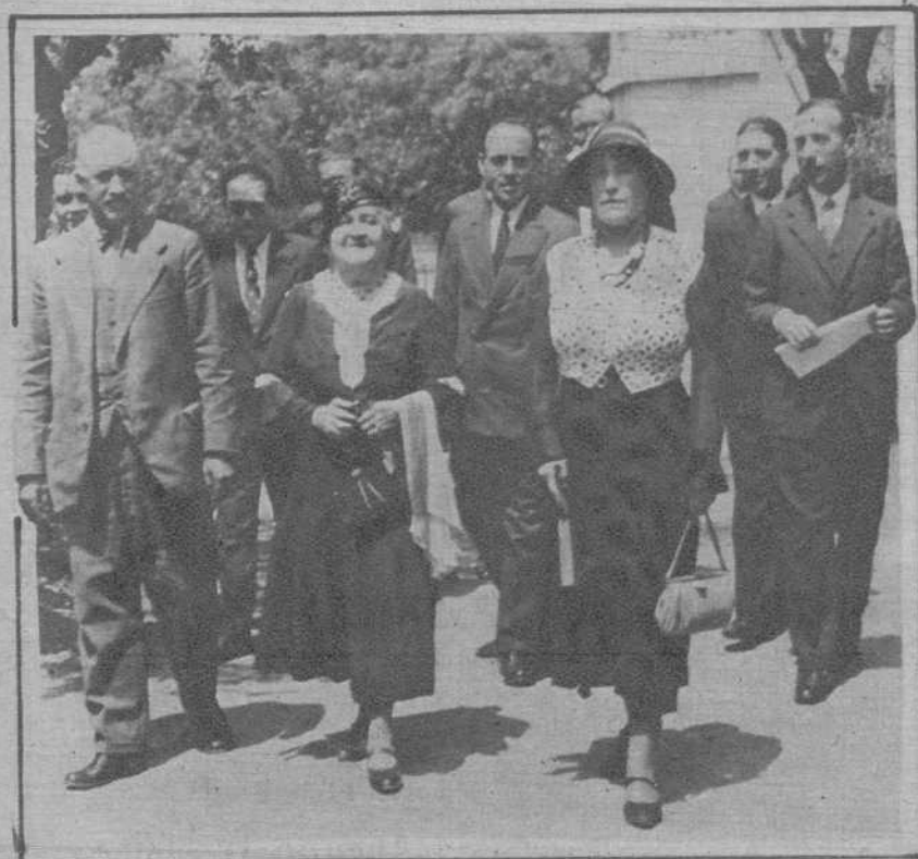
Grupo de adheridos a la «Asociación de los Amigos de los Jardines de Cataluña», reunidos en el del Palacio de Pedaribes.