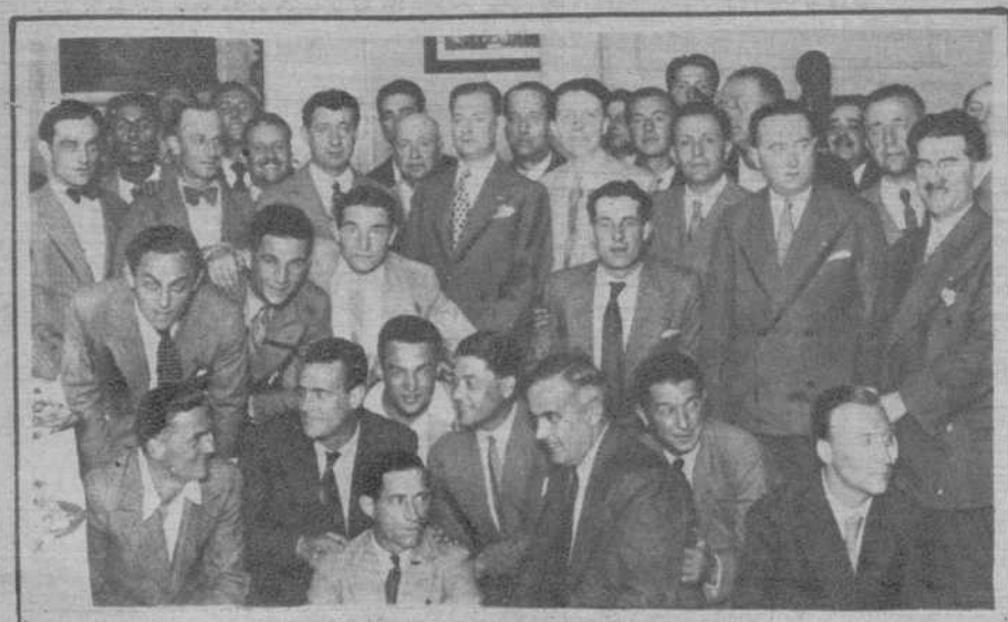
Concurrentes al vermut celebrado en la Casa de los Italianos, en honor del equipo de fútbol de Torino, y a cuyo acto asistió el Cónsul de dicha nación en Barcelona.