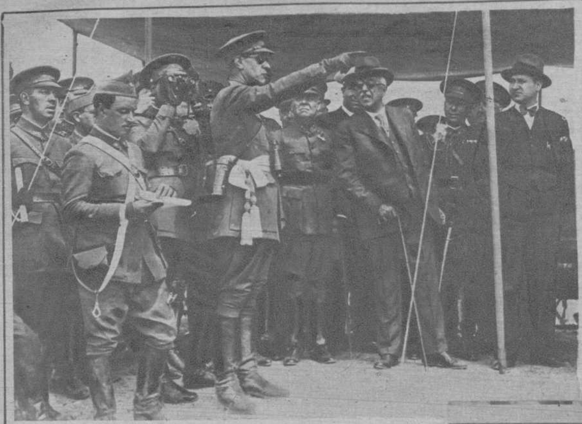
Madrid.—El Presidente de la República, presenciando las maniobras militares celebradas en el campamento de Carabanchel, y en cuyo acto fueron entusiastamente vitoreados don Niceto Alcalá Zamora y el ministro de la Guerra, señor Azaña.