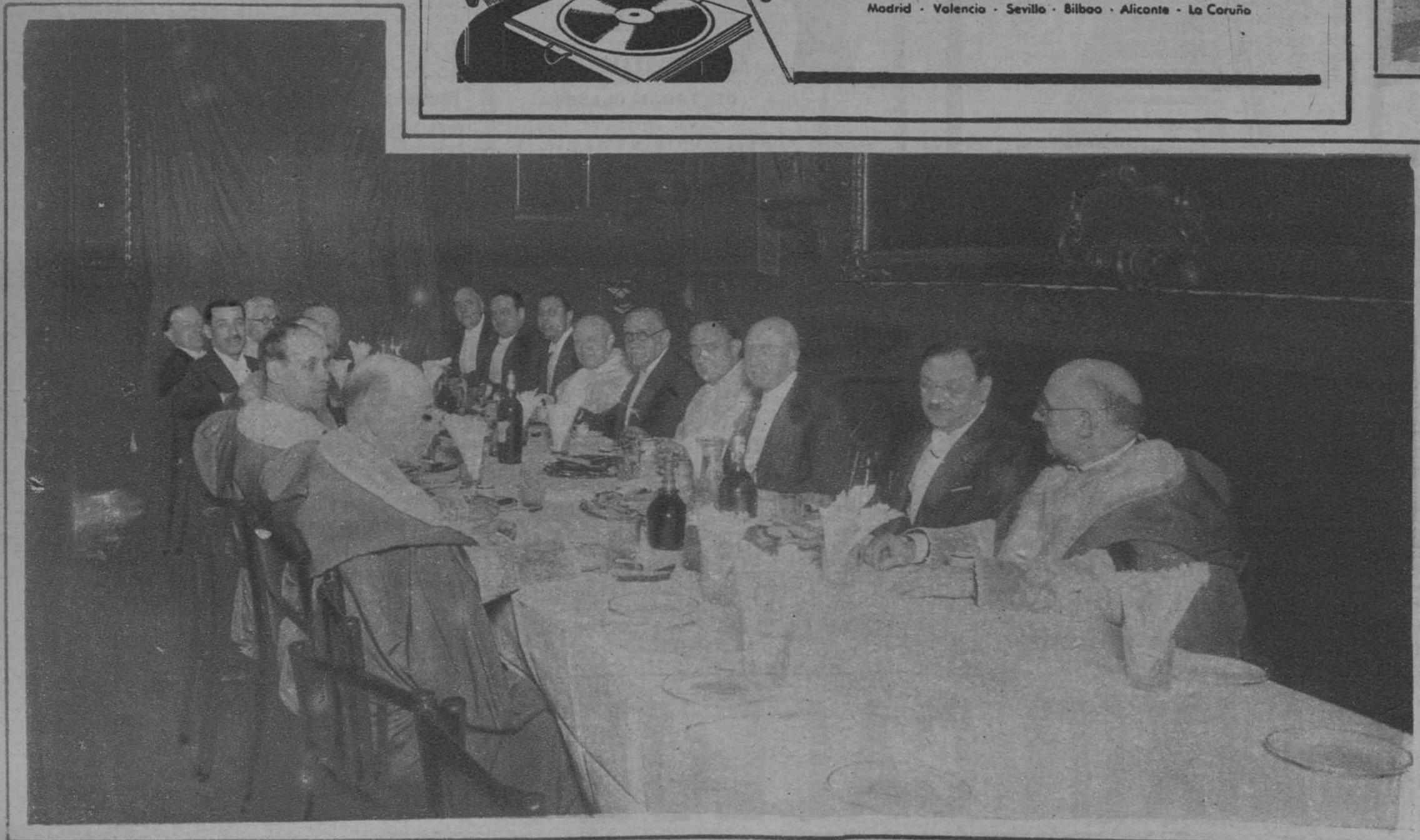
Del Jueves Santo. — Según la costumbre tradicional, ayer, después de los oficios religiosos propios del día, el Cabildo catedral obsequió con un desayuno a los concejales del Ayuntamiento barcelonés que concurren a aquéllos.