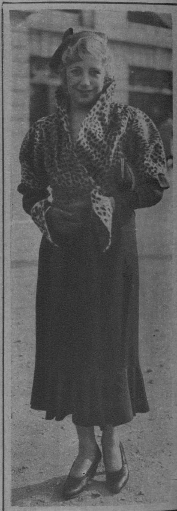
La moda en París.—«Miss París 1931», luciendo un bello modelo de Primavera, en las carreras de Auteil.