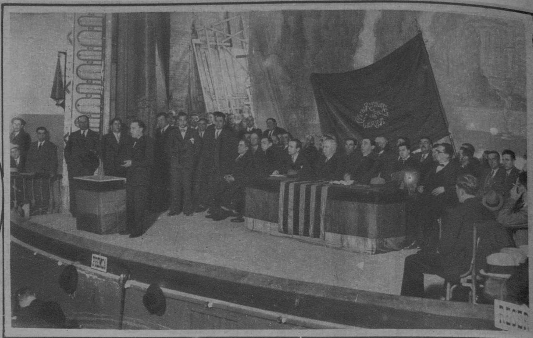
Lérida.—Presidencia del mitin celebrado por el partido radical de esta ciudad, ante un auditorio tan entusiasta como numeroso.