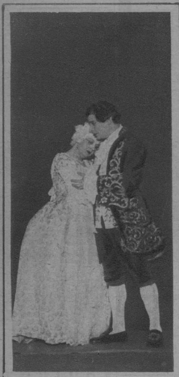
Madrid.—Una escena del drama «Clavijo», de Goethe, puesto en escena en el teatro Español, por la Compañía de Margarita Xirgu, con motivo del homenaje tributado a la memoria del glorioso poeta alemán.