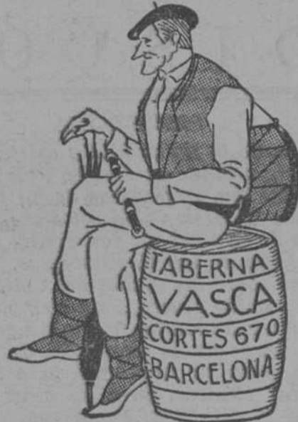
(Junto al Ritz)

Inauguración mañana, Sábado de Gloria, 26 de Marzo de 1932. Todas las especialidades Vascas. Teléfono, 14701